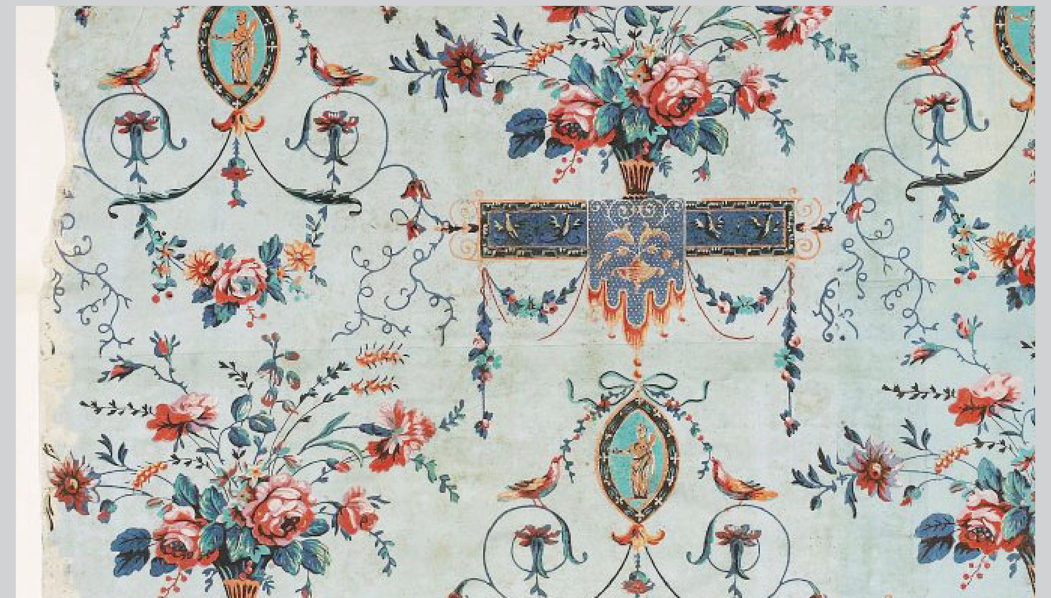
Hercule portant la massue et la pomme du Jardin des Hespérides, papier peint en arabesques, France, manufacture inconnue. Provenance Hôtel Dewez, Bruxelles, rue de Laeken 75. © KIK-IRPA, Bruxelles 2007. Hercules met knots en de appel van de Tuin van de Hesperiden, behangpapieren in arabes, Frankrijk, manufacturer onbekend. Herkomst Hôtel Dewez, Brussel, Lakensestraat 75. © KIK-IRPA, Bruxelles 2007.

Als een ware 'archeologie op de muren' moet de systematische studie van de sporen van vroegere toestanden de virtuele reconstructie van de stilistische en chromatische evolutie van het bestudeerde interieur mogelijk maken, en zo bijdragen tot de geschiedenis van de smaak. De resultaten van deze onderzoeken moeten zowel dienen voor de kunstgeschiedenis en voor de geschiedenis van de technieken als voor de restauratie van de bestudeerde gebouwen. http://org.kikirpa.be/ppintro/indexnl.html .