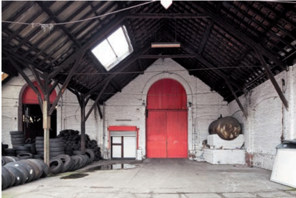
Afb. 13 Detail van een van de hallen van de vroegere gieterij, met haar luifel met eiken draagstructuur (2012).