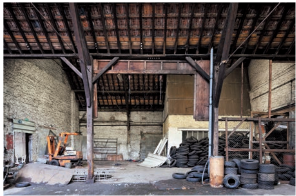
Afb. 16 Binnenzicht van de vroegere zandvormenmakerij (2012).