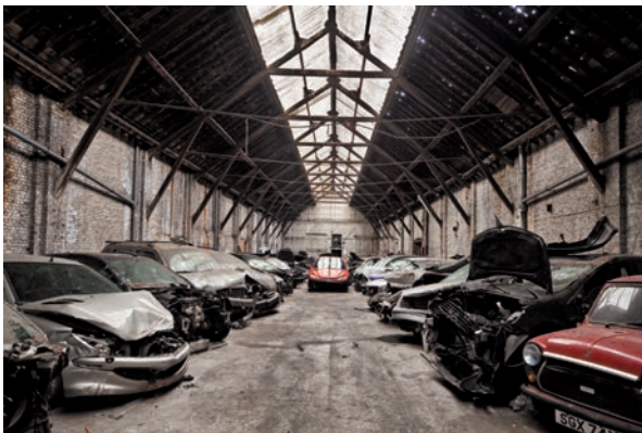
Afb. 15 Binnenzicht van het vroegere Grand Magasin of montageatelier, dat dienstdoet als opslagplaats voor autowrakken (2012).