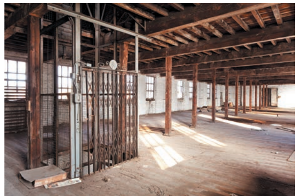
Afb. 7 en 8

Binnenzichten van de vroegere indiennefabriek. De plankenvloeren en eiken balken worden ondersteund door kolommen uit dennenhout (2012 © Helen Hermans).