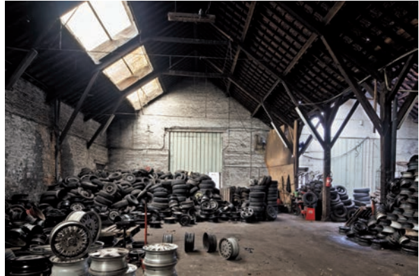
Afb. 14 Binnenzicht van de vroegere gieterij (2012).