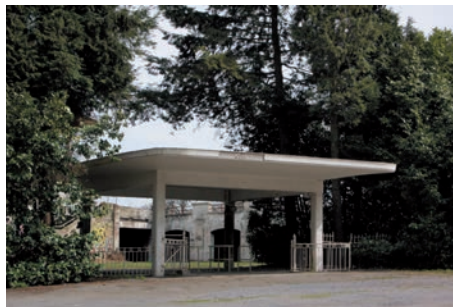
Afb. 7 Ingang van de renbaan, Terhulpensesteenweg 53 in Ukkel, arch. Paul Breydel.