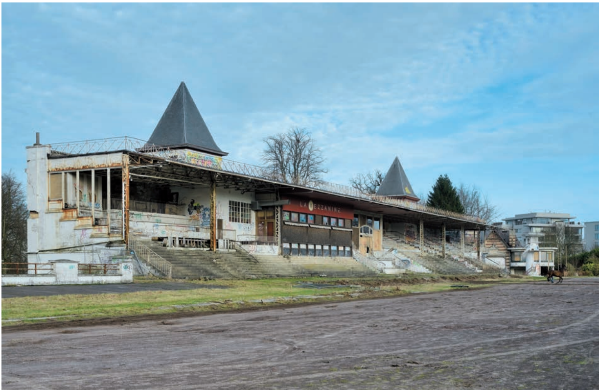
Afb. 10 De grote tribune in 2013.