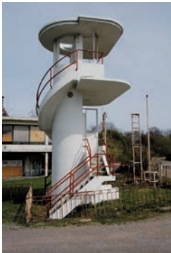
Afb. 9 Starttoren, arch. Paul Breydel (2013).