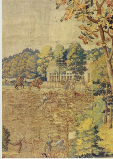
Het S'Heeren huys of Huys van Staketsel zoals afgebeeld op het wandtapijt met de voorstelling van de maand oktober uit de serie Les belles chasses de Maximilien (1531-1533), geweven door Van Dermoyen naar Barend Van Orley. Detail van het wandtapijt.

In de 16de eeuw was er aan de rand van het Zoniënwoud, in de omgeving van Boondaal, een enorm gebouw dat als bevoorrecht kader diende voor een ander type van 'voorstelling'. Het werd in 1504 opgetrokken in steen en werd zo ingericht dat het hof comfortabel kon genieten van het schouwspel van de dood van het wild, een hert, dat door de klopjacht meedogenloos naar de omheinde ruimte voor het huis was gedreven. Op 12 november 1531 vond er een groot toernooi plaats dat duizenden Brusselaars aantrok; ook keizer Karel V, zijn zuster Maria en de hele adel waren present. In 1544 was het hof er vaak aanwezig voor de toernooien, banketten en jachtpartijen in het kader van de festiviteiten die in Brussel werden gehouden ter ere van Eleonora, de zuster van de keizer. Het gebouw, dat S'Heeren huys of Huys van Staketsel werd genoemd, raakte echter in verval en verdween volledig begin 19de eeuw. Het bevond zich op de plaats in Elsene waar nu de Derbylaan en de Italiëlaan elkaar kruisen. 1