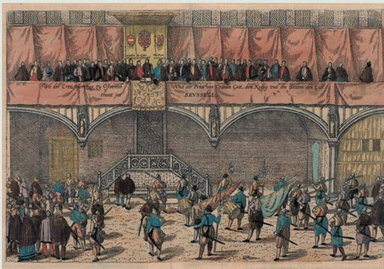
Frans Hogenberg, De eedaflegging van aartshertog Matthias en de Prins van Oranje op de Grote Markt in 1578.