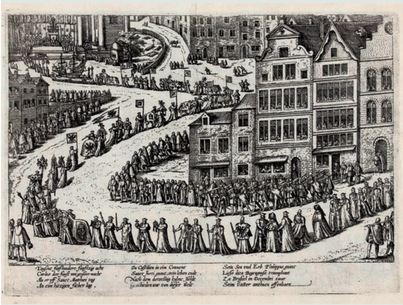
Frans Hogenberg, Rouwprocessie voor Keizer Karel in Brussel op 28 december 1558