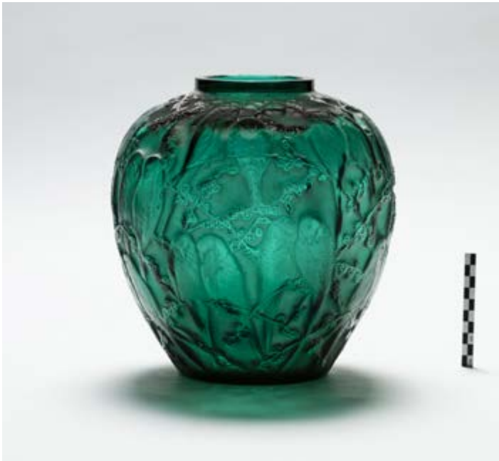
Vaas met parkieten, René Lalique, ca 1920, verz. Museum Van Buuren.

te toetsen aan de lokale realiteit. Aansluitend worden, aan de hand van de tuinen die op de bewaarlijst van het Brussels Hoofdstedelijk Gewest zijn ingeschreven, de evolutie van het beschermingsbeleid en het onderzoek naar het ontwerp van privétuinen uit het interbellum tegen het licht gehouden.