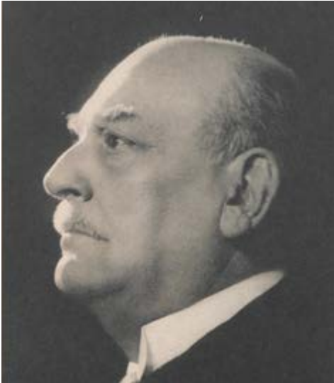
AFB. 1 Émile Francqui (1863-1935), officier van de Congo-Vrijstaat, consul in China, directeur van de Generale Maatschappij van België, voorzitter van de Banque d'Outremer, eerste voorzitter van het Instituut voor Tropische Geneeskunde, algemeen directeur van de Union minière du Haut Katanga en een van de leidinggevende van het Comité national de secours et d'alimentation.