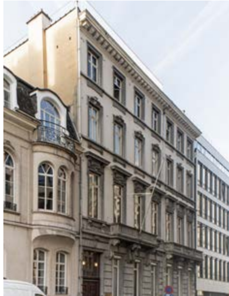
AFB. 5 Gevel van de Universitaire Stichting, Egmontstraat 9-11, 1945, arch. Maurice Haeck.

het Belgische en internationale academische leven. De zetel werd een plek voor lezingen en kennisuitwisseling waar (buitenlandse) onderzoekers konden verblijven. Om de snelle groei te ondersteunen, startte de Stichting reeds in 1923 een grootschalig uitbreidingsproject. De aankoop in 1924 van verschillende aangrenzende gebouwen in de Marsveldstraat maakte een aanzienlijke vergroting van haar opvang- en actiecapaciteit mogelijk 8 .