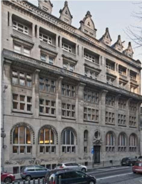
AFB. 4 Gevel van de Universitaire Stichting, kant Marsveldstraat, Uitbreiding 1930, arch. Ernest Jaspar.