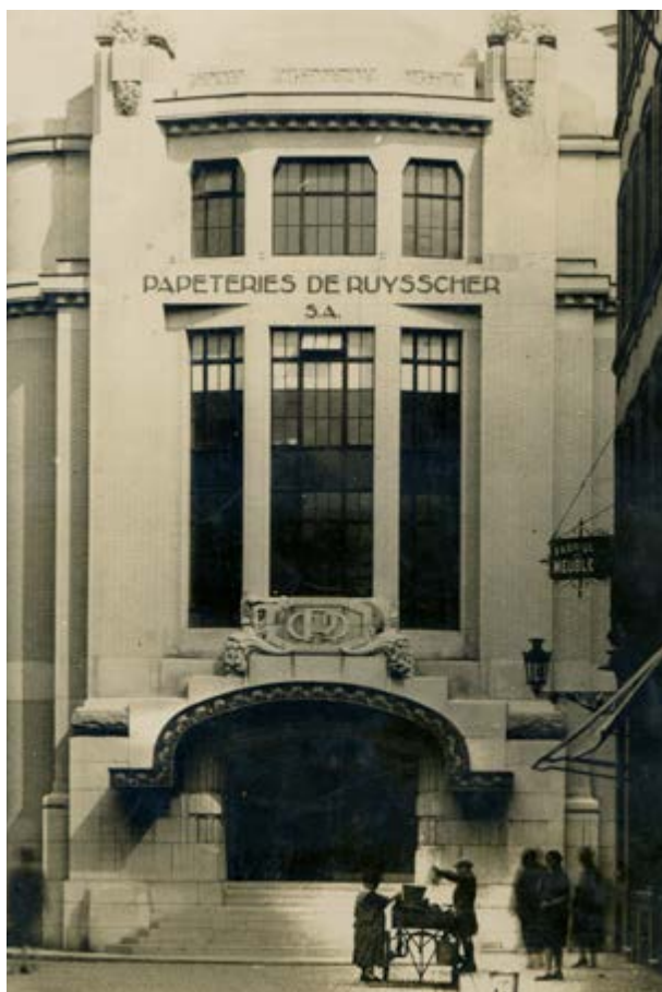
AFB. 4 Émile Sergysels, ongepubliceerde foto van de hoekingang van de uitbreiding van Papeteries De Ruyscher, s.d. [tussen 1927 en 1933] (© Privéverzameling - reproductie verboden).