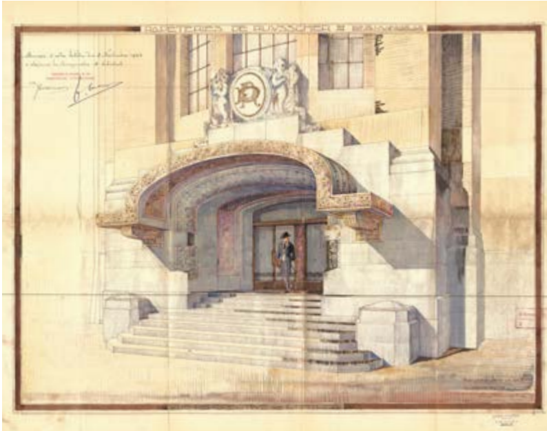
AFB. 3 Eugène Dhuicque, uitbreiding voor Papeteries De Ruyscher : perspectieftekening van de ingang, 22 oktober 1924.

door een afgeschuind deel dat de nieuwe hoofdingang van de papierfabriek zou huisvesten. Die ingreep was bedoeld om de fabriek een monumentaal uitzicht te geven, 'une aspect monumental eu égard à [leur] situation en vue des grands boulevards du centre' 8 .