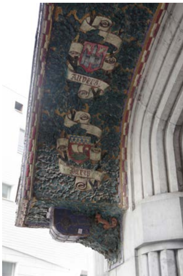
AFB. 5 Detail van de decoratieve keramische elementen op de luifel.

Naast de veelkleurige luifel valt de ingang ook op door de imposante cartouche met het monogram 'CDR' – voor Corneille De Ruyscher – die het portaal bekroont. Hij is achthoekig en wordt omringd door in bas-reliëf uitgehouwen hoorns des overvloeds, eikenbladeren en symbolen die naar de industriële activiteiten van de Papeteries verwijzen: links een pers en rechts een tandwiel. Merk op dat het profiel van het fronton bovenaan de gevel overeenkomt met de bovenste helft van de cartouche.