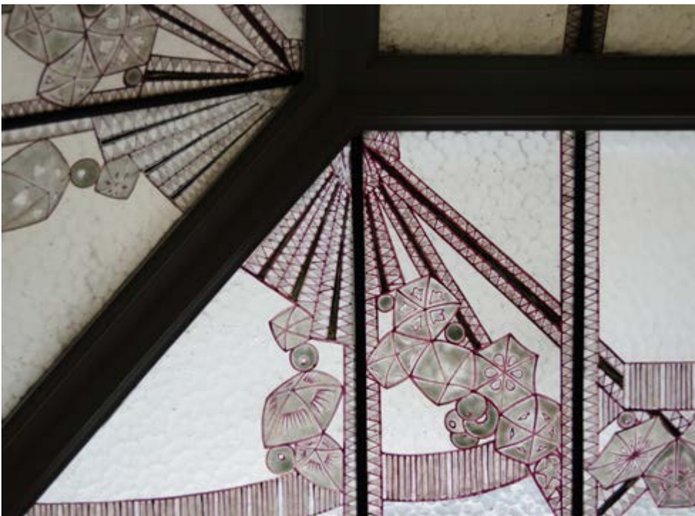
AFB. 9 Armand Paulis: detail van het beschilderde daklicht in de vestibule van de toiletten van de directie (© CHE).