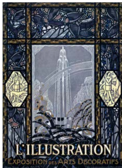
AFB. 10 "Le Jet d'Eau", gegraveerd glas door Gaëtan Jeannin, gebaseerd op een karton van Clément Mazard, voor de toegangsdeur van het Pavillon des Vitraux op de Exposition internationale des Arts décoratifs et industriels modernes in 1925 ( L'Illustration , 1925 © Privéverzameling).