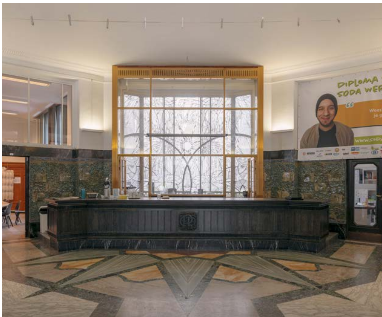
AFB. 7 Hal met balie en bow-window.

Langs de Zespenningenstraat namen de kantoren van het personeel de linkervleugel van de benedenverdieping in beslag. Deze vleugel wordt ontsloten door een gang met een vloer van mozaïektegels omzoomd met een marmeren rand. De muren zijn bedekt met een groene marmerstuclaag. De plinten en het bovenste gedeelte zijn van grijs marmer.