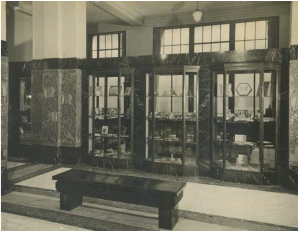
AFB. 8 Émile Sergysels, ongepubliceerde foto van de hal van de uitbreiding van Papeteries De Ruyscher en het meubilair, s.d. [tussen 1927 en 1933] (© Privéverzameling - reproductie verboden).