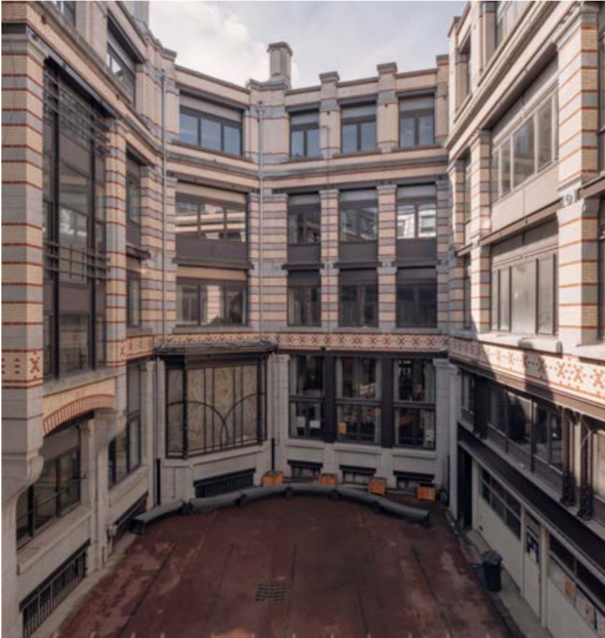
AFB. 6 Gevels van de binnenplaats (© B. Dias Ventura).