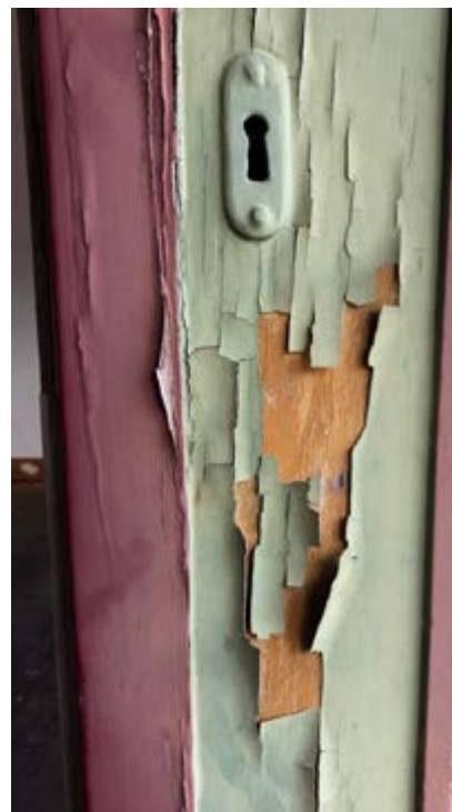
AFB. 6 Detail van schrijnwerk. De tweekleurenbehandeling die tijdens de restauratie van 1988-1991 werd toegepast.

vermijden dat er nieuwe problemen ontstaan, zijn tests op schoongemaakte en weinig zichtbare delen onontbeerlijk.