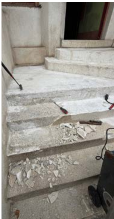
AFB. 4 Trap bij de inkom, verwijdering van de dunne laag die in 1990 werd aangebracht.