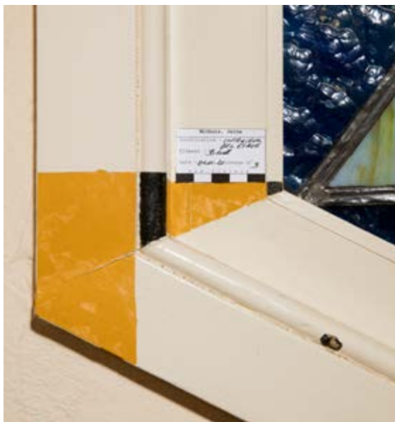
AFB. 9 Interieur, trappenhuis, testvenster met de oorspronkelijke afwerking van de omkadering van het glasraam in Étude des finitions décoratives des espaces intérieurs de la Withuis , 2020