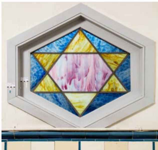
AFB. 10 Interieur, glasraam in het trappenhuis in Étude des finitions décoratives des espaces intérieurs de la Withuis , 2020

De meeste afwerkingen aan de voorgevel zullen daarom gebaseerd zijn op deze waarvan wordt aangenomen dat ze in 1927 werden aangebracht.