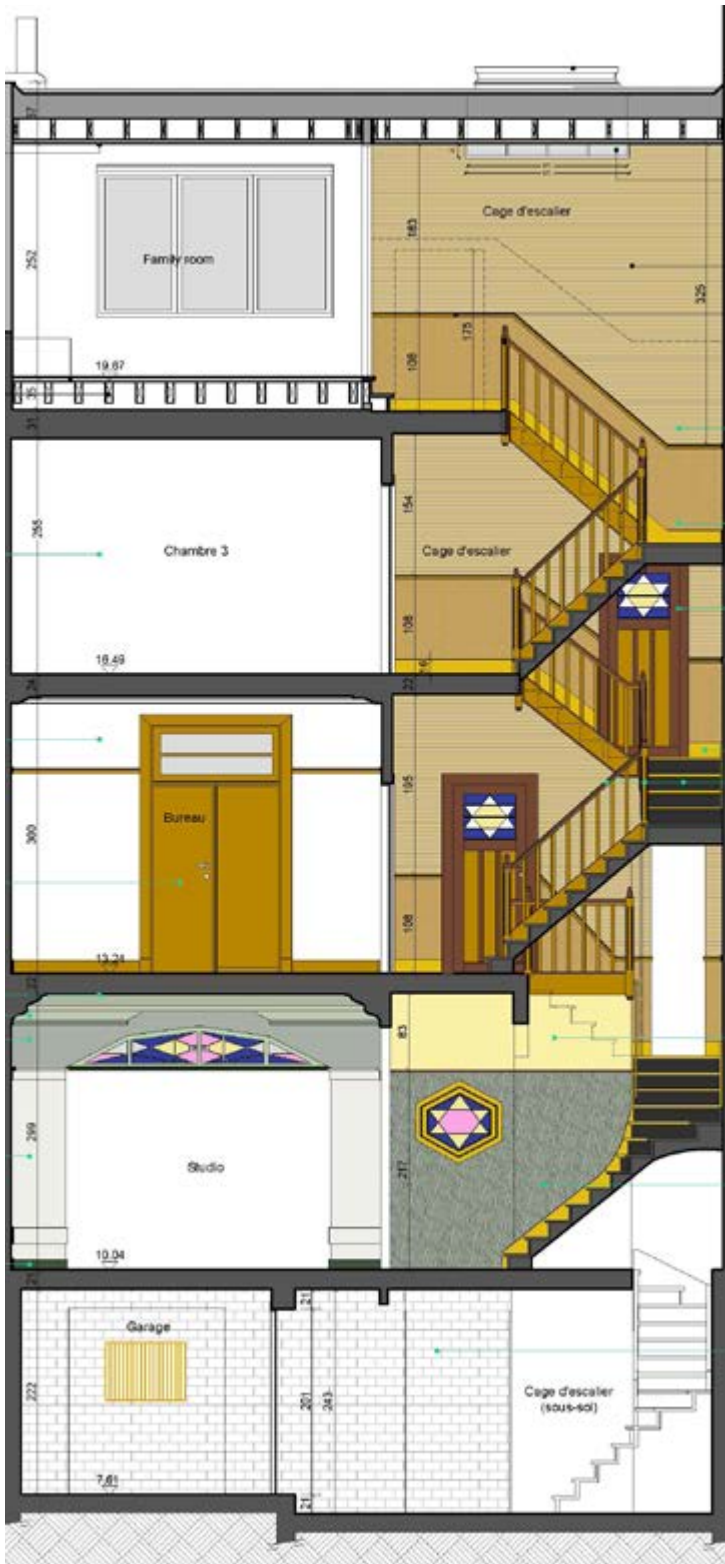
AFB. 7 Trappenhuis, project om de oorspronkelijke afwerking te herstellen op basis van stratigrafische studies (VWG architectes - architecten © architectures parallèles).