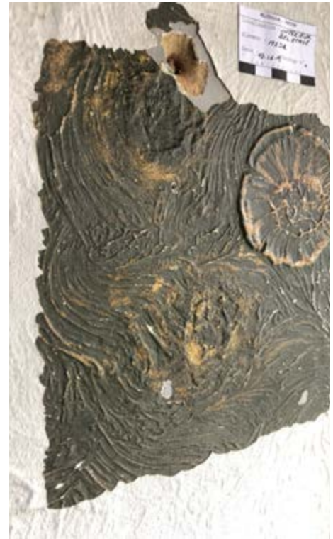
AFB. 8 Intérieur, woonkamer, testvenster met plastidecor, in Étude des finitions décoratives des espaces intérieurs de la Withuis , 2020