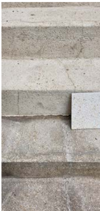
AFB. 5 Afwerkingstest op de oorspronkelijke oppervlakken.