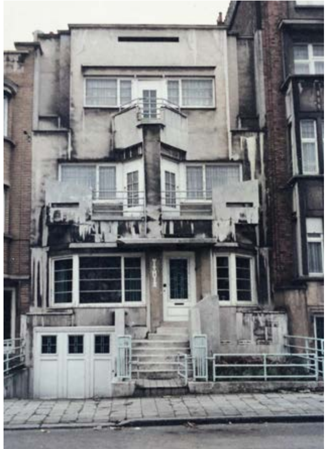
AFB. 1 Het Withuis, Charles Woestelaan 183 in Jette, 1988.

De muurafdekkingen werden vervangen uit functionele noodzaak en er werd aluminium gebruikt in plaats van tegels.