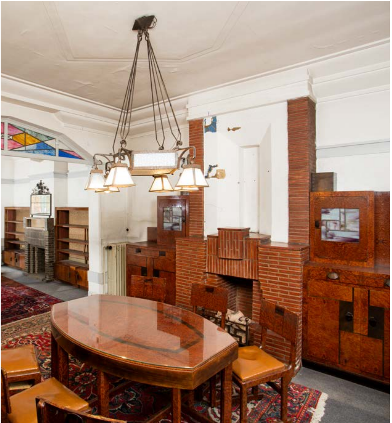
AFB. 11 Eetkamer met oorspronkelijk meubilair in Étude des finitions décoratives des espaces intérieurs de la Withuis , 2020.