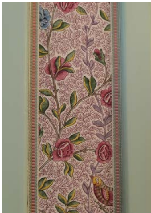
AFB. 10B De dressing, detail van het nieuwe behangsel.