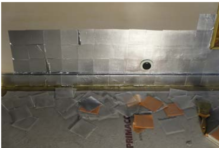
AFB. 8B De slaapkamer, herstel van de aluminium bladversiering.