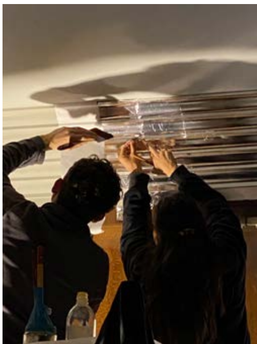
AFB. 7A De eetkamer. De restauratie van de aluminium bladversiering op de kroonlijst (© Atelier d'architecture CAZ sc sprl).