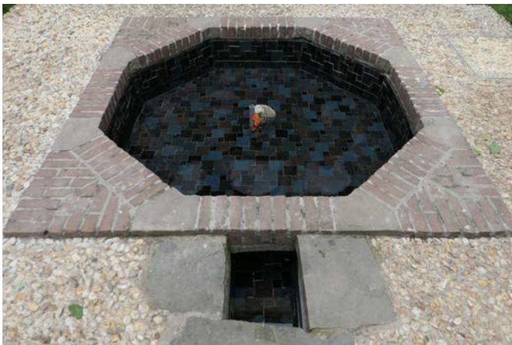
AFB. 13B De tuin, het waterbekken na de restauratie.