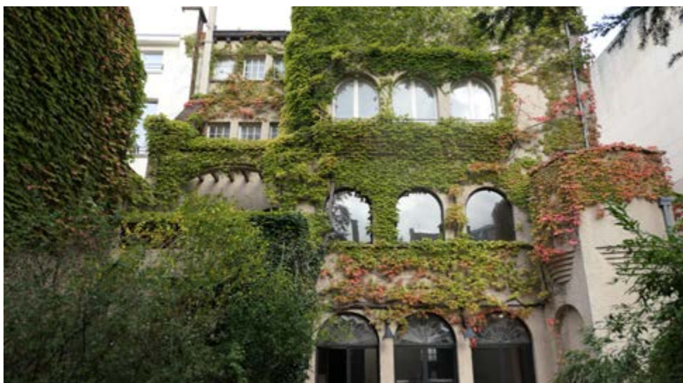
AFB. 2 De achtergevel, voor de restauratie, overwoekerd door de wingerd.

door een wingerd, vertoonde een complex geheel van problemen die een delicate, respectvolle ingreep vereisten op maat van de situatie (AFB. 2).