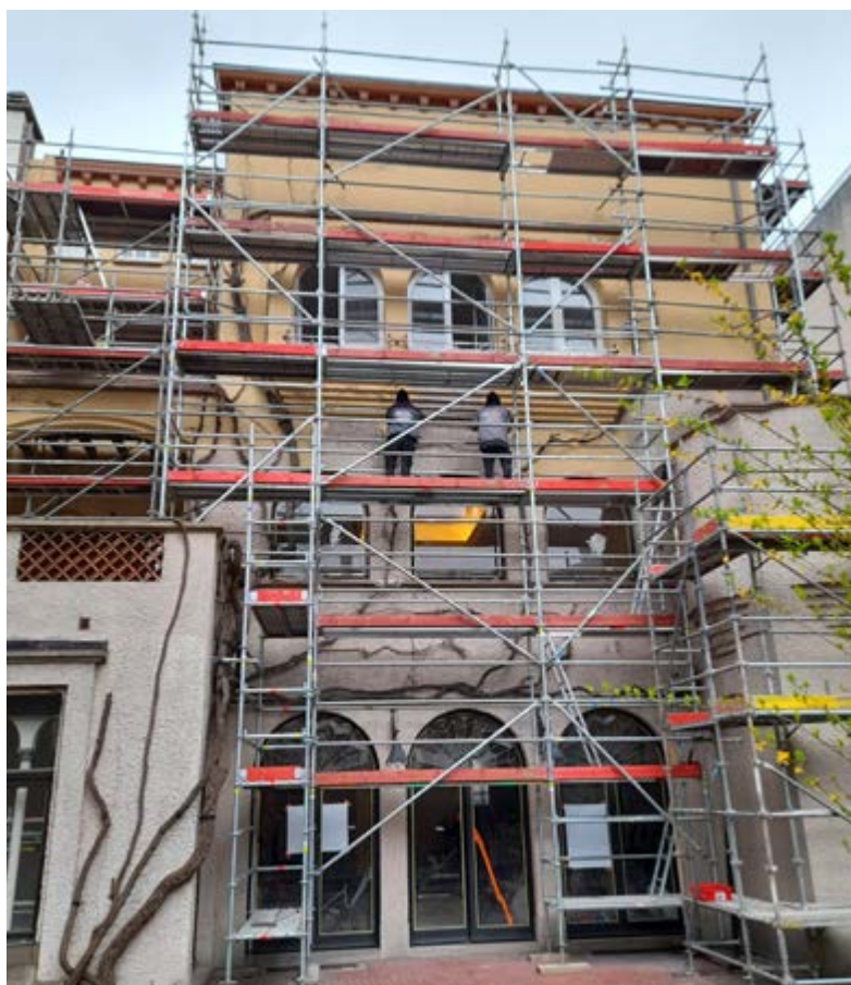
AFB. 4 De achtergevel, tijdens de restauratie, met de door jute beschermde structuur van de wingerd (E. Demelenne, 2023 © urban.brussels).