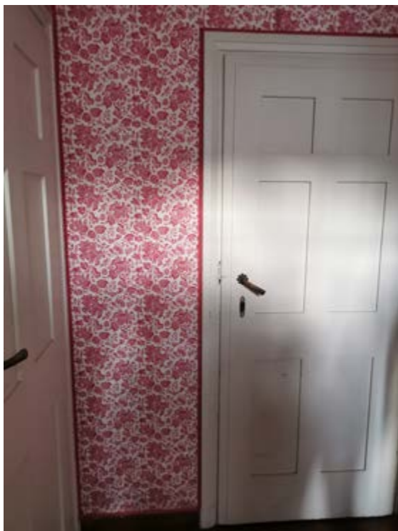
AFB. 10A De dressing, voor de restauratie.