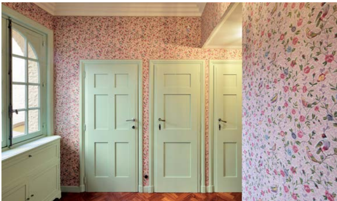
AFB. 10C De dressing, na de restauratie (© Atelier d'architecture CAZ sc sprl).