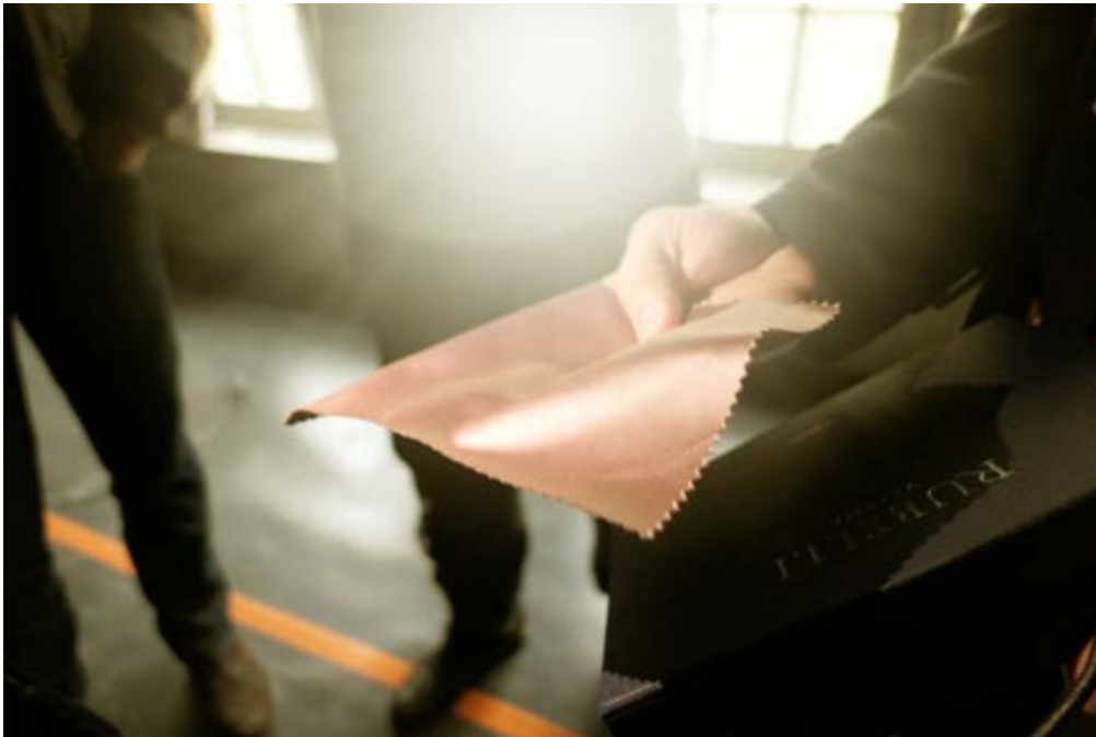
AFB. 9A De slaapkamer, zoektocht naar een decoratiestof.