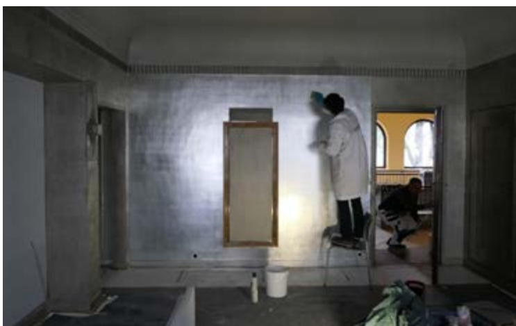
AFB. 8C De slaapkamer, herstel van het patina van de versiering.

met gouden accenten aan de zijwanden, die bijzonder goed samengaan met de kostbare lambrisering op de hoofdwand.