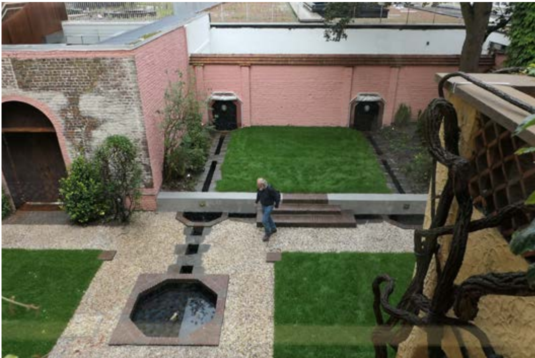
AFB. 12B De tuin, de kiezelpaden na de restauratie.