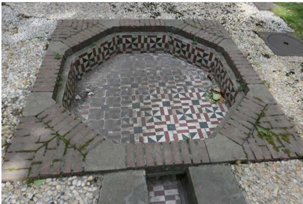
AFB. 13A De tuin, het waterbekken voor de restauratie.