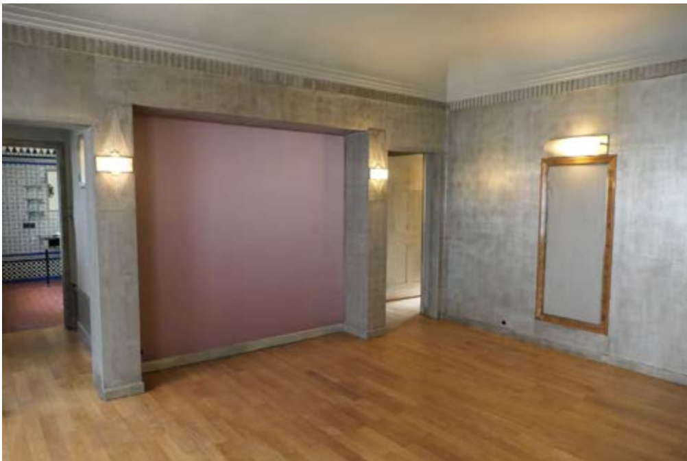
AFB. 9B De slaapkamer, na de restauratie.