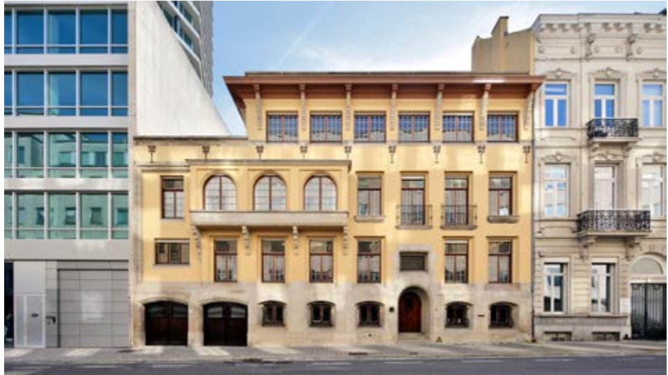
AFB. 1 Het Huis Wielemans, Defacqzstraat 14, Brussel, gevel na de restauratie.