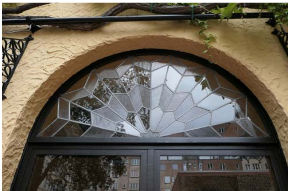
AFB. 3 Detail van de achtergevel, na de restauratie (C. Criquillon, 2024 © urban.brussels).