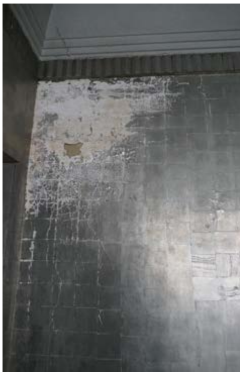
AFB. 8A De slaapkamer, aluminium bladversiering, beschadigde zone.