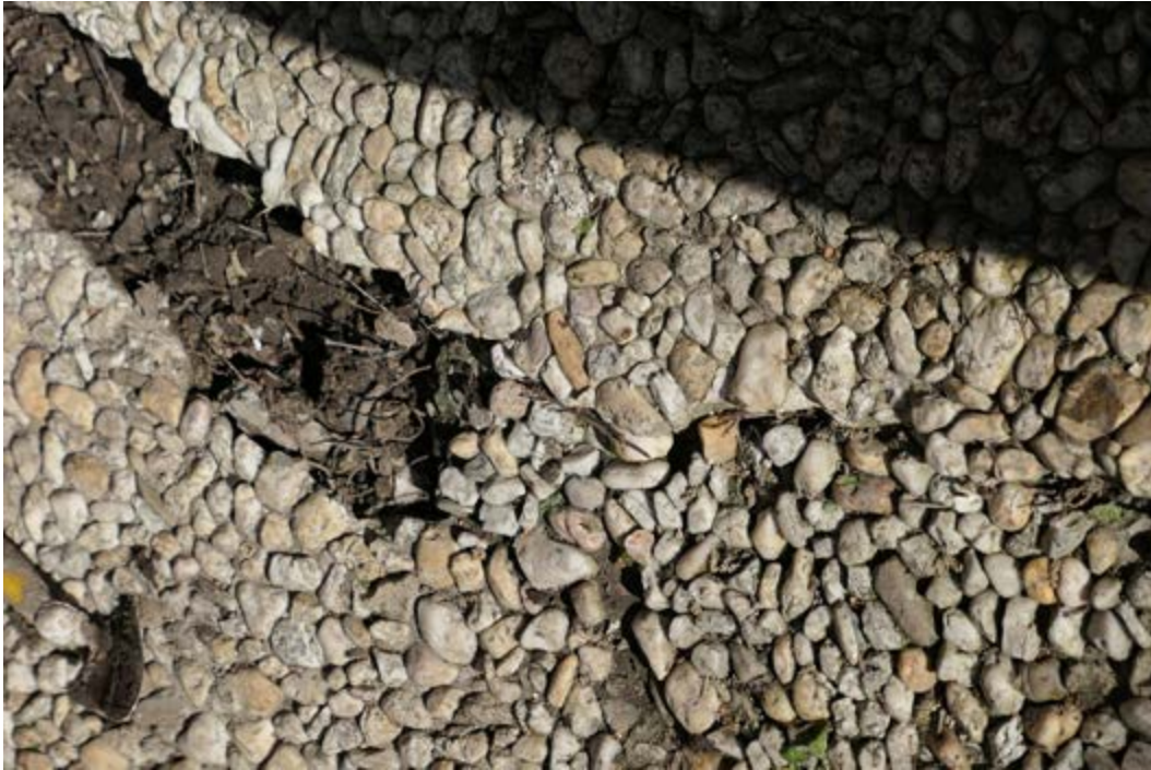
AFB. 12A De tuin, detail van de schade aan de kiezelpaden.