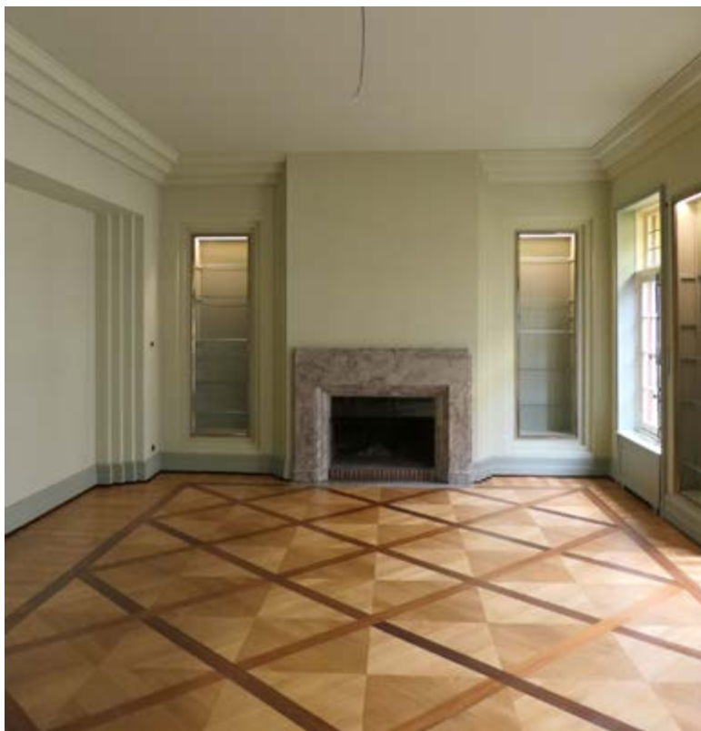
AFB. 6 De salon op de begane grond, na de restauratie.