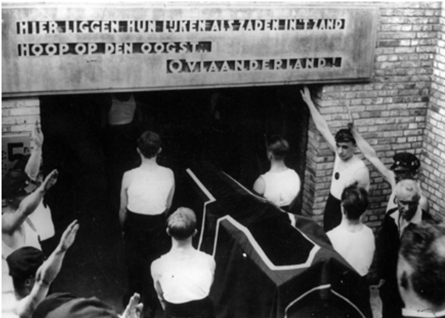
AFB. 4 IJzerbedevaart, 1932 (Sipho fonds © Cegesoma/ Algemeen Rijksarchief).

paddenstoelen uit de grond rijzen. Het model is evenwel kwetsbaar, zoals de economische crisis zal aantonen.