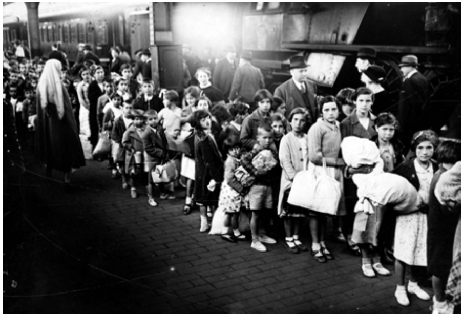
AFB. 6 Aankomst Spaanse kinderen in Brussel.

België voert op zijn beurt het betaald verlot, de veertigjarige werkweek en loonsverhogingen in. De Spaanse burgeroorlog leidt tot intense binnenlandse debatten over de legitimiteit van een interventie. Net als elders sluiten Belgische jongeren zich aan bij de internationale brigades, terwijl Spaanse kinderen in Belgische gezinnen worden opgevangen (AFB. 6).