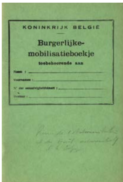
AFB. 7 Burgerlijke mobilisatieboekje.