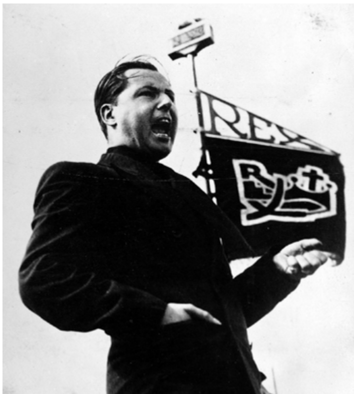
AFB. 5 Léon Degrelle, leider van Rex, 1936.

de democratische regimes. Met de opkomst van Hitler in januari 1933 en van andere dictaturen nemen de internationale spanningen verder toe. In 1939 blijven er in Europa nog slechts 11 democratieën over. Die situatie leidt tot een stroom van vluchtelingen die hun land ontvluchten om aan politieke en religieuze vervolging te ontsnappen. Anderen migreren om economische redenen, gedreven door overlevingsdrang. Als nieuwkomers worden ze in crisistijden vaak gezien als oneerlijke concurrenten die bereid zijn voor lagere lonen te werken. Xenofobie laait op en voedt het politieke debat. Het Belgische immigratiebeleid schommelt tussen tolerantie en strengheid, afhankelijk van de economische situatie en de visie van de beleidsmakers. Aangezien er geen sociaal beschermingssysteem voorhanden is, leidt de economische crisis tot toenemende armoede. Vooral vrouwen worden getroffen, omdat zij steeds vaker van de arbeidsmarkt worden uitgesloten.