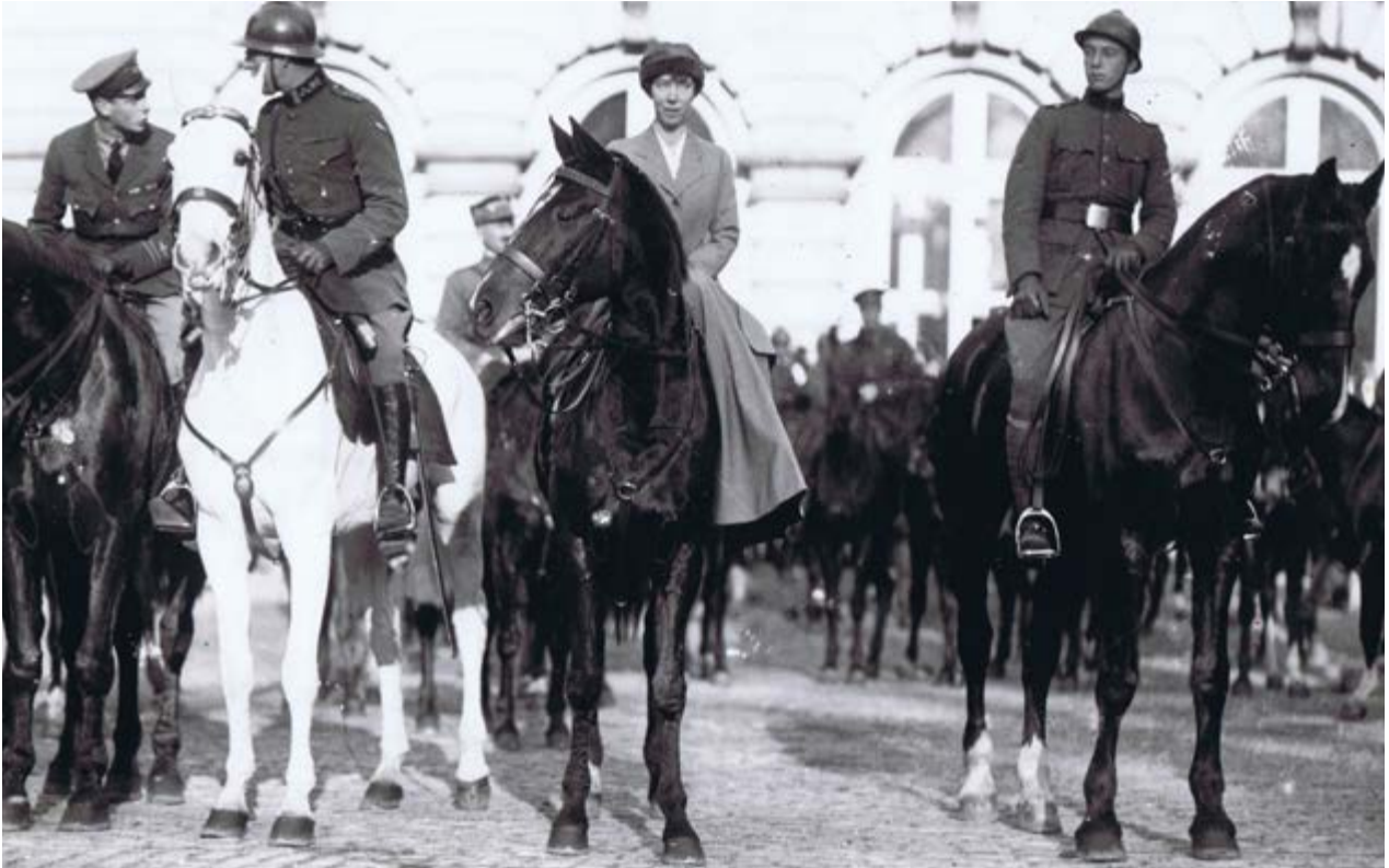
AFB. 1 Brussel, 22 november 1918, 'Blijde Intrede' De koninklijke familie voor het Parlement.

In welke toestand verkeerde België in 1918? Wat waren de grote uitdagingen die de periode die we vandaag het interbellum noemen, zouden vormgeven? Aan het einde van de Eerste Wereldoorlog was België sterk veranderd, zowel op politiek als economisch vlak. Op internationaal vlak was de legitimiteit van het land geëvolueerd. Maar de uitdagingen waren talrijk: een plaats geven aan de doden en aan al wie terugkeerde, het land weer op de rails krijgen, een nieuwe samenleving opbouwen. Het interbellum wordt doorgaans in twee periodes opgedeeld. De eerste periode loopt van eind 1918 tot de crisis van 1929 en staat in het teken van de wederopbouw, een zekere welvaart en een geleidelijke ontspanning van de internationale betrekkingen. De tweede periode, die begint met de economische crisis en eindigt bij het uitbreken van de Tweede Wereldoorlog, wordt gekenmerkt door een algemene verzwakking van de Europese democratieën en het onvermogen om de crisis op te lossen. De dreiging van een nieuwe oorlog hing als een zwaard van Damocles boven de samenleving.