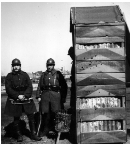
AFB. 8 Het Belgische leger aan de start van de oorlog, 1939-1940.

toekent. Zoals overal heeft de mobilisatie – die bijna 600.000 mannen treft – grote gevolgen voor de economie en de werking van de Staat. Op 10 januari 1940 stort een Duits vliegtuig neer op Belgisch grondgebied, vlakbij de grens. Aan boord bevinden zich invasieplannen. Interne problemen eisen echter alle aandacht op en slechts op het nippertje wordt eind april een nieuwe regeringscrisis vermeden. Die betreft de herstructurering van het ministerie van Openbaar Onderwijs op basis van taalcriteria. Twee weken later valt het Duitse leger België binnen.