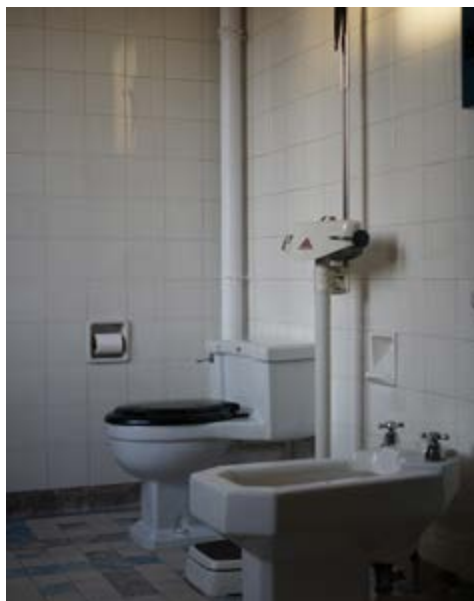
AFB. 6 Tijdens het interbellum worden lichaamshygiëne en comfort één. Detail van de badkamer.

44. Gebruik van het vertrek bevestigd door mevrouw Carine De Crem, interview op 15/12/2024.