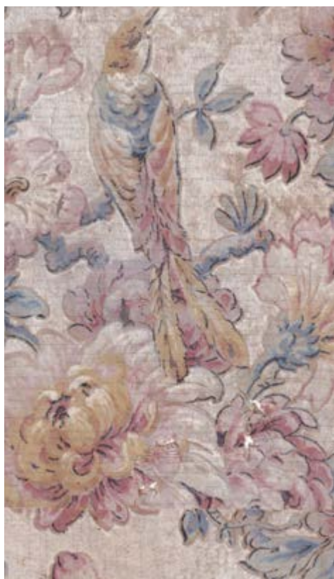
AFB. 4 Bij renovaties verdwijnen meestal alle sporen van de geschiedenis van een huis. Voorzichtigheid is dus geboden, zelfs bij de kleinste aanpassingen. Oorspronkelijk behangpapier, ca 1927, Usines Peters-Lacroix - Haren. Vermelding in de marge van de rol: " U.P.L. FABR. BELGE. 1499.3.M.A ».

30. Alleen schroefsporen op het deurschrijnwerk van voor de verbouwing in 1937.