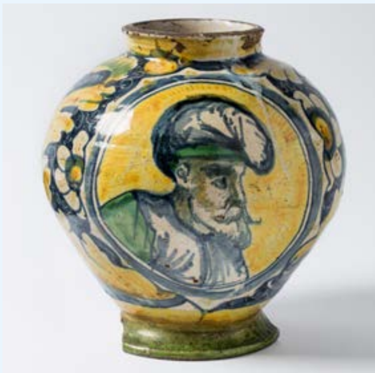
AFB. 1 Bolvaas in Calabrische majolica, 17de eeuw, verz. gemeente Sint-Gillis, inv. 1031P.