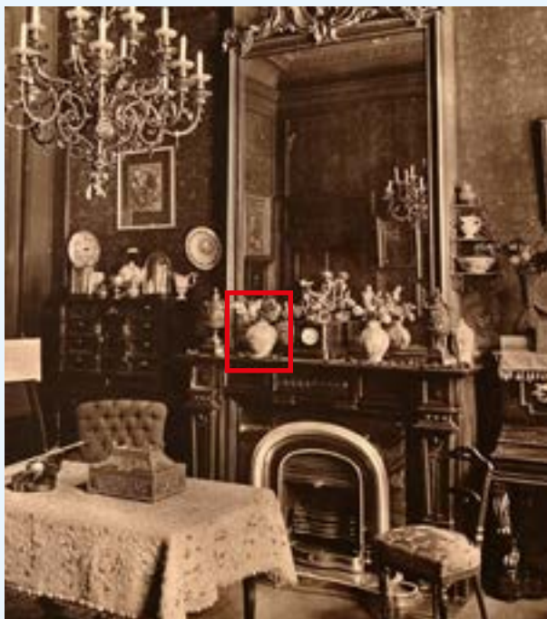
AFB. 2 Het salon in het Speekaertmuseum, circa 1915.

departement Oude Kunst van de Koninklijke Musea voor Schone Kunsten van België. Andere werken, zoals Zeezicht 7 van Pericles Pantazis (Athene, 1849-Brussel, 1884), ondergingen een restauratie. Vandaag siert het schilderij van Pantazis de muren van de Pinacothek Leventis in Nicosia (Cyprus), die via Constantin Economides de restauratie financierde in ruil voor een bruikleen.