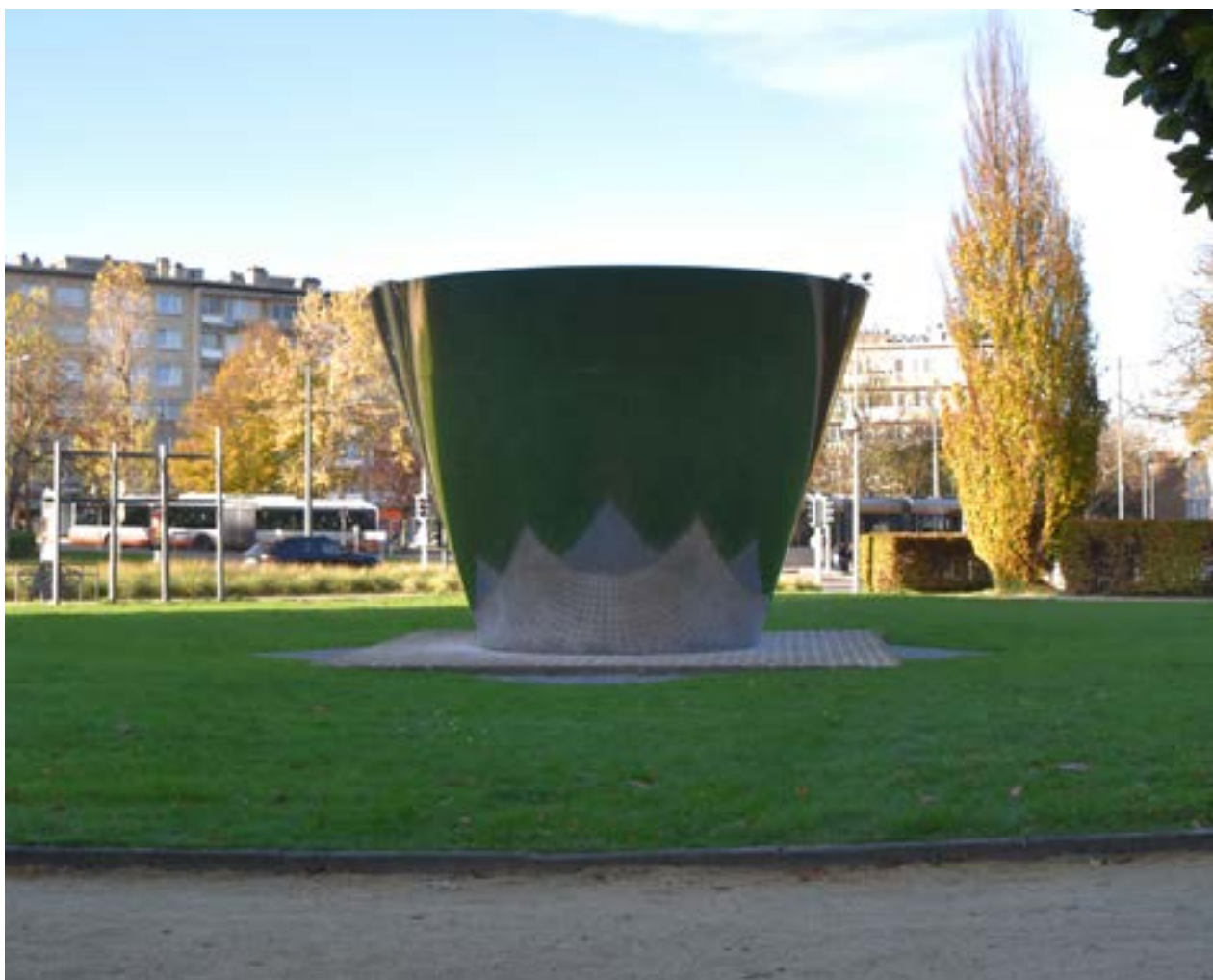
AFB. 3 Parallele Ruimten , beeldhouwwerk in roestvrij staal op keramische voet en hardsteen, Vincent Strebelle, 2001, Evere.