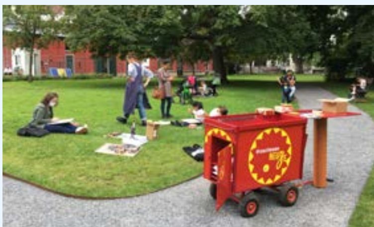
AFB. 2 Het Curieuze Neuze-karretje liet het publiek op een ludieke en creatieve manier kennismaken met de enorme rijkdom van het erfgoed dat bewaard wordt in de Brusselse musea. Hier staat het opgesteld in het Jean-Félix Happark in Etterbeek op 5 juli 2021.

onderwijs door erfgoed. Erfgoed heeft zichzelf bewezen als een effectief hulpmiddel, zowel om te ontdekken wie je bent, waar je vandaan komt en naartoe gaat, als bij het onderwijzen van materies als wiskunde, geschiedenis of aardrijkskunde.