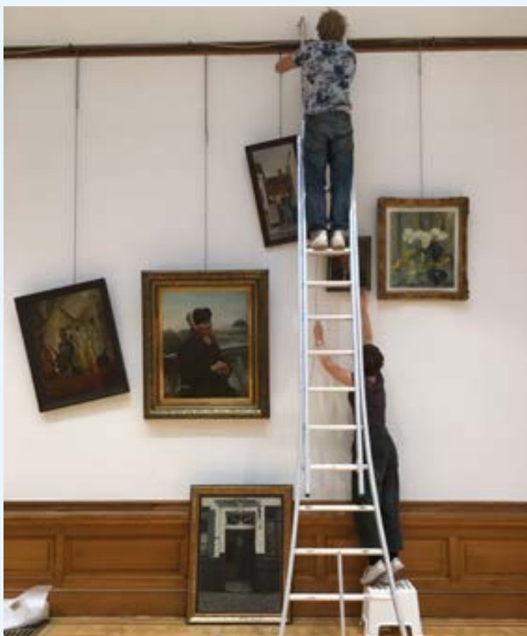
AFB. 1 Voor de tentoonstelling 'Verrassende ophanging: het is in de doos!' in het gemeentehuis van Schaarbeek tijdens de Open Monumentendagen 2019 mocht vzw Patrimoine à roulettes vrij kiezen uit 1700 collectiestukken van de gemeente.