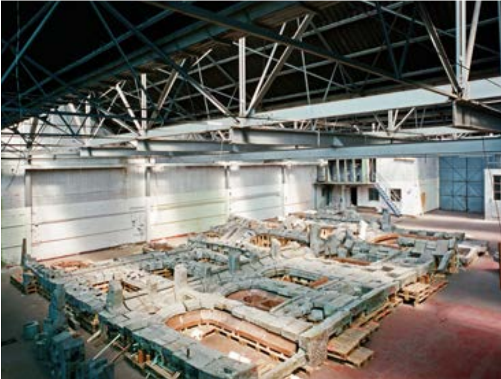
AFB. 2A Reconstructie van de gevel van het Hôtel Aubecq in de François-Joseph Navezstraat 102 in Schaarbeek in 2010 (M. Nouel © urban.brussels).