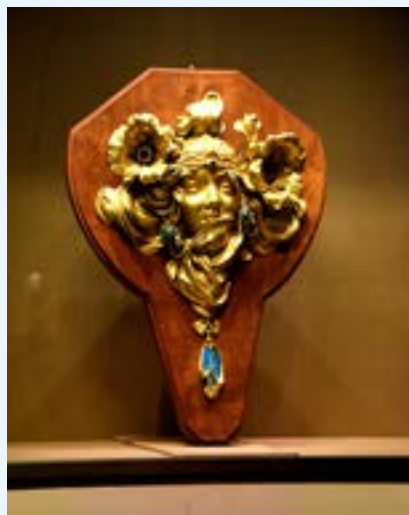
La princesse lointaine , wandlamp van de hand van Adolphe Truffier naar Mucha (2024).