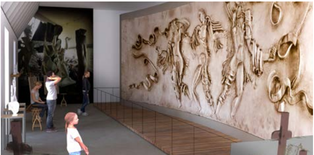
AFB. 3B Simulatie van de eventuele opstelling van het reliëf La danse van Ossip Zadkine in het Joods Museum van België (© Christophe Gaeta).