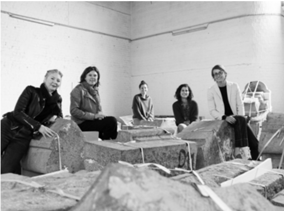
AFB. 2B De gevel van het Hôtel Aubecq zoals ze momenteel bewaard wordt, met het Brusselse team van het atelier XR4Heritage, 2021.