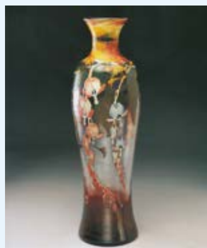
Deze delicate vaas met bloemdecoratie – waarschijnlijk 'gebroken hartjes' – werd ontworpen door de gebroeders Muller, voormalige medewerkers van Émile Gallé, voor de kristalfabriek Val-Saint-Lambert.