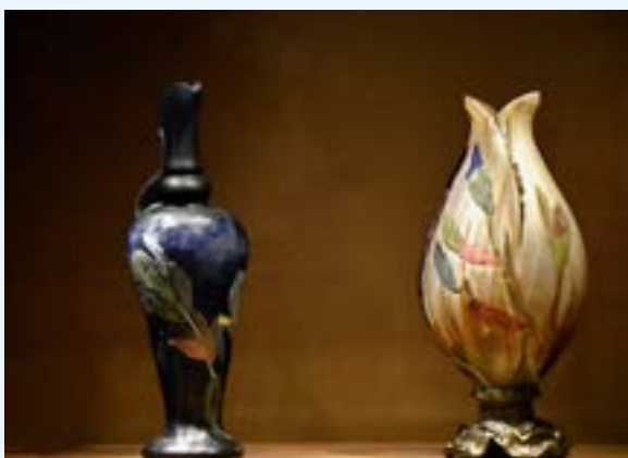
De collectie omvat ook een indrukwekkende reeks glaskunswerken van enkele van de meest gerenommeerde ateliers uit de late 19de eeuw, zoals dat van Johann Loetz Witwe uit Wenen en Émile Gallé uit Nancy.