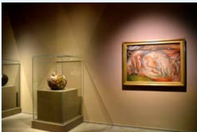
De collectie bevat een aantal schilderijen van symbolistische kunstenaars zoals Fernand Khnopff, Jean Delville, Xavier Mellery en Émile Fabry, wiens Étapes et gestes hier wordt getoond. Links de sierpot Orchidée ontworpen door Philippe Wolfers in 1897.