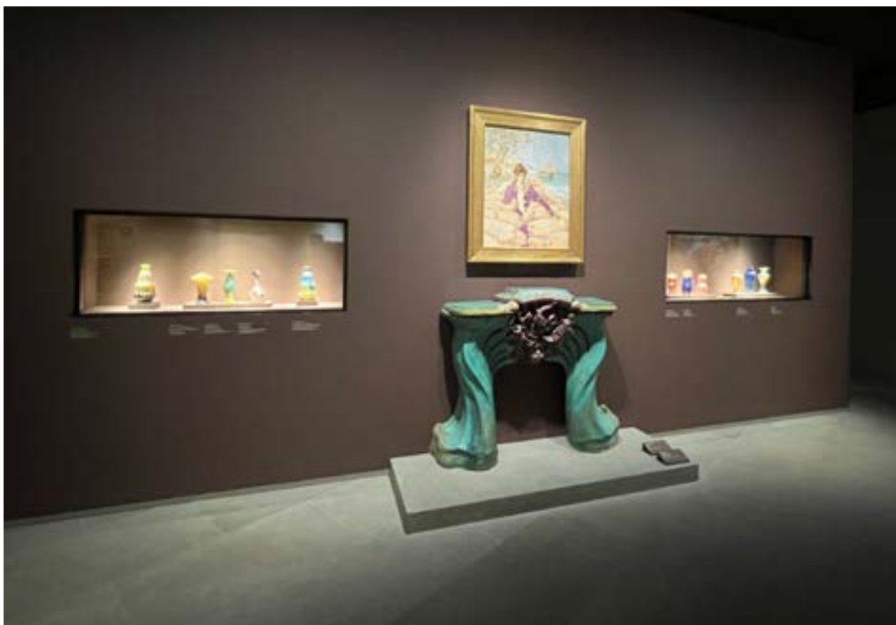
AFB. 1 Verzameling Gillion-Crowet, opstelling in het Fin-de-Siècle Museum in 2023.

het Gewest in 2014 bevoegd werd voor roerend erfgoed, veranderde echter het statuut van de collectie. Voortaan konden ze niet alleen als ontmanteld erfgoed beschouwd worden maar als een op zichzelf staande collectie van kunstobjecten. De granieten stenen hebben ook intrinsieke waarde onder meer omwille van het kwalitatieve steenhouwwerk.