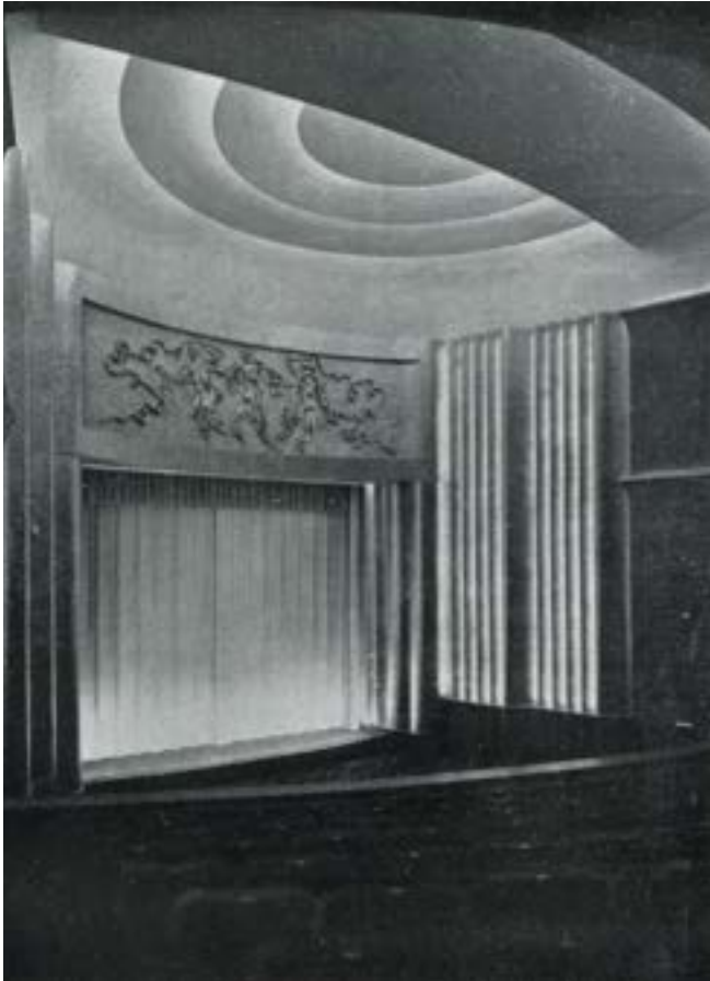
AFB. 3A Reliëf La danse van Ossip Zadkine in zijn originele configuratie, als podiumomlijsting in de bioscoop Métropole ( L'Émulation , 1933, blz. 9).