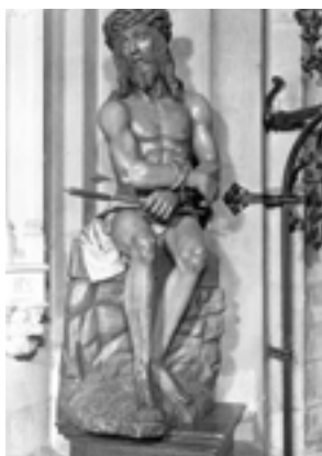
AFB. 4A Christus op de koude steen.