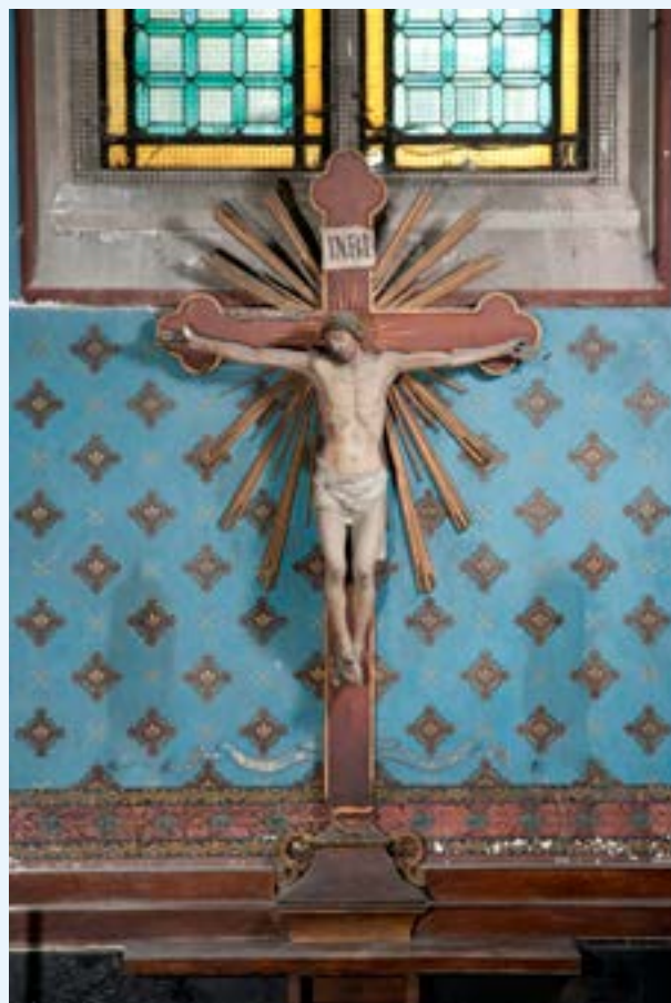
Houten kruisbeeld uit de tweede helft van de 19de eeuw, gefotografeerd in 2012 in de Sint-Katelijnekerk in het kader van een inventarisatie door het KIK (© KIK-IRPA_urban.brussels, cliché X057120).

Deze culturele verscheidenheid komt tot uiting in de voorwerpen die bewaard worden in de voor ediensten bestemde gebouwen. Om ervoor te zorgen dat dit erfgoed goed beheerd wordt, wordt aan elke raad van bestuur van een erkende levensbeschouwelijke instelling een bijkomende inventaris gevraagd, die niet zozeer boekhoudkundig van aard is. Deze inventaris van roerend cultureel erfgoed wordt verplicht door het artikel 66 van de ordonnantie. Hierin wordt cultureel erfgoed gedefinieerd als alle religieuze objecten of objecten die bestemd zijn voor de uitoefening van de gemeenschappelijke of individuele eredienst. Het gaat om goudwerk, religieus meubilair, textiel, schilderijen, beeldhouwwerken, grafstenen, processiemateriaal en