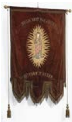
AFB. 4B Vaandel van Het Heilig Hart van Christus (B. Felgenhauer, 2019 © KIK-IRPA – urban.brussels, cliché X137476).