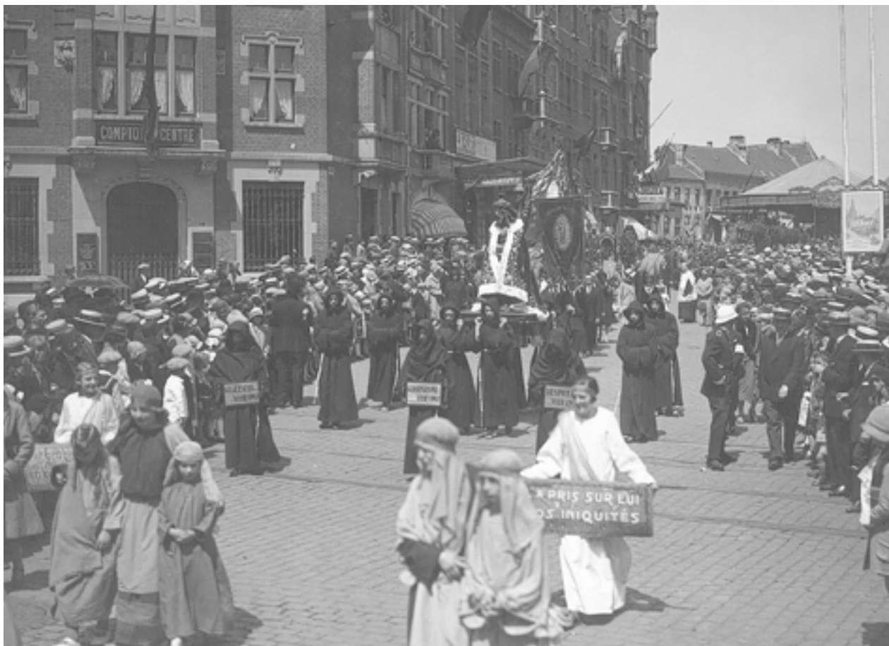
AFB. 3 De Sint-Guidoprocessie in Anderlecht rond 1930. Deze foto toont een deel van de processievoorwerpen van de collegiale Sint-Pieter-en-Sint-Guidokerk in Anderlecht die zijn opgenomen in de inventaris.