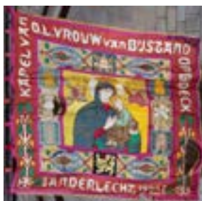
AFB. 4C Vlag van de Kapel van O.L.Vrouw van Bijstand van de Broekwijk.