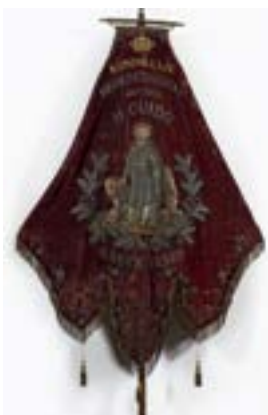
AFB. 4D Vaandel van het Koninklijk Broederschap van den Heilige Guido (B. Felgenhauer, 2019 © KIK-IRPA – urban.brussels, cliché X137472).