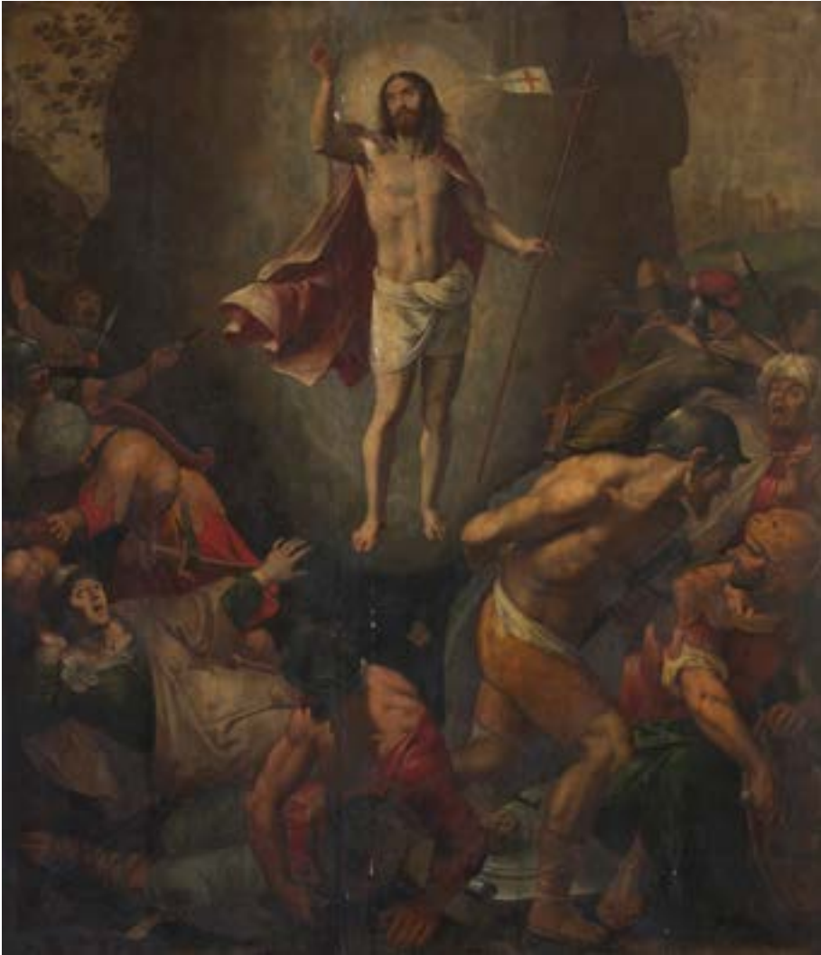
AFB. 5 Ambrosius Francken I, Verrijzenis van Christus , paneel van een voormalig drieluik, circa 1590, olieverf op hout, 155 x 135 cm. Sint-Elisabethkerk, Haren.