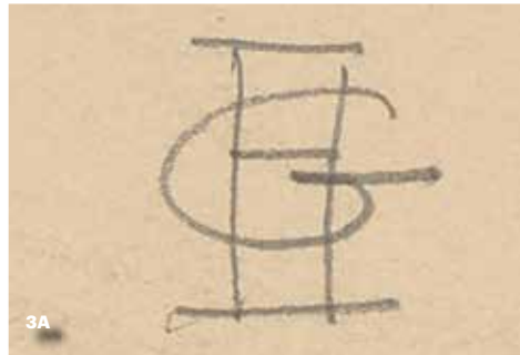
AFB. 3A Monogram waarmee Georges Houtstont zijn tekeningen parafeert.

In 1885 looft Baedeker in de gids Belgique et Hollande: Manuel du voyageur de Nationale Bank van Brussel als een van de mooiste moderne gebouwen van de hoofdstad. ‘Houtstout’ 27 (sic) wordt genoemd als verantwoordelijk voor de decoratieve sculptuur. Het is een uitzonderlijke blijk van erkenning voor het werk van een ornamentist, die vaak, ook voor tijdgenoten, anoniem blijft.