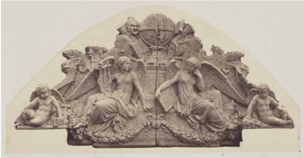
AFB. 1 L'Art et la Science, beeldengroep op het Nouveau Louvre door François Jouffroy, foto Edouard Baldus, 1852-1857