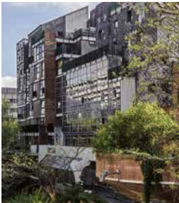
A. de Ville de Goyet © urban.brussels.

project voor de bouw van een «zone sociale» dat de academische overheid wou doordrukken en slaagden erin een ontwerper van hun keuze aan de universiteit op te leggen: het architectenatelier Kroll.