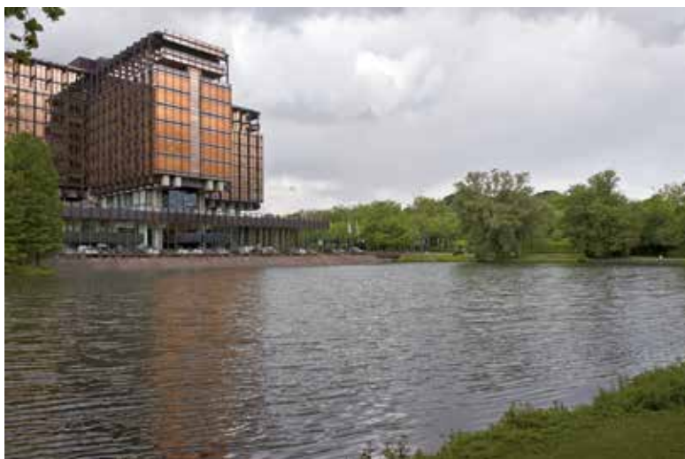
A. de Ville de Goyet © urban.brussels.

die hun zetel in de hoofdstad wilden vestigen, deden hiervoor beroep op de beste architecten. Om aan die grote vraag tegemoet te komen kwam een nieuwe architecturale typologie tot stand.