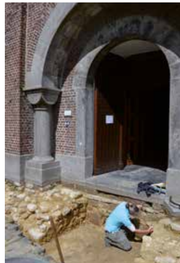
S. Modrie © urban.brussels.

Hoewel de kerk in het laatste kwart van de 19de eeuw grondig verbouwd werd, zijn sommige middeleeuwse delen bewaard gebleven: de toren en de pijlers die de middenbeuk dragen, alsook een deel van de muur van het koor. Het buitenparement en het onderste gedeelte van het zuidoostelijke transept bestaan uit kalksteen afgewisseld met baksteen (15de-16de eeuw).