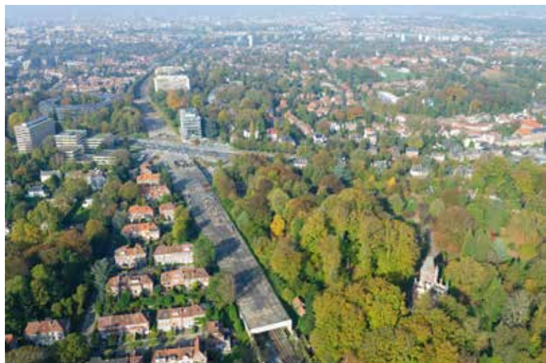
Schmitt-GlobalView © urban.brussels.