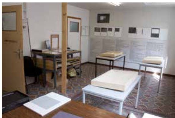
Afb. 8 Zicht op het atelier van kunstenaar Joséphine Kaepelin op de benedenverdieping van het gebouw, 2018. Alle rechten voorbehouden aan de kunstenaar.

In 2013 – het gebouw stond toen nog altijd leeg – werden de ruimten ontdekt door drie kunstenaars en via Entrakt , een bedrijf dat gespecialiseerd is in het tijdelijke beheer van leegstaand vastgoed 6 , kregen ze een