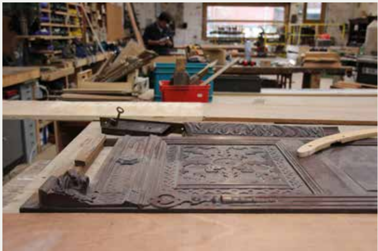
Afb.6 Restauratie in het atelier van de beeldhouwde lambrisering van de salon in neo-Vlaamse renaissancestijl (© Ma², april 2018).

draggers (hout, stuc, steen, papier, faïence...) binnen eenzelfde compositie, vereist de inbreng van evenzoveel vaklui uit verschillende disciplines. Zo gaat in de salon in neo-Vlaamse renaissancestijl op de bel-etage een rijk bewerkte lambrisering (afb.6) samen met een met