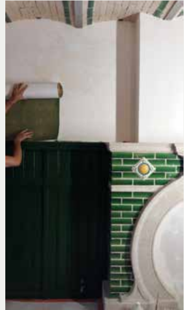
Afb.5 Gerestaureerde schouwmantel, troggewelven en lambrisering, samen met een staal van het gereconstrueerd gewafeld behangpapier (© Ma², oktober 2018).