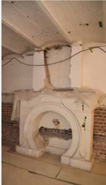
Afb.4 Schouwmantel van de vroegere eetkamer, tuinniveau (foto O. Berckmans, februari 2017).

De veelheid aan stijlen (neo-Vlaamse renaissancestijl, vroeg-20ste eeuwse chinoiserie, art nouveau, art deco, klassiek, neo-empire...) en