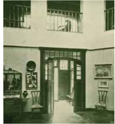
Afb.8a De centrale hal en vestibule in 1898. De borstwering van de eerste verdieping is nog intact. Rechts van deur het doek Veld met klaprozen van V. Van Gogh (1889). Links een katagami en een vitrinekast ontworpen door Van de Velde [uit L'Art décoratif. Revue internationale d'art industriel et de décoration , Parijs, oktober 1898].