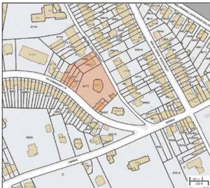
Afb.15 Evolutie van het perceel: de omvang van de eigendom in 1900 aangeduid op het huidige kadasterplan (plan van de auteur).