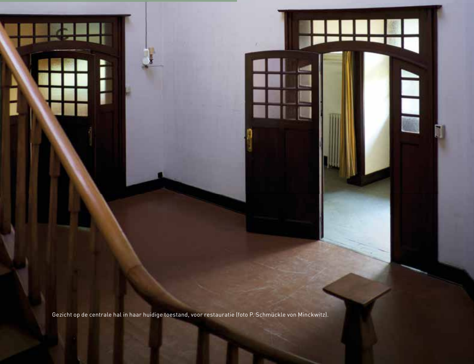
Gezicht op de centrale hal in haar huidige toestand, voor restauratie.

ANNE VAN LOO ARCHITECT EN STEDENBOUWKUNDIGE