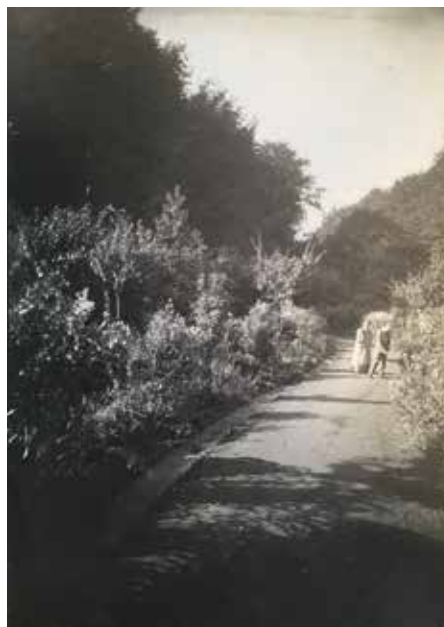
Afb.17 De tuin vanaf het bordes rond 1900. Op het pad Maria, Henry en Nele van de Velde (© AML, FS X 00187/882/004).

pen aan het huis en de tuin gebeurden in de lange periode van 1949 tot 2016. De oorspronkelijke tracés van de tuin werden gewijzigd door verkaveling en de meeste planten werden vernieuwd 25 .