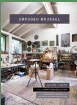
026-027 - April 2018 Kunstenarsateliers