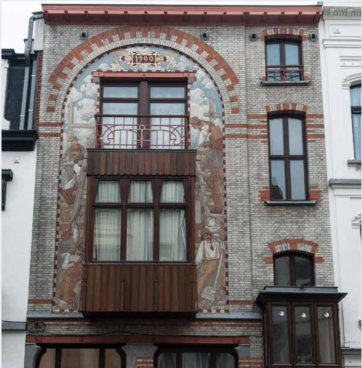
Het gerestaureerde sgraffito van het panda an de Malibransstraat 47 te Elsene.

COÖRDINATOR CEL KLEIN ERFGOED, DIRECTIE MONUMENTEN EN LANDSCHAPPEN