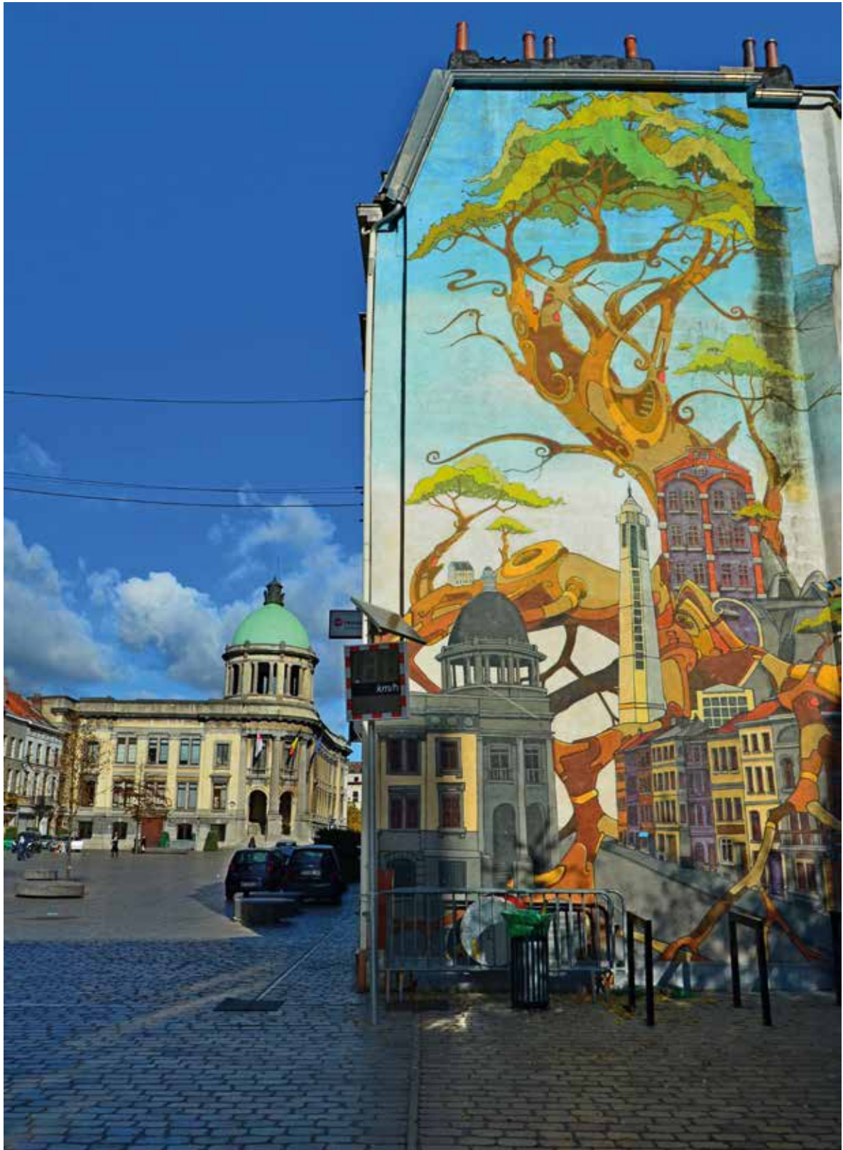
Afb.2 Muurschildering, Gemeenteplein, Sint-Jans-Molenbeek. Wedstrijd 'Fotografeer uw erfgoed'