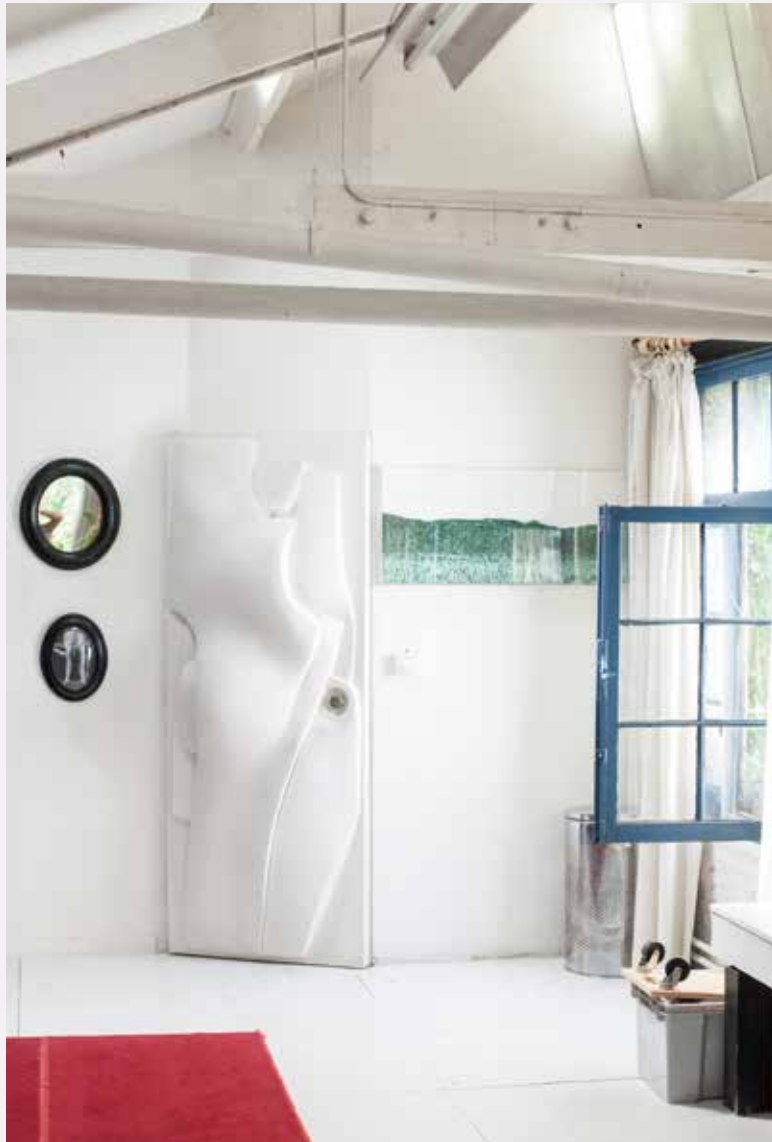
Atelier van Maurice Frydman.

mekaar over. Ik houd bijzonder veel van muziek, dat is een belangrijk deel van mijn leven. Daarom organiseer ik hier geregeld concerten van kamermuziek, die altijd bijzonder op prijs worden gesteld door de bezoekers.