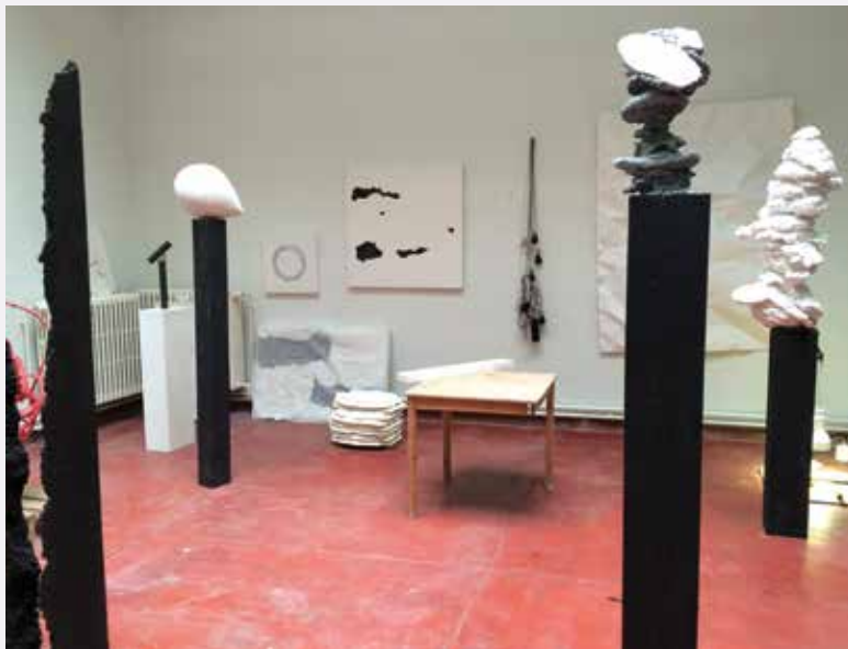
Atelier van Michel François (foto M. François).

overal leegstaande fabriekjes te vinden. Maar ze zijn niet altijd zo toegankelijk, vaak worden er dure lofts van gemaakt en worden jongeren gedwongen een ruimte te delen. In de zogenaamde betere wijken (Ukkel, Elsene) zijn er niet veel ruimten meer te vinden, maar nog wel in gemeenten als Anderlecht en Molenbeek.