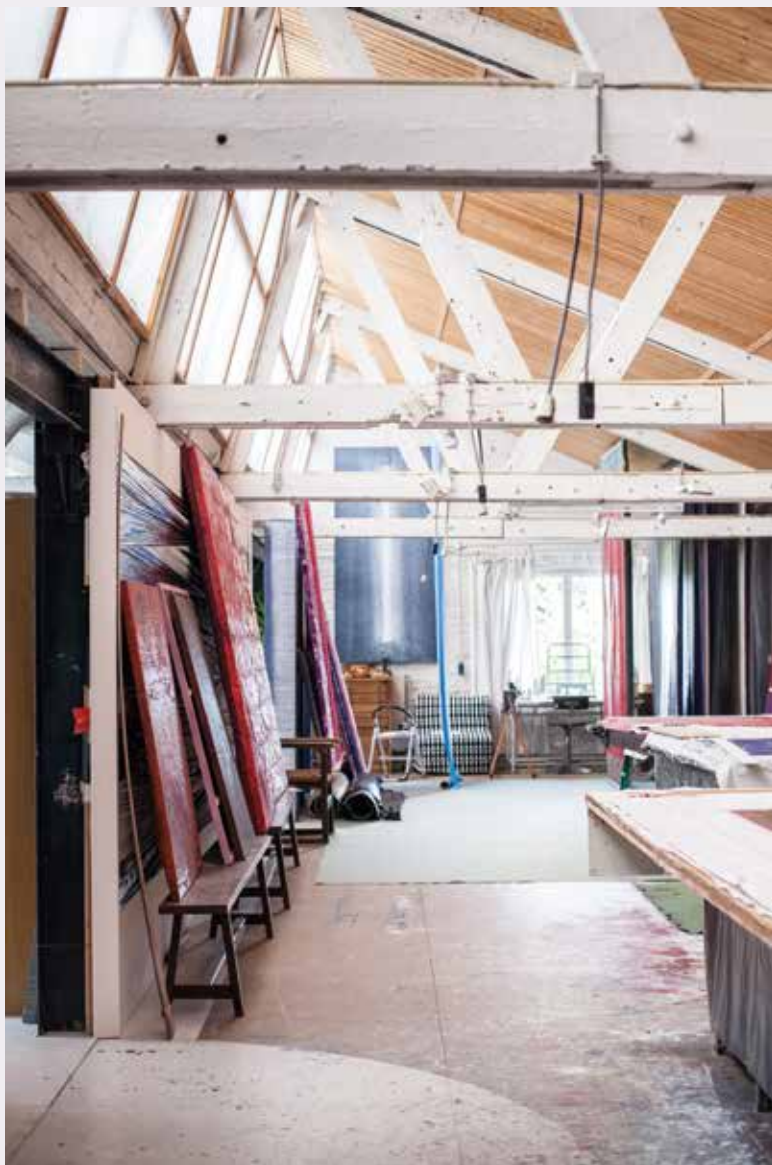
Atelier van Maurice Frydman.

Ik heb lang gezocht naar een geschikt atelier. Een atelier is de bakermat van zoveel dingen. Een