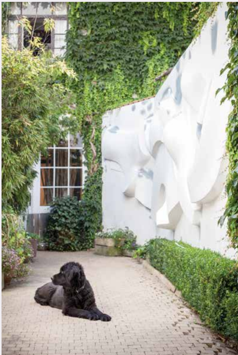
Koetsdoorgang met muursculptuur van Maurice Frydman (foto M. Delfosse).

naar zich van de wereld afzondert om zijn creativiteit uit te leven, blijft fascineren. Een kunstenaarsatelier verradt veel van de persoonlijkheid, maar ook van het werk van de kunstenaar. Het atelier is geen woning. Het is niet op een esthetische of hiërarchische manier ingericht, de functies zijn hier helemaal anders. Het atelier heeft natuurlijk wel een architecturale vorm, maar belangrijker dan het gebouw op zich – hoewel dat in sommige gevallen erg indrukwekkend kan zijn – zijn de getuigenissen van de artistieke activiteit die er plaatsvindt. De combinatie van de kunstwerken – in wording, afgewerkt of in de conceptfase – en het gereedschap en de materialen, vormt een soort harmonieuze chaos. We gaan op bezoek in drie van de meest fascinerende ateliers van Brussel, ergens tussen kunst en architectuur.