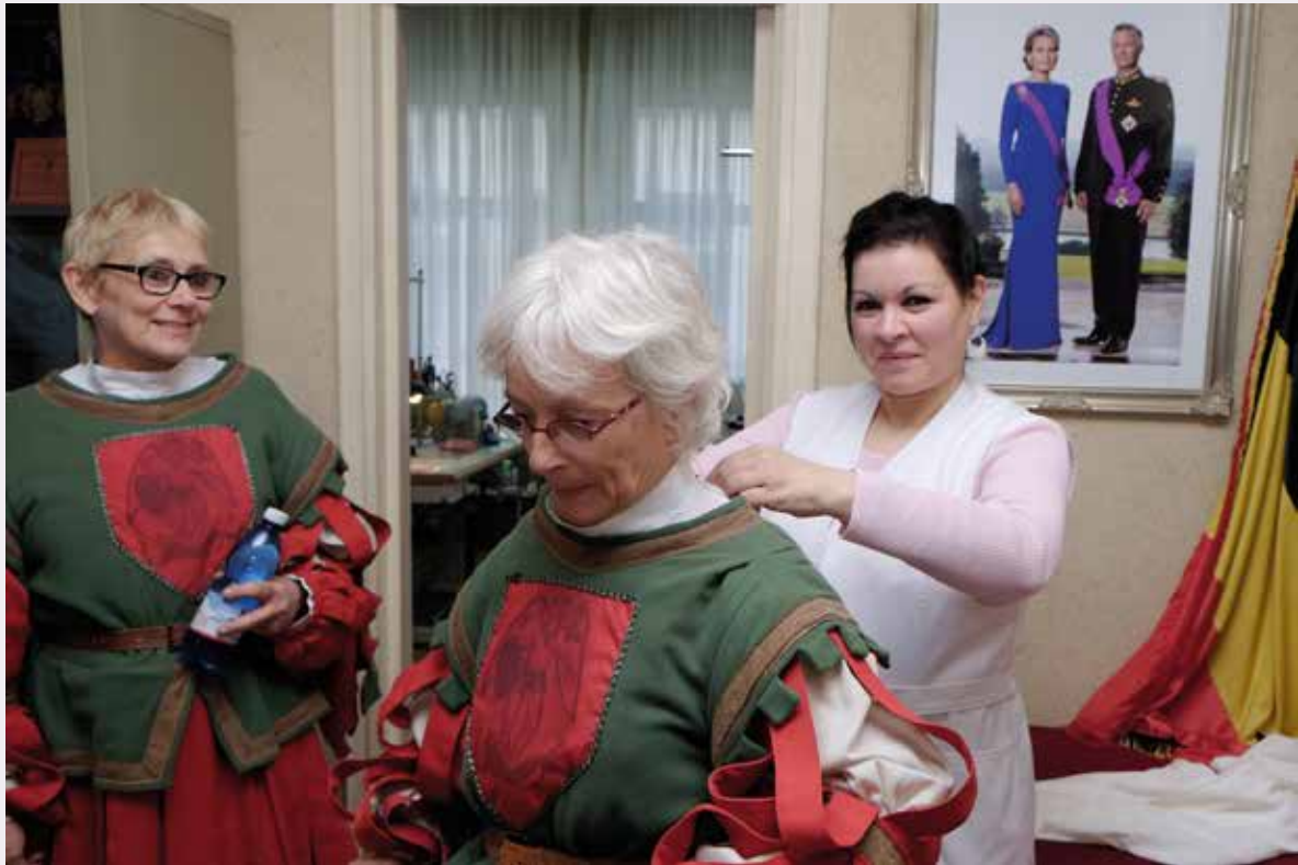
De klermaakster zorgt ervoor dat iedereen mooi wordt aangekleed.

bewaakt. Meerdere factoren dragen daartoe bij: de activiteiten van de vzw Koninklijke Maatschappij van de Ommegang, die sinds 1928 bestaat, de goede contacten met de lokale overheden, het enthousiasme en de toewijding van de groepen, waarvan de meeste als sinds de jaren 1930 deelnemen. De kruisboogschutters, die in de jaren 1928-1930 een belangrijke rol speelden in de heropleving van de Ommegang, blijven van doorslaggevend belang voor het voortbestaan ervan.