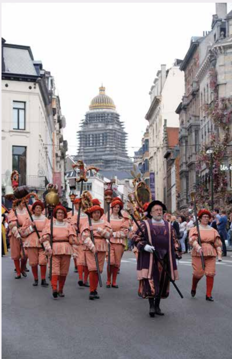
De dragers van de Keersen verlaten de Zavel (Marcel Vanhulst, 2016 © BUP/BSE).

VERANTWOORDELIJKE VAN DE CEL IMMATERIEEL ERFGOED – DIRECTIE MONUMENTEN EN LANDSCHAPPEN