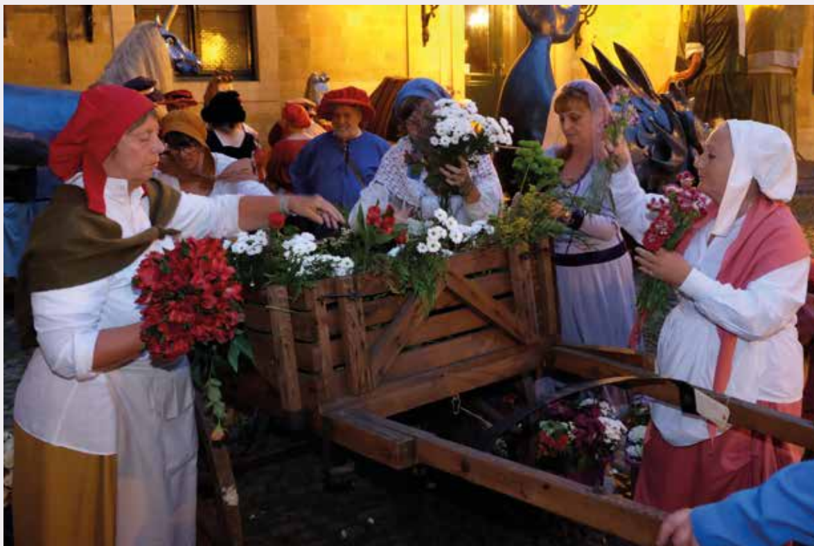
De gewone burgers van Brussel maken de bloemenkarren klaar (Marcel Vanhulst, 2016 © BUP/BSE).

dacht besteed aan details als kant, borduurwerk, fluweel en satijn. De vlaggen, wagens, wapens en verschillende accessoires worden zorgvuldig onderhouden, bewaard en indien nodig gerestaureerd.