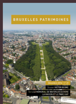
021 - December 2016 Victor Besme