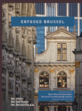
019-020 - September 2016 Stijlen gerecycleerd