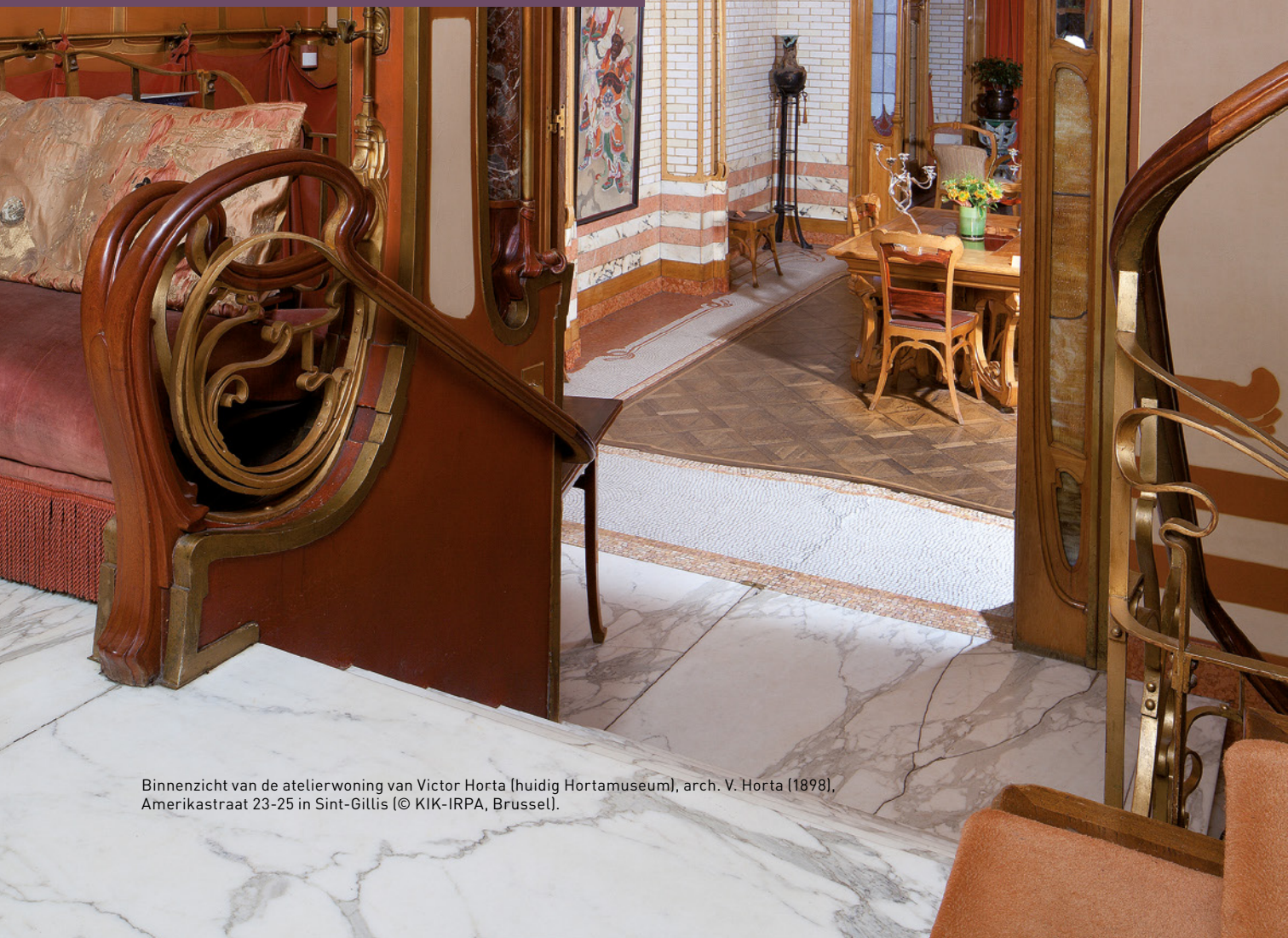
Binnenzicht van de atelierwoning van Victor Horta (huidig Hortamuseum), arch. V. Horta (1898), Amerikastraat 23-25 in Sint-Gillis.

HISTORICA EN KUNSTHISTORICA, DIRECTRICE VAN ARAU, VOORZITSTER VAN EXPLORE.BRUSSELS ASBL