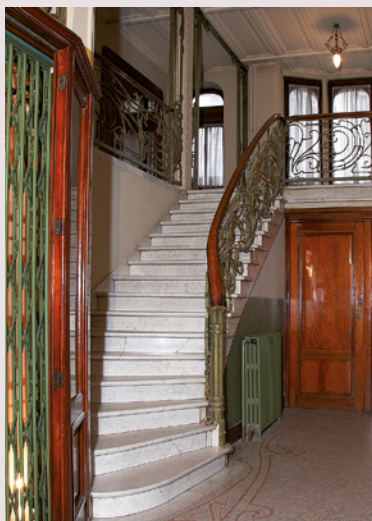
Trap van het Hotel Winssinger.