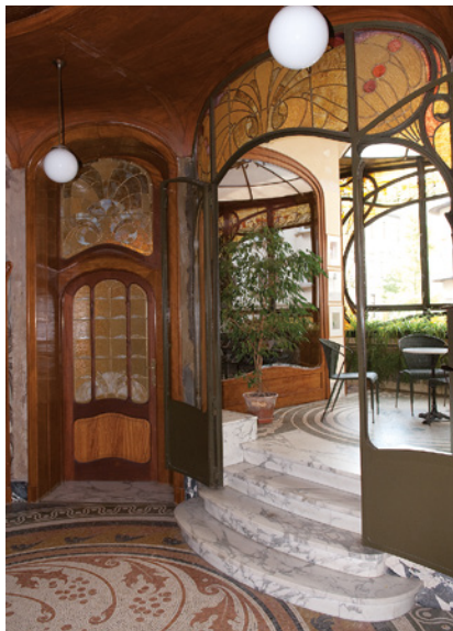
Afb. 1 Binnenzicht van het huis Hannon, arch. J. Brunfaut (1902), Verbindingslaan 1 in Sint-Gillis.