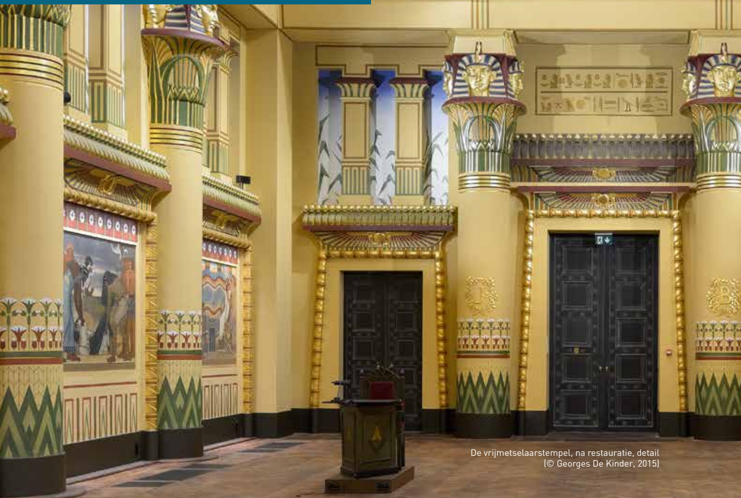
De vrijmetselaarstempel, na restauratie, detail