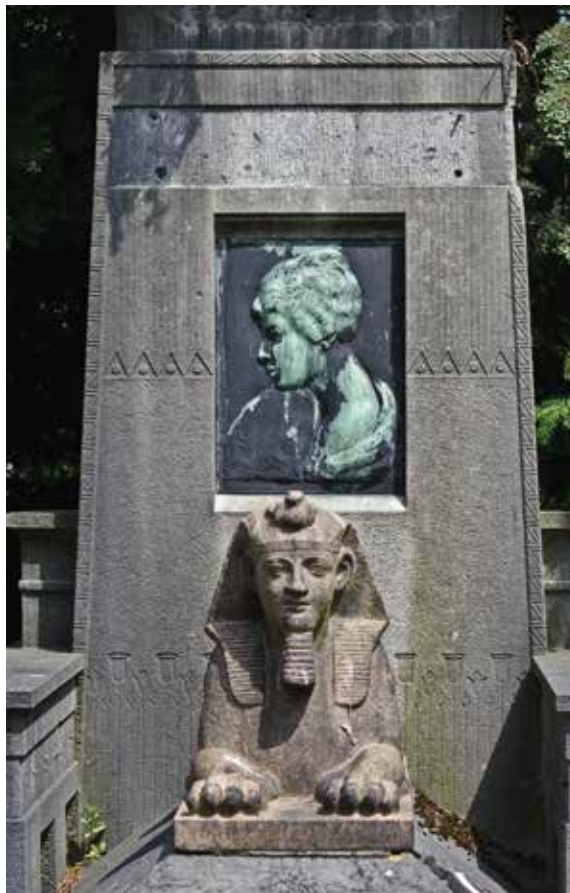
Afb. 6 Het graf van Paulette Verdoot op de begraafplaats van Brussel, gemeente Evere.