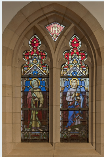
Afb. 6 St-Andrew Church of Scotland, Elsene. Glasramen.

Koning Willem I woonde hier liever de zondagsdienst bij dan in Den Haag. Na hem ging de eerste Koning der Belgen, Leopold I, er te kerke. Voor hem werd een speciale bank gereserveerd. 10