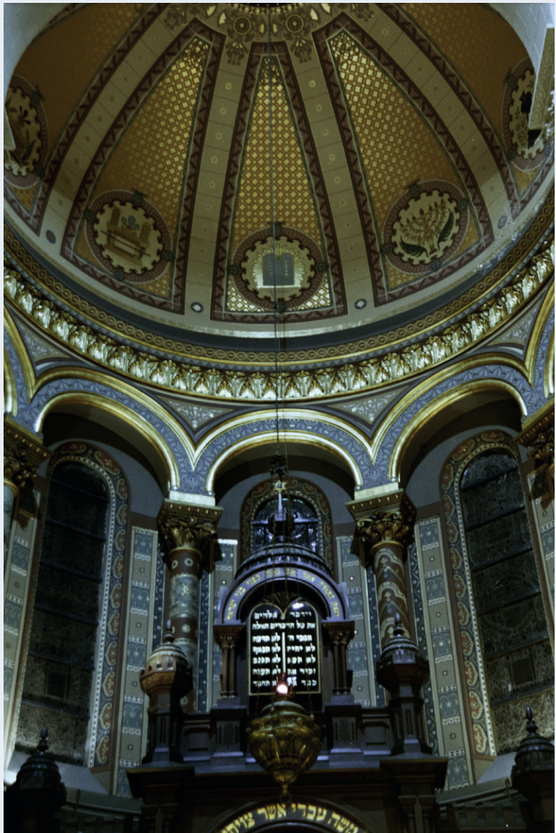
De Grote Synagoge, Brussel (A. de Ville de Goyet, 2005 © GOB).

STAGIAIR GOB, MA-STUDENT ARCHITECTUURGESCHIEDENIS EN MONUMENTENZORG, UNIVERSITEIT UTRECHT