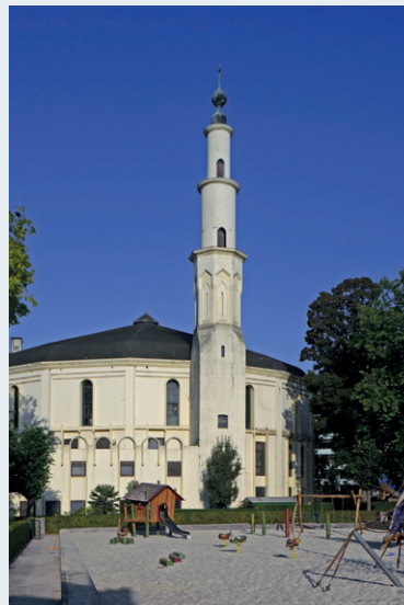
Afb. 11 De Grote Moskee, Brussel (A. de Ville de Goyet, 2014 © GOB).

De rotonde werd herbestemd tot een moskee en cultureel centrum. De Tunesische architect Mongi Boubaker begeleidde deze herbestemming. 23 In de rotonde werden extra vloeren aangebracht. Op het gelijkvloers bevinden zich kantoren en een kleine gebedsruimte, op de eerste verdieping is een studiecentrum en op de bovenste verdieping is een grote gebedsruimte met mezzanine voor de vrouwen. 24 Niet alleen vanuit architectuurhistorisch oogpunt is een unicum als de Grote Moskee van grote waarde. Zij