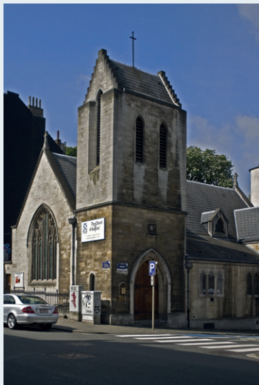
Afb. 4 St-Andrew Church of Scotland, Elsene.