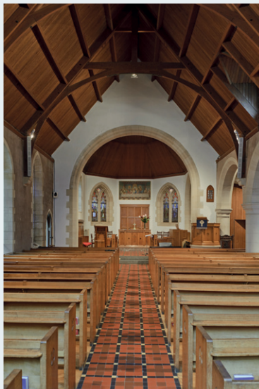
Afb. 5 St-Andrew Church of Scotland, Elsene. Binnenzicht [A. de Ville de Goyet, 2014 © GOB].