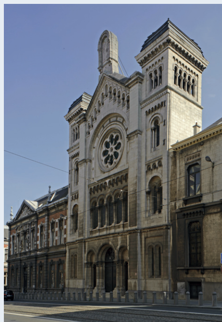
Afb. 1 De Grote Synagoge, Brussel.

Als het aan de bouwcommissie van de synagoge had gelegen was er gewoon glas gekomen voor betere dag-