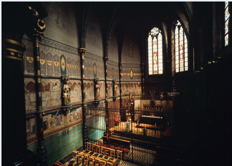
Afb. 12 Voormalige Julianakapel, Sint-Joost-ten-Node.

Het aantal oosters-orthodoxe parochies groeide recenter verder door de komst van migranten uit de voormalige Sovjetstaten. Ook zij nemen vaak hun intrek nemen in voormalige katholieke kerken. Zo is er de neogotische Julianakapel in Sint-Joost-ten-Node (beschermd sinds 1989) sinds december 2009 gewijd tot Roemeens orthodoxe kerk onder de naam Sint Paraskevi (afb. 12).