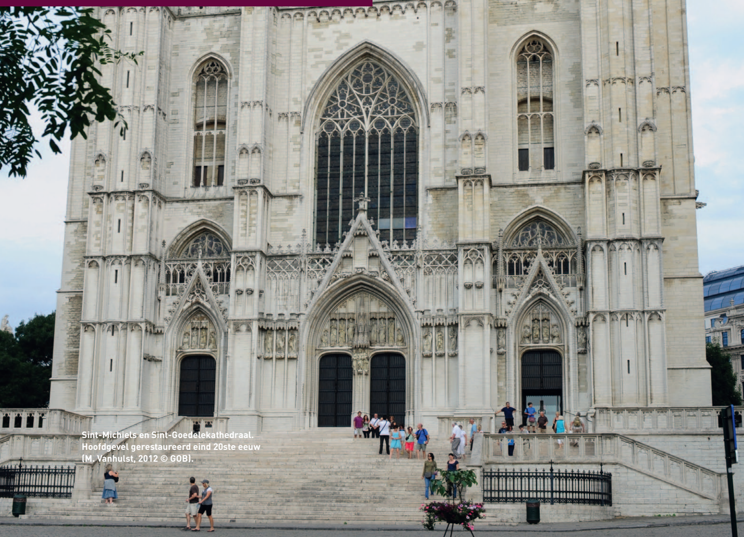
Sint-Michiels en Sint-Goedelekathedraal. Hoofdgevel gerestaureerd eind 20ste eeuw.

HISTORICUS, DIRECTIE MONUMENTEN EN LANDSCHAPPEN