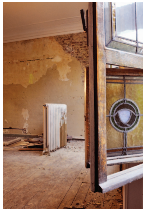
Afb. 1a Zicht vóór de werken.

Om de oorspronkelijke toestand van 1907 te herstellen, werden verdwenen elementen gereconstrueerd van het hekwerk (muur en voortuin), de leien dakbedekking, sommige ramen van de achtergevel, de kalkbe-