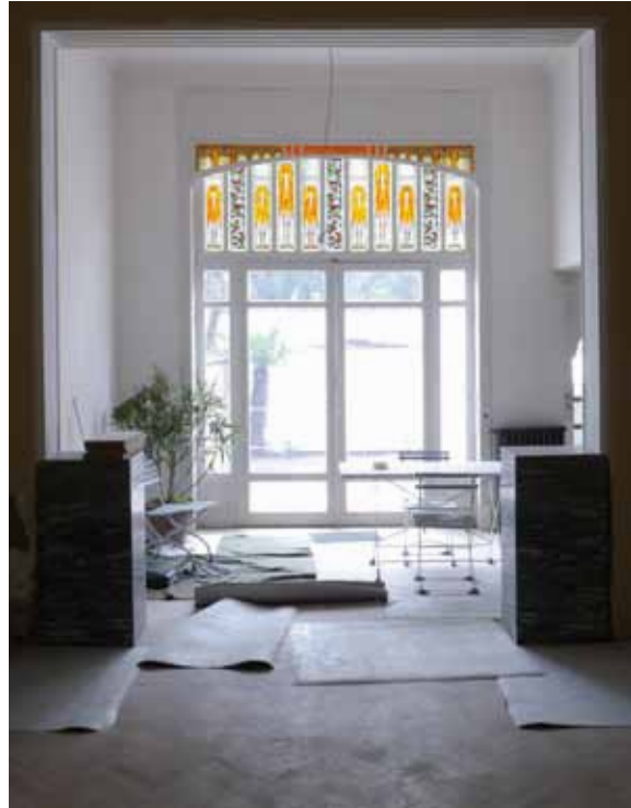
Afb. 5a en 5b

Zicht op de salon voor en na de werken.