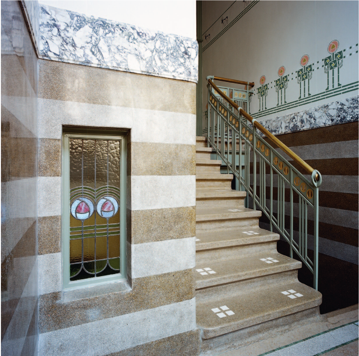
Afb. 5 De inkomhal na restauratie (2014).