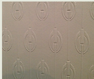
De steenpapier (© Karbon').

schermde, de stenen werden destijds geleverd door groeven die intussen gesloten zijn. Het is een bekende calvarietoesticht voor elk restauratieproject.