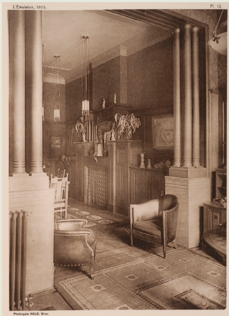
Zicht op het interieur van de eetkamer ( L'Émulation , 1925, pl. 12).