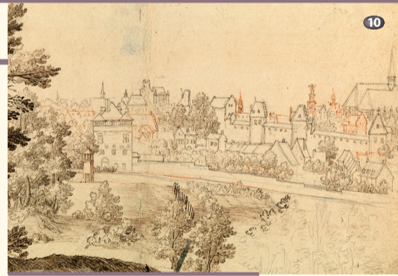
Maison du prévôt et porte du Treurenberg Huis van de provoost en Treurenbergpoort