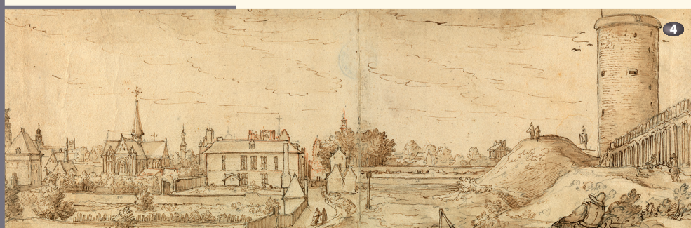
Église Notre-Dame du Sablon, hôtel de Bournonville et Grosse Tour Onze-Lieve-Vrouw-ten-Zavelkerk, hof van Bournonville en Wollendriestoren