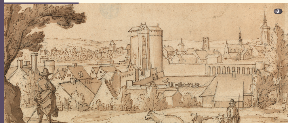
Porte de Hal et Saint-Gilles Hallepoort en Sint-Gillis

G eboren uit de lage Toscaanse adel volgt Remigio Cantagallina les aan de academie van Firenze. Hij begint zijn carrière als schilder en etser, en wordt beïnvloed door Vlaamse kunstenaars die in Italië werken, zoals Paul Bril. Zijn eerste creaties zijn landschapsgravures uit 1603 in een stijl die is beïnvloed door Antonio Tempesta. Tijdens zijn opleiding wijdt G. Parigi – belangrijk figuur uit de Florentijnse School, verbonden aan het Toscaanse hof – hem in in de wereld van scène- en decorontwerp voor het theater. Hij vraagt hem ook de platen te maken voor een album ter herdenking van de in 1608 georganiseerde feesten ter ere van het huwelijk van Cosimo II de Medici met Maria Magdalena van Oostenrijk, achternicht van Keizer Karel V.