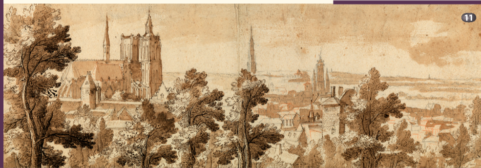
Panorama vers Sainte-Gudule Panorama richting Sint-Goedele