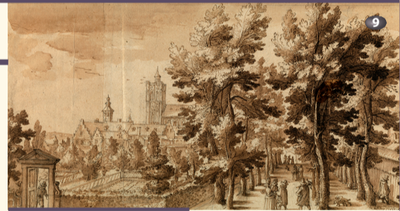
Jardin des arbalétriers Tuin van de kruisboogschutters

A Issu de la petite noblesse toscane, Remigio Cantagallina se forme à l'académie de Florence. Inspiré par les artistes flamands qui travaillent en Italie, comme Paul Bril, il débute sa carrière en tant que peintre et aquafortiste. Ses premières œuvres sont des gravures de paysages datées de 1603. Son style le classe parmi les élèves d'Antonio Tempesta. Pendant ces années d'apprentissage, G. Parigi – figure majeure de l'école florentine, attaché à la cour de Toscane – l'initie à l'univers des scènes et des décors de théâtre ; il lui commande les planches d'un album commémoratif des fêtes organisées en 1608 pour le mariage du futur Côme II de Médicis avec Marie-Madeleine d'Autriche, petite-nièce de Charles Quint.