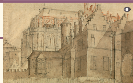
Chapelle du palais du Coudenberg et hôtel d'Hoogstraeten Kapel van het Coudenbergpaleis en hof van Hoogstraten

Hij toont interesse voor de versterkingen van de tweede omwalling (14de eeuw), die hij zowel van binnen als van buiten de stad observeert. Vooral de poorten krijgen zijn aandacht en zo zijn de oudst gekende afbeeldingen van deze monumenten soms van zijn hand. Hij tekent de Hallepoort verschillende keren vanaf Sint-Gillis of de Marollen en geeft ook de Schaarbeeksepoort (afgebroken eind 18de eeuw) en diens uitwendige verdedigingswerken duidelijk weer. Wanneer hij de Oeverpoort afbeeldt, zijn enige tekening van de benedenstad, vereeuwigt hij de schaatsers op het bevroren kanaal. Op de gezichten intra muros zijn vaak courtines, vestingmuren en taluds te zien die getuigen van zijn belangstelling voor de militaire architectuur.