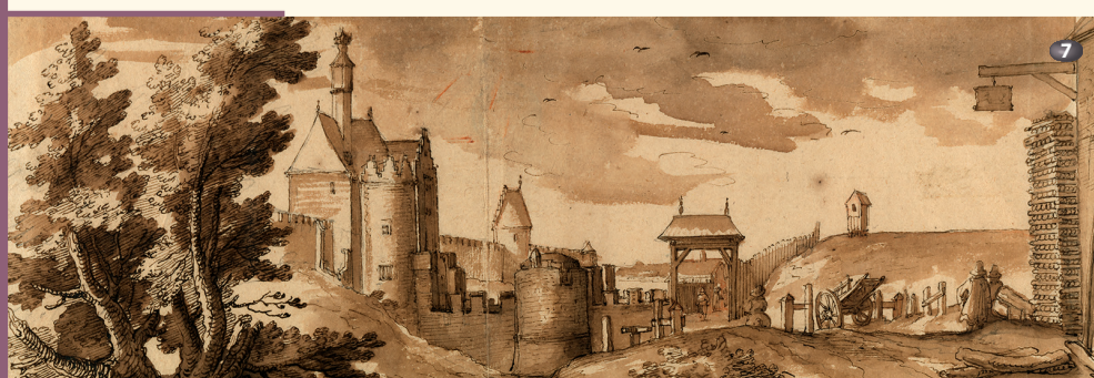
Porte de Namur Naamsepoort

Démolie en 1782, la porte de Namur barrait un tronçon de la chaussée médiévale (rue de Namur) permettant d'accéder au quartier du Coudenberg. Celui-ci était dominé par le palais dont Cantagallina représente la chapelle gothique depuis les jardins de l'hôtel d'Hoogstraeten. C'est également à partir de cette prestigieuse demeure qu'il réalise une vue du jardin des arbalétriers qui disparaîtra lors de la création de la rue Ravenstein (1911-1913). Les vestiges de la chapelle et de l'hôtel d'Hoogstraeten font désormais partie du site archéologique du palais du Coudenberg incendié en 1731 ; les ruines de cet ensemble ont été rasées dans les années 1770 lors de la création de l'actuelle place Royale.