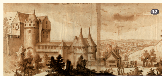
Porte de Schaerbeek Schaerbeeksepoort