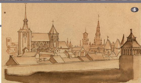
Panorama depuis le jardin de Bournonville Panorama vanuit de tuin van Bournonville

À l'angle de la place Poelaert et de la rue aux Laines (n° 23), l'actuel hôtel de Merode conserve dans ses façades et ses intérieurs des vestiges de l'hôtel de Bournonville où loge Cantagallina pendant son séjour à Bruxelles. En 1608, après avoir appartenu aux Mansfeld, la demeure passe à Alexandre de Bournonville qui, dix ans plus tard, la fait reconstruire. Maintes fois remanié, l'hôtel est aujourd'hui occupé par le Cercle de Lorraine. La propriété comptait aussi un belvédère (disparu, place Poelaert) et des jardins s'étendant jusqu'à la rue des Minimes. Depuis ceux-ci, l'artiste dessine l'église Notre-Dame du Sablon. Il représente également la Grosse Tour (rue du Grand-Cerf), une haute tour de guet médiévale démolie en 1807.