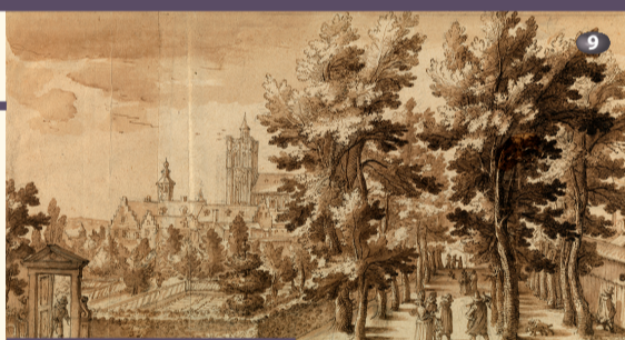
Giardino dei balestrieri Garden of the crossbowmen

A Originario della piccola nobiltà toscana, Remigio Cantagallina si formò all'accademia di Firenze. Ispiratosi agli artisti fiamminghi che esercitavano in Italia, come Paul Bril, iniziò la sua carriera come pittore e acquafortista. Le sue prime opere sono incisioni paesaggistiche realizzate nel 1603. Per lo stile può essere annoverato tra gli allievi di Antonio Tempesta. Durante gli anni di apprendistato, G. Parigi – personaggio chiave della scuola fiorentina, legato alla corte di Toscana – lo introdusse all'universo delle scene e decorazioni di teatro; fu lui a ordinarli le tavole di un album commemorativo delle feste organizzate nel 1608 per le nozze del futuro Cosimo II de' Medici con Maria Maddalena d'Austria, pronipote di Carlo Quinto.