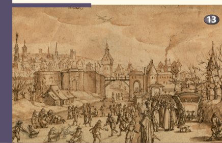
Porte du Rivage Rivage Gate

H e takes an interest in the fortifications of the second city walls (14th century), which he observes from both inside and outside the city. He focuses in particular on the gates, in certain cases leaving behind the oldest depictions of these monuments. He produces a number of sketches of Halle Gate from Saint-Gilles or the Marolles neighbourhood and also depicts Schaerbeek Gate (demolished end 18th century) with a fine rendering of its exterior defensive structure. His only drawing of the lower town, that of the Rivage Gate, immortalises an ice skating scene on the frozen canal. His views from within the city walls are often marked by curtain walls, battlements and ramparts and reflect a real fascination for military architecture.