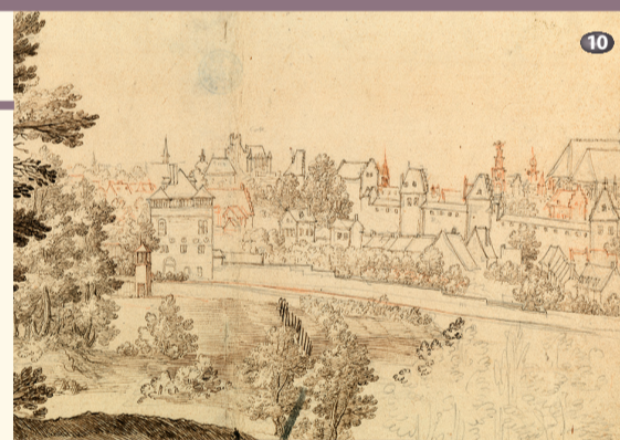
Casa del prevosto e porte du Treurenberg House of the provost and Treurenberg Gate

N el 1612-1613, Cantagallina intraprese un viaggio attraverso i Paesi Bassi meridionali, probabilmente su richiesta del duca Alexandre de Bournonville, che lo ricevette a Bruxelles nella sua dimora della rue aux Laines. L'artista seguì il suo mecenate negli spostamenti tra le sue diverse proprietà, di cui realizzò dei disegni - in particolare il castello di Tamise sulla Schelda e il villaggio di Hénin-Liéart nell'Artois. Passò inoltre per Spa, Liegi, Chaudfontaine, Maastricht, Saint-Trond, Tournai... Nel corso del viaggio, incontrò Jan Brueghel detto « di Velluto » e sviluppò la sua tecnica del disegno « dal vero ». Di ritorno in Toscana, assunto come maestro di disegno alla corte dei Medici, si fece notare per le sue ampie vedute di città.