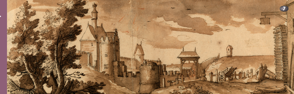
Porte de Namur Namur Gate

D emolished in 1782, the Namur Gate blocked a section of the medieval roadway (Rue de Namur) giving access to the Coudenberg quarter. This neighbourhood was dominated by the palace, whose gothic chapel Cantagallina depicts from the gardens of the Hôtel d'Hoogstraeten. From this prestigious setting he also draws a view of the garden of the crossbowmen, which disappeared when Rue Ravenstein was created (1911-1913). The remains of the chapel and the Hoogstraeten townhouse are now part of the archaeological site of the Coudenberg Palace, which burnt to the ground in 1731. Its ruins were demolished in the 1770s to allow for the construction of the current Place Royale.