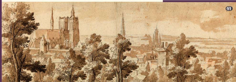
Panorama verso Sainte-Gudule Panorama towards Saint Gudula

T o create a panorama of Brussels from the south, he seeks out various locations around the village of Obbrussel (Saint-Gilles), particularly around what are, today, Rue du Fort and Rue de la Victoire. The horizon is characterized by landmarks: gates of the city walls, church towers, belfries, aristocratic townhouses, etc. From the area surrounding Schaerbeek Gate (Rue Royale - Boulevard du Jardin Botanique), he creates two panoramas of the city centre. The Collegiate Church of Saint Michael and Saint Gudula (a cathedral since 1961), the home of Jean Grouwels, the provost of the Duke of Alba (no longer standing, Rue du Gouvernement Provisoire) and a section of the first city walls (Treurenberg) are prominent in these compositions.