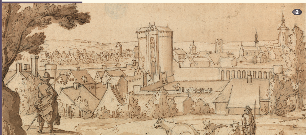
Porte de Hal e Saint-Gilles Halle Gate and Saint-Gilles

D escended from the minor Tuscan nobility, Remigio Cantagallina is educated at the Florence Academy. Inspired by Flemish artists working in Italy, such as Paul Bril, he starts his career as a painter and etcher. His first works are landscape etchings dating from 1603. His style ranks him among the pupils of Antonio Tempesta. During his years of apprenticeship, G. Parigi - a major figure in the Florentine School attached to the Tuscan court - introduces him to the world of stage design and scenery; he commissions him to produce the plates for an album commemorating the celebrations organised in 1608 for the wedding of the future Cosimo II de Medici and Maria Maddalena of Austria, great-niece of Charles V.