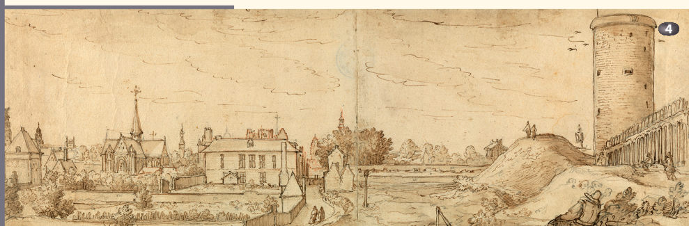
Chiesa Notre-Dame du Sablon, hôtel de Bournonville e Grosse Tour Church of Our Blessed Lady of the Sablon, Hôtel de Bournonville and Grosse Tour

O n the corner of Place Poelaert and Rue aux Laines (no. 23), the current Hôtel de Merode retains vestiges in its façades and interiors of the Hôtel de Bournonville, where Cantagallina lodged during his stay in Brussels. In 1608 the residence passed from the Mansfelds to Alexandre de Bournonville who had it rebuilt ten years later. Renovated on numerous occasions, the building is used today by the Cercle de Lorraine business club. The property also featured a belvedere (no longer standing, Place Poelaert) and gardens extending to the Rue des Minimes. From there the artist draws the Church of Our Blessed Lady of the Sablon. He also depicts the Grosse Tour (Rue du Grand-Cerf), a tall medieval watchtower that was demolished in 1807.