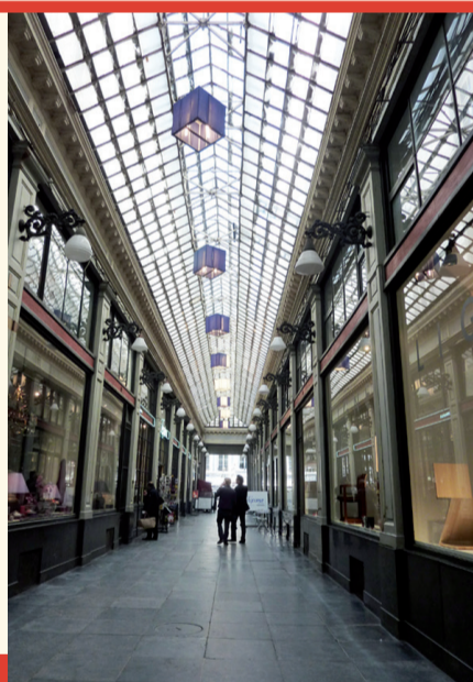
Galerie des Princes Prinsengalerij

E Inauguré en 1847, ce passage couvert monumental (arch. J.-P. Cluysenaar) relie les abords immédiats de la Grand-Place à la rue de l'Écuyer. Le complexe comprend la galerie de la Reine, la galerie du Roi et la galerie des Princes, toutes trois couvertes d'une structure métallique vitrée. Elles associent commerces et équipements socioculturels au rez-de-chaussée et logements aux étages. On y trouve notamment le Théâtre royal des Galeries, le Théâtre du Vaudeville et le Cinéma des Galeries. Une imposante façade néo-Renaissance italienne commande les deux entrées principales rue du Marché-aux-Herbes et rue de l'Écuyer. Plus petite et de conception plus simple, la galerie des Princes s'ouvre vers la rue des Dominicains.