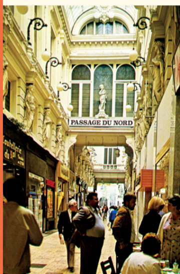
Passage du Nord dans les années '70 Noordoorgang in de jaren '70

Rue Ravenstein ↔ Cantersteen Ravensteinstraat ↔ Kantersteen