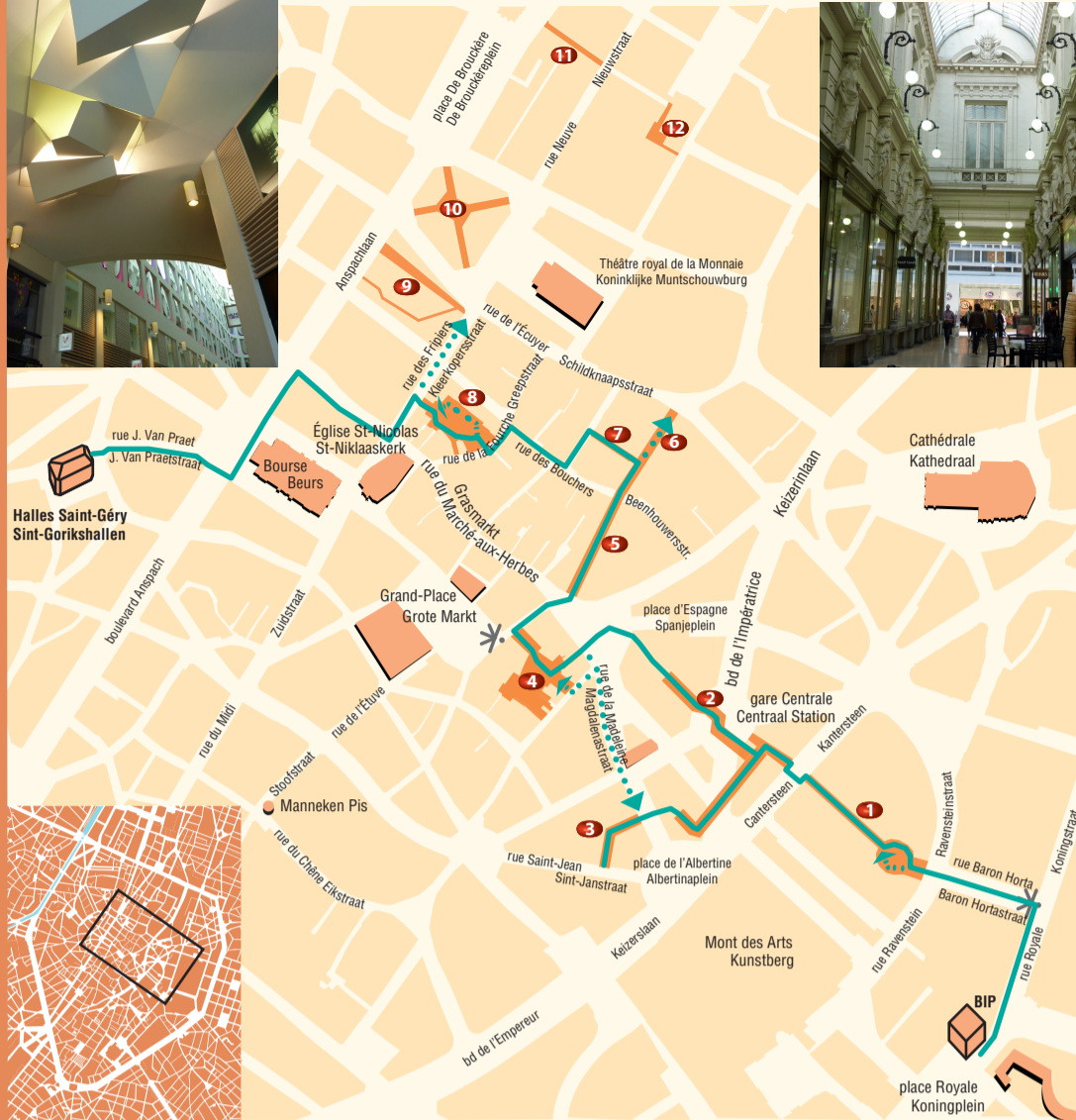
Légende - Legende

In het BIP – Brussel Info Plein – en in de Sint-Gorikshallen kan u zowel praktische informatie als toeristische documentatie vinden om het Brussels Hoofdstedelijk Gewest te ontdekken en te bezoeken. Om beide gewestelijke polen met elkaar te verbinden, werd een wandeling uitgestippeld doorheen de vele wandel- en winkelgalerijen die Brussel rijk is. Een originele manier om door Brussel te kuieren!