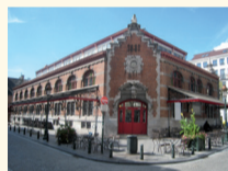
Halles Saint-Géry place Saint-Géry Entrée libre tous les jours et 10 h à 18 h www.sintgorikshallen.be

Bruxelles chemins de ronde Brussel de weergangen