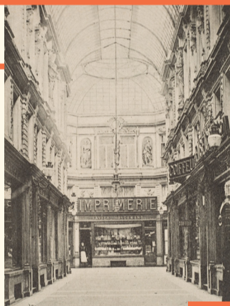
Galerie du Commerce vers 1880 Handelsgalerij rond 1880

Au XIX e siècle , galeries et passages couverts se multiplient dans les grandes villes européennes, notamment à Paris et à Londres. Bruxelles n'est pas en reste puisque de 1820 à 1880, sept ensembles voient le jour : les galeries royales Saint-Hubert, Bortier, du Commerce et du Parlement, les passages du Nord, de la Monnaie et des Postes. Ces « rues couvertes » conjuguent de multiples fonctions : liaison, commerces, logements et équipements socioculturels. Leur construction est souvent l'occasion de revitaliser un quartier par un geste urbanistique fort. À partir des années 1950, on assiste à la création de nouvelles galeries (Ravenstein, du Centre...) et à la rénovation des anciens ensembles.