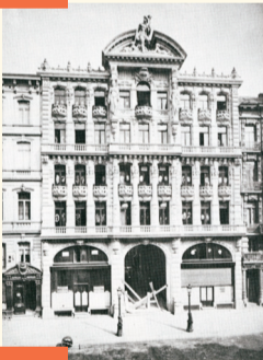
Passage des Postes vers 1900 (démoli) Postgalerij rond 1900 (afgebroken)