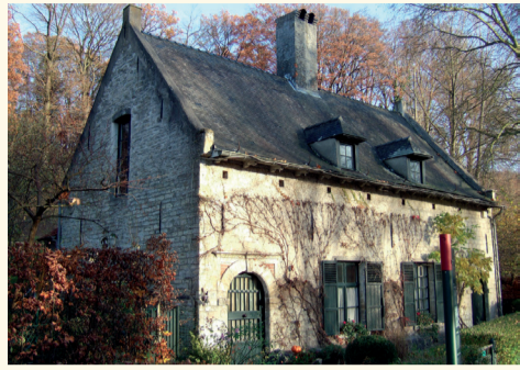
Maison du meunier Molenaarswoning

Dans son enceinte, la communauté disposait d'infrastructures lui permettant une grande autonomie de gestion. Établies dans le courant du XV e siècle, la brasserie, alimentée en eau par le ruisseau souterrain traversant le prieuré, et l'infirmerie, entourée d'un jardin de plantes médicinales, furent détruites à la fin du XVIII e siècle. Ces deux bâtiments sont évoqués par des volumes végétaux et des murets en pierres sèches. Le moulin à eau établi en contrebas de la digue de l'étang supérieur a été démoli en 1887. Vers 1740, le lavoir fut converti en logement pour le meunier. Cette maison servit ensuite de forge, d'auberge et finalement d'habitation au peintre A. Bastien (1873-1955) puis à l'historienne A. Maes jusqu'à la fin du XX e siècle.