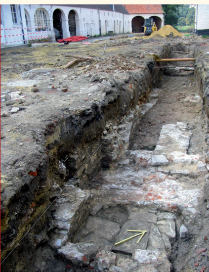
Fouille au quartier agricole Opgraving van het landbouwkwartier