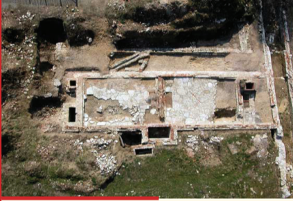
Fouille de l'infirmerie Opgraving van de infirmerie