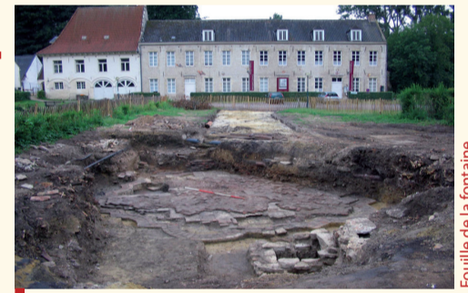
Fouille de la fontaine Opgraving van de fontein

C ette belle esplanade d'accueil était ornée de deux fontaines baroques dont l'une a été reconstruite sur base des vestiges archéologiques découverts en 2006. De la maison destinée au logement des frères laïcs, datant du XVII e siècle, ne subsistent que les quatre travées sur arcades du côté est. Le reste du bâtiment a été transformé et est occupé par le Centre d'Art de Rouge-Cloître depuis 1977. Le côté est de la cour était, à l'origine, fermé par la maison des hôtes qui accueillait les visites des souverains : Charles Quint, Philippe II et Maximilien d'Autriche. Reconstitué au milieu du XVII e siècle, ce bâtiment fut abattu en 1798 ; il est aujourd'hui marqué par une double rangée d'arbres plantée dans un terre-plein surélevé.