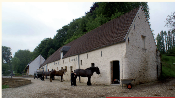
La ferme aujourd'hui De boerderij vandaag