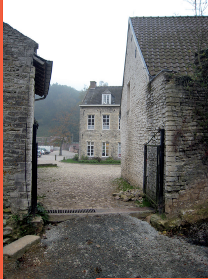
La porte du quartier agricole De poort van het landbouwkwartier

De priorij werd volledig omgeven door een hoge omheiningmuur die opgetrokken werd in de tweede helft van de 15de eeuw. De omheining is opgetrokken uit witte zandsteen en baksteen en ze is versterkt met steunberen. Over haar totale lengte van om en bij de 700 meter hebben zich steeds vier poorten bevonden: de hoofdtoegang of Voorpoort, de poort van het landbouwkwartier of de Peerdpoort die toegang bood tot de weiden en de velden, de Kalkpoort waarvan de naam verwijst naar de nabij gelegen kalkoven en de molenpoort nabij de bovenste vijver. De muur, die deels vernield werd vanaf het einde van de 18de eeuw, werd verscheidene malen gerestaureerd vanaf het begin van de 20de eeuw. De laatste campagne wordt afgerond.