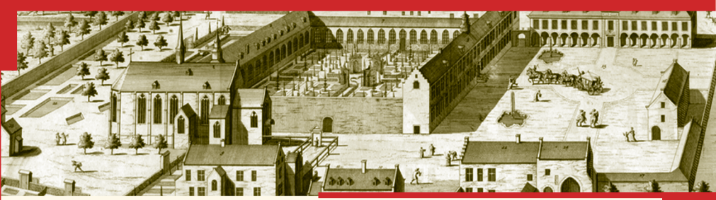
Le prieuré de Rouge-Cloître vers 1725 De priorij van het Rood Klooster rond 1725