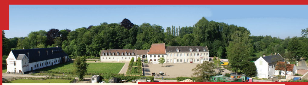
Le prieuré aujourd'hui De priorij vandaag