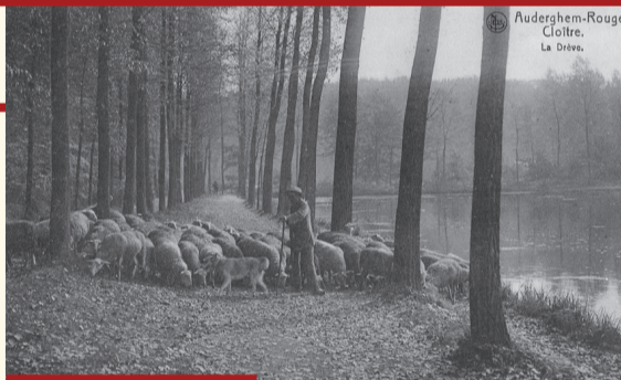
Berger au Rouge-Cloître début XX e siècle Herder in het Rood Klooster begin 20de eeuw

D'abord exploitée par des frères convers puis par des métayers, la ferme permettait à la communauté monastique de produire son alimentation quotidienne. Le premier quartier agricole était situé en dehors de l'enceinte, près de la porterie. Après les Guerres de Religion de la fin du XVI e siècle, un nouvel ensemble fut construit à l'intérieur de l'enclos. Les bâtiments actuels – grange, remises, écuries et chartils – encadrent une cour au centre de laquelle est évoquée l'ancienne fosse à fumier. Érigés en plusieurs étapes entre 1720 et 1785, ils ont conservé leur vocation agricole jusque dans la seconde moitié du XX e siècle et sont désormais occupés par l'asbl Cheval et Forêt, des ateliers d'artistes et la Maison du Conte.