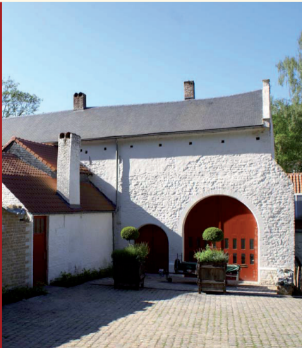
La porterie Het poortgebouw