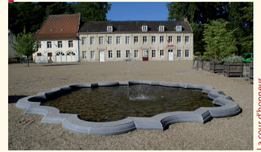
La cour d'honneur Het voorplein