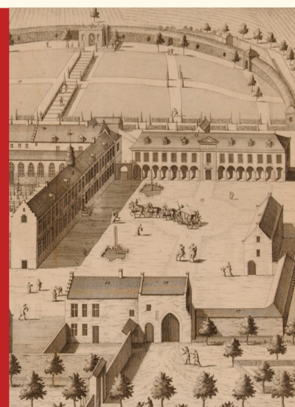
Cour d'honneur - voorplein - 1725

D eze mooie onthaalruimte was verfraaid met twee barokke fontein, waarvan er een gereconstrueerd werd op basis van archeologische restanten die in 2006 ontdekt werden. Van het 18de-eeuwse lekenverblijf blijven enkel de vier oostelijke bogen van de galerij over. De rest van het gebouw kende grondige aanpassingswerken en in 1977 vestigde er zich het Centre d'Art de Rouge-Cloître . Aan de oostzijde van het voorplein bevond zich oorspronkelijk het gastenverblijf waarin vooraanstaande personen, zoals Karel V, Filips II en Maximiliaan van Oostenrijk, konden verblijven. Nadat dit gebouw in de loop van de 17de eeuw werd heropgebouwd, werd het in 1798 afgebroken. Vandaag is het volume van het gebouw zichtbaar gemaakt door een iets hoger gelegen dubbele bomenrij.