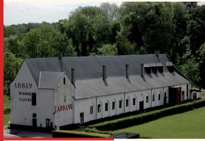
Maison du prieur Priorwoning

Van de kloostergebouwen, de kerk en de pandgang, bleven enkele elementen bewaard. De priorijkerk, opgetrokken vanaf 1381, werd omstreeks 1512 vergroot. Dit gotisch gebouw werd echter in het begin van de 19de eeuw afgebroken. Een witte betegeling geeft vandaag haar contouren aan. Het klooster, opgetrokken vanaf het begin van de 15de eeuw, werd vergroot omstreeks 1675. De oudste vleugel bleef gespaard van de sloopwerken na 1796. Deze bestond ondermeer uit de kapittelzaal, de slaapzaal van de kanunniken en de vertrekken van de prior. Het gebouw zal binnenkort gerestaureerd worden. De sterk verbouwde overblijfselen van een tweede kloostervleugel en een evocatie van de ontbrekende delen door beplantingen en stenen, omsluiten de ruimte van de oude centrale tuin.