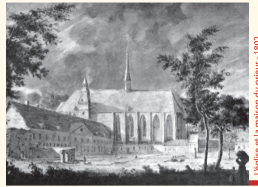
L'église et la maison du prieur - 1802 De kerk en de priorwoning - 1802

Des bâtiments conventuels, l'église et le cloître, subsistent quelques éléments. Érigée à partir de 1381, l'église priorurale fut agrandie vers 1512. Cet édifice gothique fut rasé au début du XIX e siècle ; son plan est évoqué par un dallage de pierre blanche. Construit à partir du début du XV e siècle, le cloître fut agrandi vers 1675. L'aile la plus ancienne a été épargnée par les démolitions intervenues après 1796. Elle abritait la salle du chapitre, le dortoir des chanoines et les appartements du prieur ; le bâtiment sera prochainement restauré. Les vestiges très remaniés d'une deuxième aile du cloître et une évocation des parties manquantes par des volumes végétaux et minéraux encadrent l'espace de l'ancien jardin central.