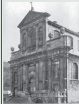
Vue de la façade principale (1914-1918)