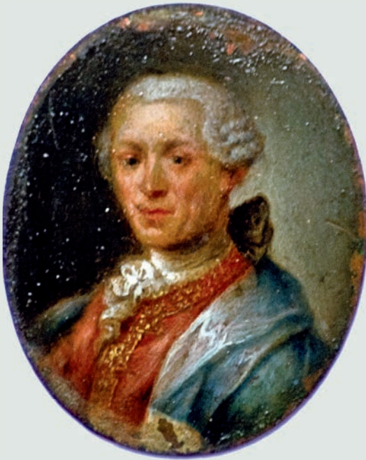
Laurent-Benoît Dewez, collection privée