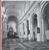
Vue vers le chœur (1902)