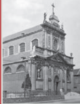
Vue de la façade principale (1942)