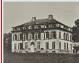
Vue de la façade principale