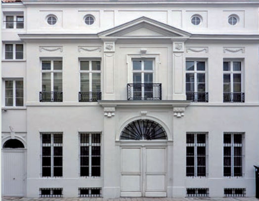
Vue de la façade principale (2012 © Musée belge de la franc-maçonnerie)