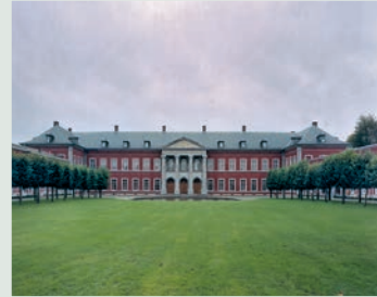
Actuelle faculté universitaire des Sciences agronomiques (1998 © KIK-IRPA, Bruxelles)