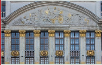
Vue du fronton de la maison des Ducs de Brabant 13-19, Grand-Place à Bruxelles dont l'embellissement a été commandé par la Ville de Bruxelles à L.-B. Dewez. La sculpture est due à Adrien Anrion (2012 © KIK-IRPA, Bruxelles)