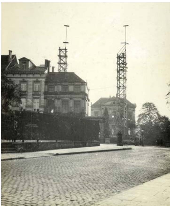
FIG. 2 Rue de la Loi. Installation d'un gabarit de façade grandeur nature. ca. 1922.

de l'université de Louvain, actif aux barreaux de Namur et Anvers, se lance dans la finance et l'immobilier en 1906 en fondant la S.A. Crédit Général Hypothécaire et Mobilier. Centrée sur l'épargne des classes moyennes, son succès et l'ambition de son créateur le place, à l'aube de la première guerre mondiale, à la tête d'un empire financier suffisamment diversifié pour traverser le conflit international tout en continuant à se développer.