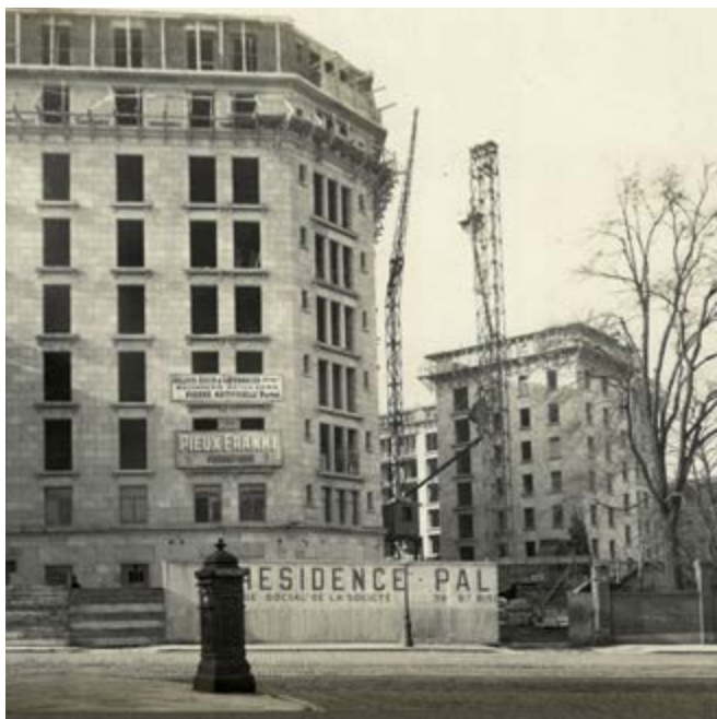
FIG. 4 Chantier en cours vu depuis la rue de la Loi. 4 avril 1925.

Kaisin consacre également une somme conséquente 4 à la constitution d'une importante documentation par le financement de voyages d'études, par exemple l'envoi à New-York d'une délégation d'architectes et ingénieurs pour documenter les techniques modernes mises en œuvre dans les constructions les plus récentes 5 .