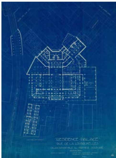
FIG. 3 Plan du premier sous-sol. Blueprint à l'échelle 1/200ème avec cachet original. Michel Polak. 29 février 1924.