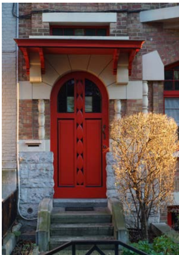
FIG. 2 Dans une architecture bien pensée, le dispositif d'entrée est constitué d'une série d'éléments soigneusement agencés : Perron, auvent, profil de la baie, menuiserie, ... Détail de la porte d'entrée.

16. Les plans d'une maison commandée par Verheyeweghen en 1958 sont signés par l'architecte Joseph Tilman, n°28 chaussée d'Itterbeek à Anderlecht. La silhouette d'un personnage au pied de l'élévation de façade, identique à celle de ses plans antérieurs permettent de lui attribuer les plans de la maison de l'avenue Bizet. Archives de la commune d'Anderlecht, fonds Travaux Publics, dossier Travaux publics 39496. Voir note n°49.