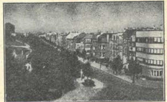
AVENUE DU ROI SOLDAT

TALRIJKE GRONDEN VAN ALLEN AARD VOORDEELIGE PRIJZEN