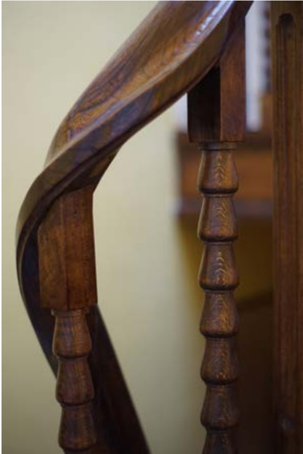
FIG. 3 Pour qui sait regarder, même une maison banale possède des charmes. Détail du garde-corps de la cage d'escalier.

Selon toute probabilité, les travaux sont réalisés par l'entreprise familiale : un choix pragmatique et avisé 17 .