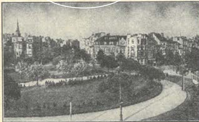
MEIR ROND POINT

VENTE PUBLIQUE LE PREMIER VENDREDI DE CHAQUE MOIS