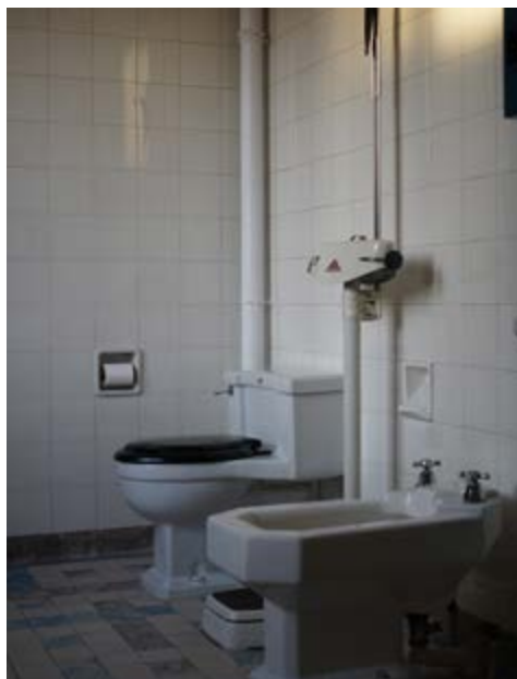
FIG. 6 Dans l'entre-deux guerres, l'hygiène corporelle devient un confort de vie. Détail de la salle de bain.

43. Carreaux à bords arrondis, plinthes à gorge, accessoires intégrés : Manufactures céramiques d'Hemiksem et de la Dyle . BAECK, M. et VERBRUGGE B., De Belgische Art Nouveau en Art Deco wandtegels 1880-1940 , Ministerie van de Vlaamse Gemeenschap, Brussel, 1996, p. 182-185. Type de carrelages toujours détaillés dans NEUFERT, E., Les éléments des projets de construction , Dunod, Paris, 1963, p. 186, fig. 2.