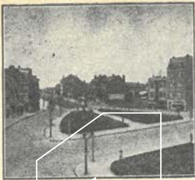
SQUADRE H. REY