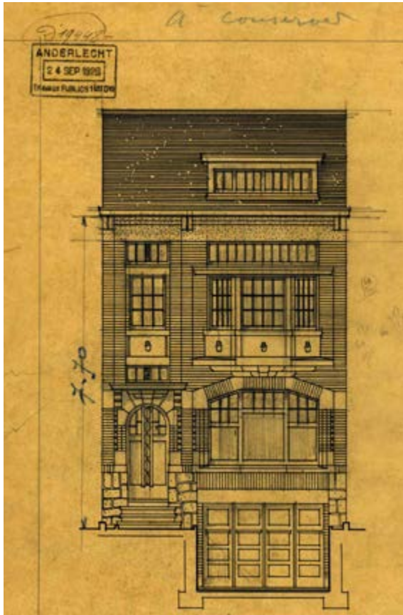
FIG. 1 Élévation de la façade principale (© archives de la commune d'Anderlecht - fonds TP).

P ouvons-nous inviter les fantômes de celles et ceux qui ont habité nos maisons à revenir sur les lieux de leur vie passée pour nous raconter leur histoire ? Et s'ils se manifestent, leur présence sera-t-elle réconfortante ? Leur récit sera-t-il susceptible de nous émouvoir ? Nous aidera-t-il à entrer en interaction avec le décor de notre quotidien ? Peut-il intéresser un lecteur ? Depuis près de trente ans, je tente de répondre à ces questions en prenant ma maison comme sujet d'étude.