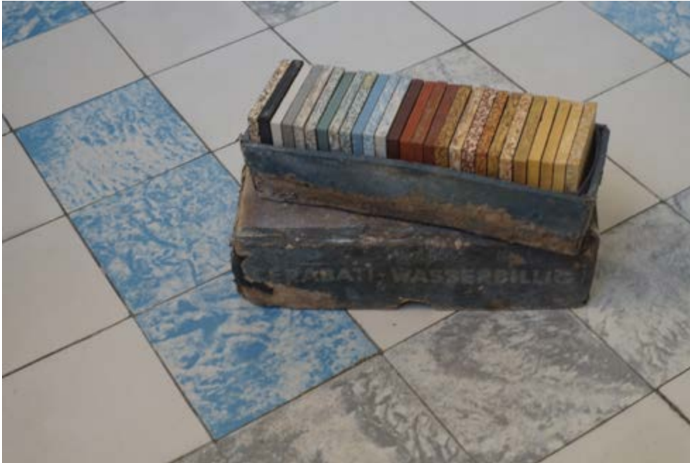
FIG. 5 Le choix de matériaux de qualité est essentiel pour la durabilité d'un aménagement. En redécouvrir la pertinence par une identification précise permet d'encourager sa préservation. Carreaux en grès cérame de la salle de bains et échantillons retrouvés dans la cave : Cerabati-Wasserbillig.

plaque de propreté sont remplacées par des modèles nickelés 30 .