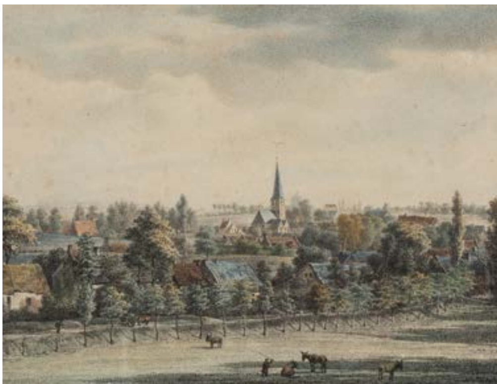
FIG. 4 Village de Schaerbeek, Alexandre Boens, estampe sur papier, s.d. (© coll. communale de Schaerbeek inv. 676).