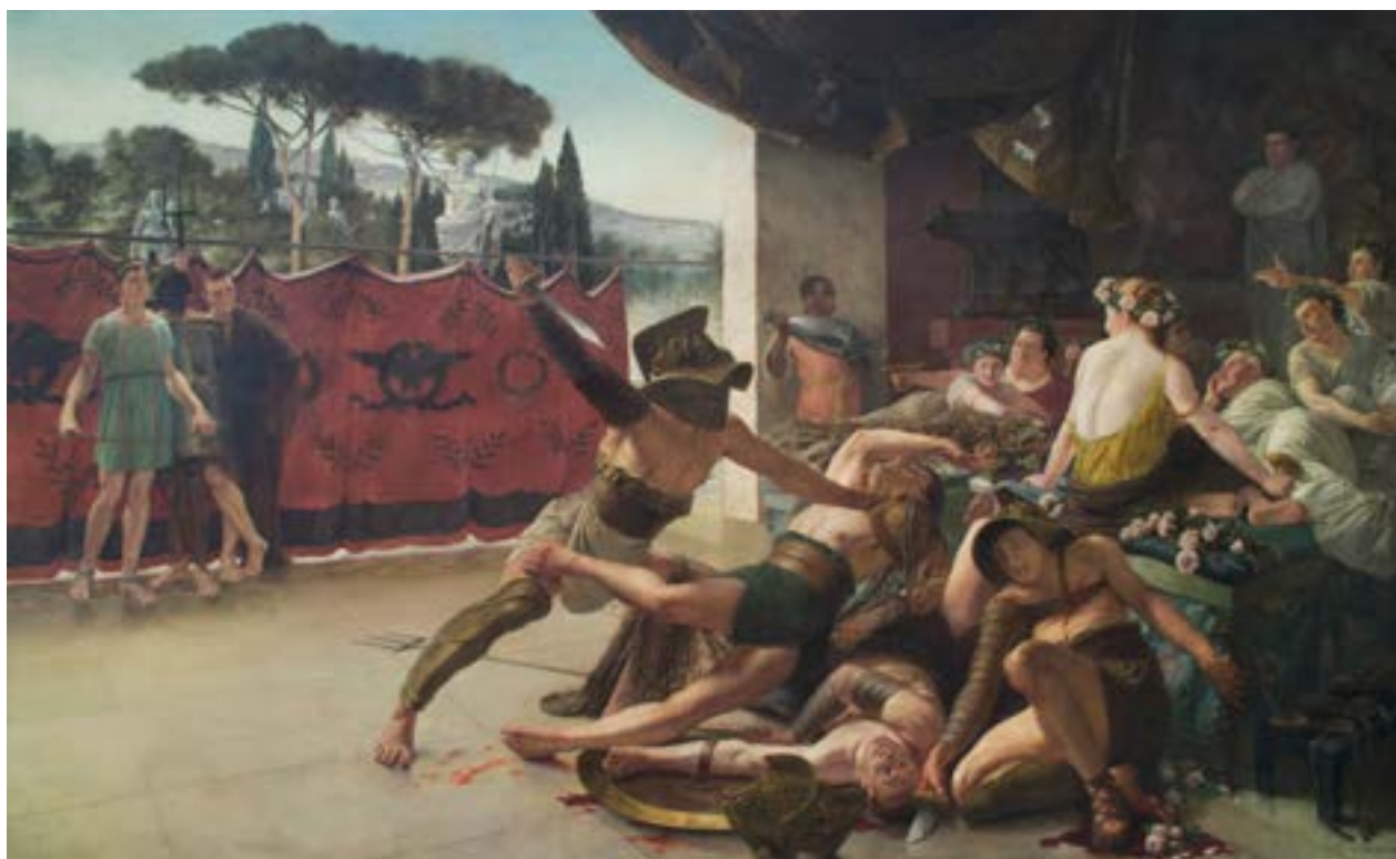
FIG. 3 Mundus Romanus , Antoine Van Hammée, peinture à l'huile, 1893 (© coll. communale de Schaerbeek, inv. 514).

les œuvres lorsque l'intervention est mineure, mais pour les plus grands projets de restauration, nous faisons appel à des équipes de restauration externes.