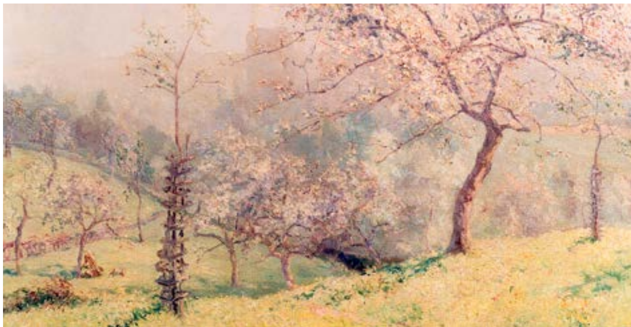
FIG. 1 Matin de mai , Yvonne Vonnot-Viollet, peinture, 1931.