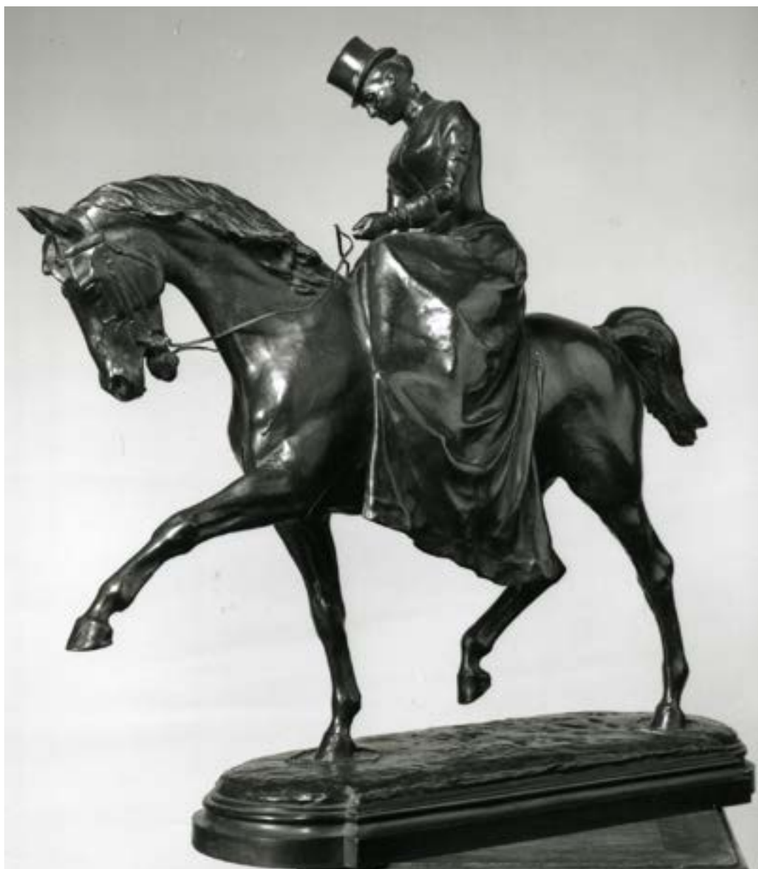
FIG. 5 Amazone, Godefried Devreese, sculpture en bronze, s.d. (© coll. communale de Schaerbeek, inv. 710).