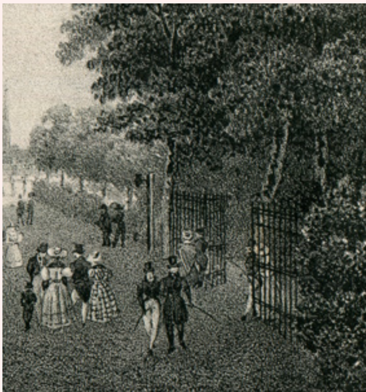
FIG. 3A Place du Palais Royal, à Bruxelles. Détail d'une lithographie d'après le dessin de Sturm [1829 ?], extrait d'un recueil de lithographies anonymes. A droite, on remarque la haie qui forme la limite du parc.

l'espace public. Les représentations de ces architectures éphémères permettent d'imaginer l'aspect de ces simulacres (FIG. 1).