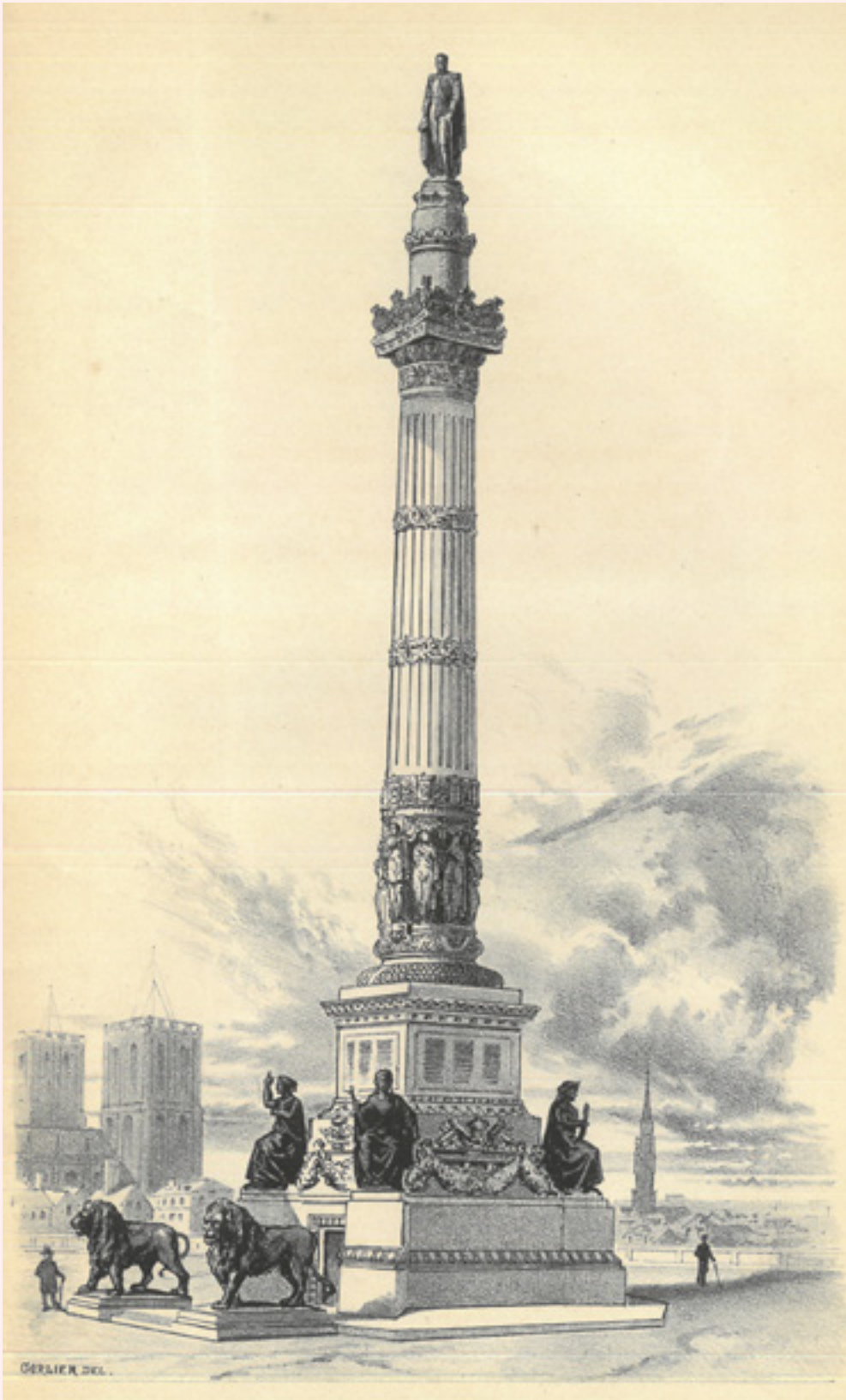
FIG. 4 La colonne du Congrès (STAPPAERTS, F. La colonne du Congrès à Bruxelles, notice historique et descriptive du monument , Bruxelles, 1860).