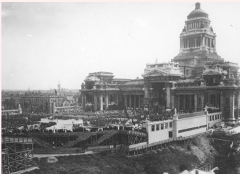
FIG. 1 Architectures éphémères édifiées place Poelaert en 1905 à l'occasion du 75 e anniversaire de la Belgique.

gratte-ciel nouvellement érigés place Rogier ? La décapitation qu'on réclame n'eût pas été nécessaire.