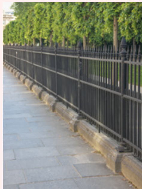
FIG. 3B Les grilles du parc de Bruxelles aujourd'hui.

L'escalier qui mène à la collégiale est fortement dégradé et est devenu dangereux. Il s'agit de reconsidérer l'accès à ce monument et son inscription dans l'environnement urbain. Le dégagement du parvis Sainte-Gudule et des abords de l'ancien hospice Sainte-Gertrude est l'occasion d'une mise en valeur. Les nouvelles possibilités d'aménagement suscitent l'intérêt général. Entre 1852 et 1855, de nombreux projets parviennent au Conseil communal, signés par les architectes en vue à Bruxelles qui s'exercent en maniant le style néogothique. L'aménagement des abords de la collégiale est