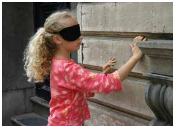
Fig. 1a et 1b

Une éducation par le patrimoine. À Ixelles, découverte du patrimoine, de ses formes, de ses matériaux à travers le regard de l'autre et ses propres mains. La découverte du quartier devient aussi une aventure commune permettant de tisser des liens entre les personnes (2004).