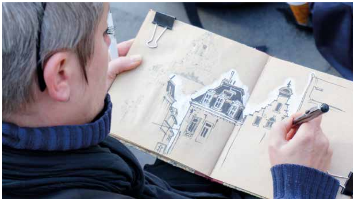
Fig. 4 Sortie des Urbans Sketchers le long de la ligne du tram 92 lors des Journées du Patrimoine de 2014. Le dessin in situ à l'honneur (2014 © Patrimoine à Roulettes).

Tout être est sensible à l'espace dans lequel il vit. L'espace influe sur le relationnel et la sphère intime. Le lieu d'animation n'échappe pas à la règle. Il peut même devenir un acteur à part entière dans l'élaboration du travail avec le public. Des espaces