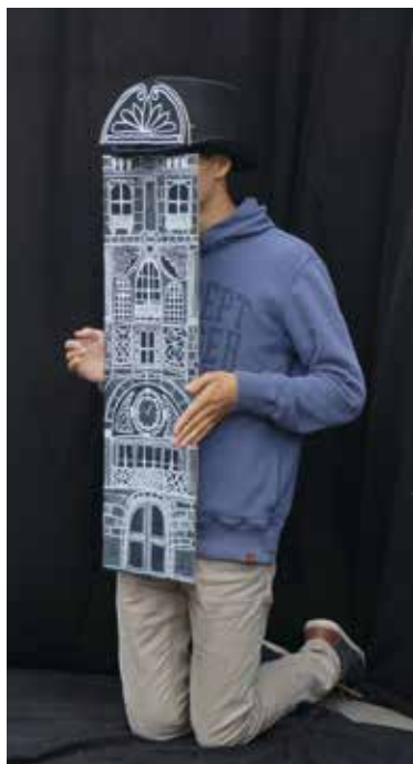
Fig. 3 Regarder, dessiner et partager à travers un atelier photo particulier lors des Journées du Patrimoine de 2016. La créativité au service d'une approche décomplexée du Patrimoine (2016).