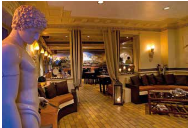
Fig. 2 Depuis les années 1980, les Bruxellois grecs jouent sur le penchant pour l'exotisme de leurs clients avec des statues de dieux et d'autres références à l'Antiquité. Restaurant le Parthenon, chaussée de Ninove 303, Anderlecht ( www.leparthenon.be ).

dissent en plusieurs langues sont d'ailleurs celles qui connaissent la plus forte croissance. Cette réalité hybride est, elle aussi, à intégrer dans notre récit sur le patrimoine de l'immigration.