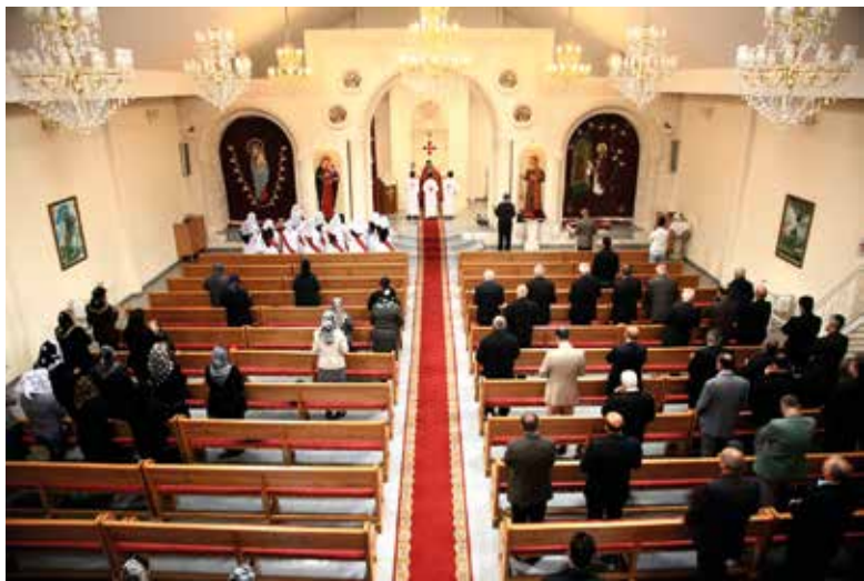
Fig. 5 Un espace transformé en église orthodoxe syrienne, rue Jacob Fontaine 122 à Jette, avec des croyants originaires du Moyen-Orient et de Turquie.

Les Albanais qui avaient fui leur pays et le régime communiste du dictateur Enver Hoxha ont opté, en 1968, pour l'érection d'une statue tout près du parc Josaphat. Il s'agit de l'effigie de Skanderbeg, un prince qui organisa la résistance contre les Ottomans au XV e siècle et devint ainsi le symbole du nationalisme albanais ultérieur (fig. 4). Les Albanais bruxellois possédaient ainsi un point d'appui matérialisant leur amour pour la patrie dans la diaspora. Il s'agissait pour la plupart de montagnards du nord du pays qui tenaient fermement aux traditions édictées dans le Kanun . Comme ce modèle était soumis à forte pression en Albanie et que l'on se trouvait, en Belgique, dans un environnement étranger, il était important de conserver ses habitudes et de préserver son identité 14 .