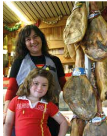
Fig. 9 L'Economato Español de la rue d'Argonne à Saint-Gilles, modeste témoin de la présence d'ouvriers immigrés espagnols jadis autour de la gare du Midi.

les églises pentecôtistes brésiliennes et subsahariennes qui ont trouvé refuge dans d'anciens hangars du XIX e siècle dans la zone du canal (fig. 8). Et n'oublions pas, bien entendu, la Grande Mosquée de Bruxelles, installée depuis 1969 dans un ancien pavillon de l'Exposition universelle de 1897 dans le parc du Cinquantenaire et qui abrite également le Centre culturel islamique de Belgique.