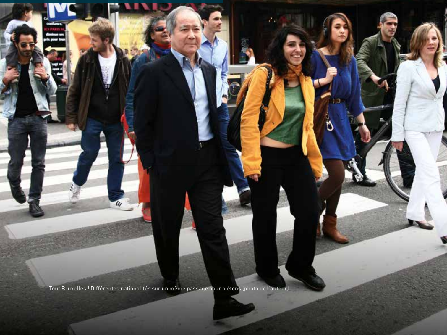
Tout Bruxelles ! Différentes nationalités sur un même passage pour piétons.

HISTORIEN, AUTEUR, COLLABORATEUR DES CLASSES DU PATRIMOINE & DE LA CITOYENNETÉ