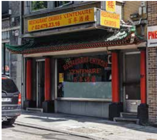
Fig. 1 Messages cachés dans le marketing de façade ethnique. Le toit de pagode chinoise en guise de symbole d'accueil dans un palais.