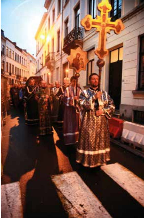
Fig. 6 Orthodoxes russes en route vers leurs coreligionnaires grecs à Ixelles pendant le week-end pascal.