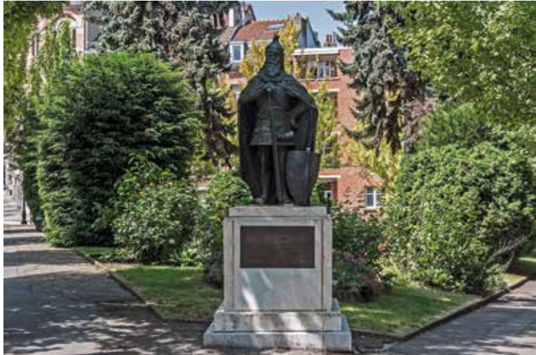
Fig. 4 La statue de Skanderbeg, héros des Albanais de première génération, sur le square Prévost-Delaunay à Schaerbeek (A. de Ville de Goyet, 2018 © BUP/BSE).

1932, lorsque les géants industriels Fiat, Olivetti et le fabricant de pneus Pirelli achetèrent l'édifice à la demande du ministère italien des Affaires étrangères. La Casa de Italia avait pour visée de convaincre, par du théâtre et des cours de langues gratuits, les Italiens bruxellois de se rallier à la cause du Duce. Pendant la Seconde Guerre mondiale, on y a généreusement distribué des tickets de rationnement et fraternisé avec les nazis 13 . Comme souvent dans un contexte d'immigration, les clivages du pays d'origine subsistaient dans le pays d'accueil. Le drame italien de l'entre-deux-guerres s'est exprimé à Bruxelles par l'opposition entre les fascistes et les antifascistes.