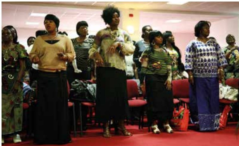
Fig. 8 Prières, chants et danses dans une ancienne entreprise de transformation de viande. L'église pentecôtiste de la rue Heyvaert à Anderlecht.