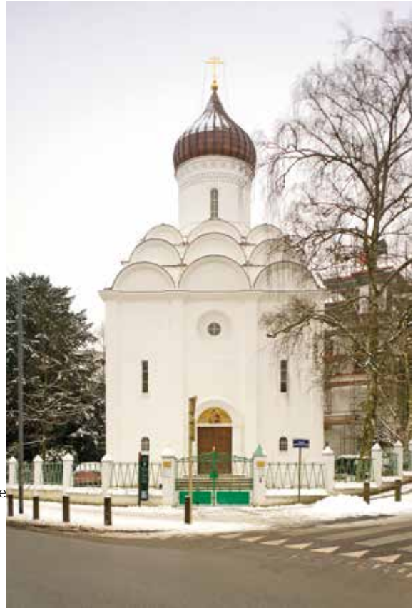
Fig. 7 L'église orthodoxe russe le long de l'avenue De Fré à Uccle. Un petit fragment de Moscou à Bruxelles.

la Chapelle remplissait également une importante fonction passerelle pour les Polonais sans papiers depuis 1990. Ils s'étaient frayé un chemin dans le monde bruxellois du nettoyage et de la construction et pouvaient s'y retrouver pour du travail, du logement et des problèmes de traduction. L'église était un lieu de rassemblement entre les Polonais installés et les nouveaux immigrants 15 . Cette église est d'emblée aussi un emblème de récupération pure et simple d'un patrimoine architectural existant, parfois même sans que l'on touche de quelque manière que ce soit à l'intérieur. De nombreuses autres églises ont ainsi bénéficié d'une deuxième vie, parce qu'elles ont été reprises en partie ou en totalité par