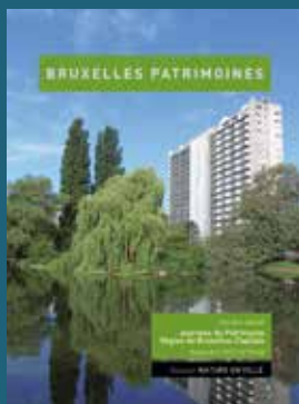
023-024 - Septembre 2017 Nature en ville