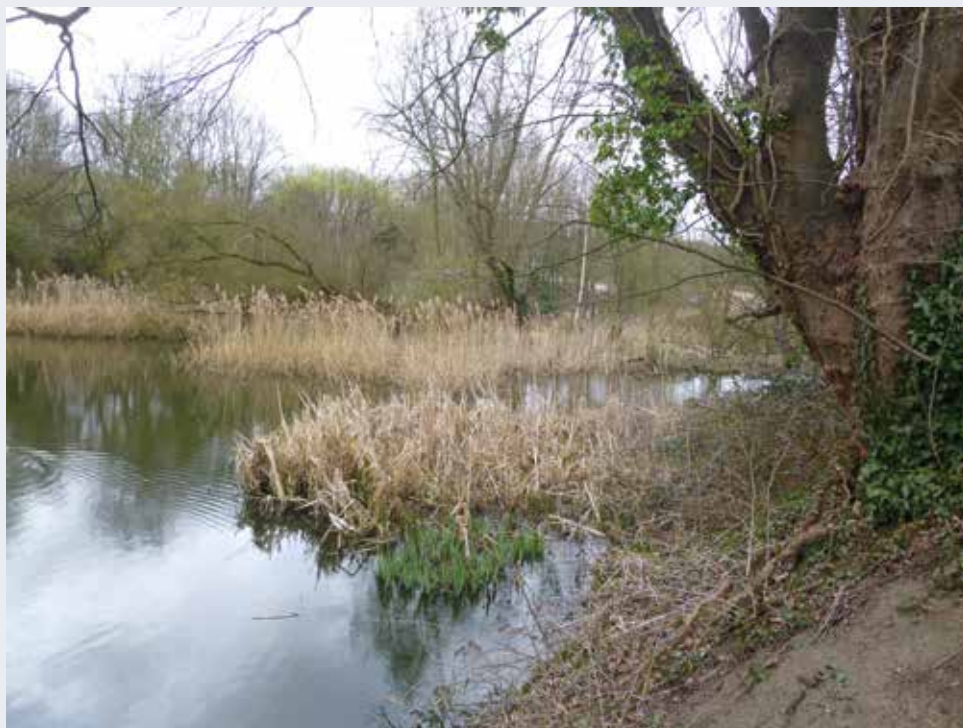
Le site du Moeraske qui s'étend sur trois communes : Evere, Haren et Schaerbeek (2016 © BUP/BSE).

Les sites semi naturels constituent une facette du patrimoine bruxellois. Il s'agit de sites où la nature, en partie sauvage, mais aussi en partie gérée, est offerte à l'observation du public. Le milieu est maintenu en l'état pour préserver ses qualités et particularités écologiques, par exemple au Moeraske. Dans certains cas, comme au Kawberg, le site nous rappelle également le passé agricole de la Région.