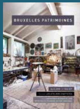
026-027 - Avril 2018 Les ateliers d'artistes