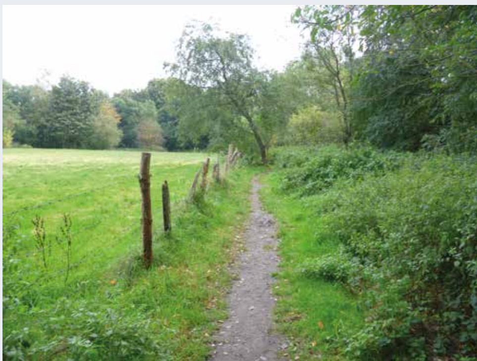
Le Site du Kawberg à Uccle (2016 © BUP/BSE).