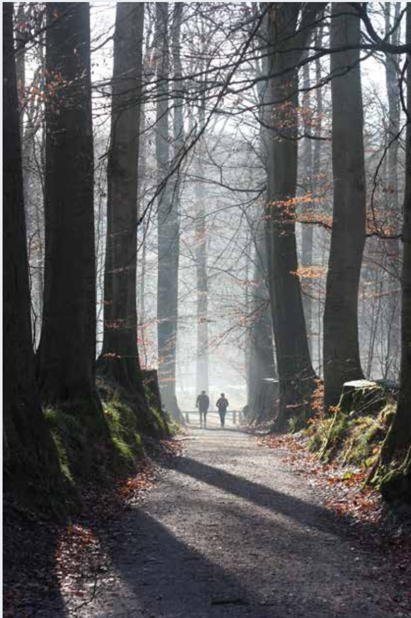
Forêt de Soignes. Expérience photographique internationale des Monuments 2014.