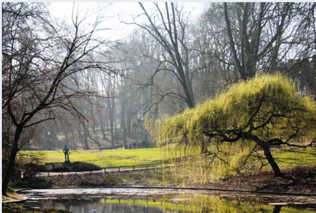
Parc Josaphat à Schaerbeek. Expérience photographique internationale des Monuments 2012.