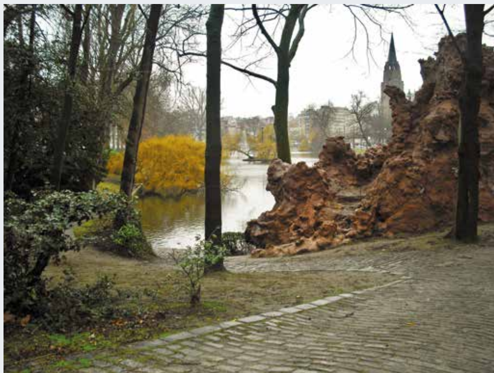
Étangs d'Ixelles. Expérience photographique internationale des Monuments 2017.

Le patrimoine naturel fait partie intégrante de la structure urbaine de Bruxelles telle qu'elle a été pensée au XIX e siècle et qui se matérialise par de nombreux parcs. Certains ont été créés sur base de sites naturellement beaux, comme le parc Josaphat ou les aménagements des étangs d'Ixelles. D'autres ont été créés de toutes pièces, comme le parc de Woluwe. La nature est aménagée, imitée, mise en scène.