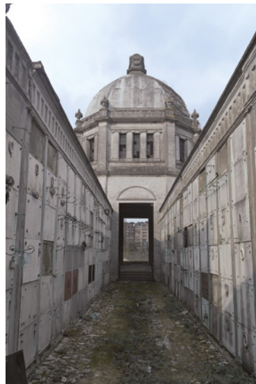
Allée centrale. Situation en avril 2016, après la restauration.