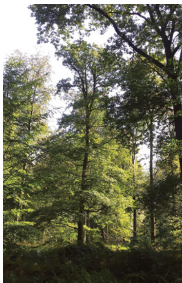
(I. Leroy © SPRB).