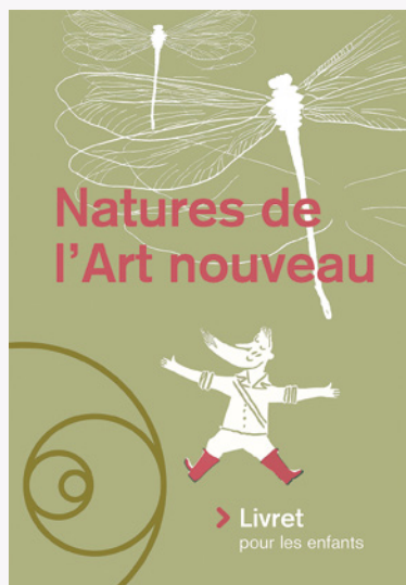
Fig. 2 Couverture du livret éducatif Natures de l'Art nouveau , accompagnant l'exposition du même nom.

Parallèlement à ces rencontres, des échanges bilatéraux entre les partenaires leur ont permis d'effectuer un séjour d'étude dans une autre ville ou de bénéficier de la visite d'un expert dans leur propre ville. Ainsi les partenaires bruxellois ont pu approfondir, entre autres, leurs connaissances sur le mouvement Arts & Crafts et les papiers peints Art nouveau anglais en Grande-Bretagne ou envoyer une restauratrice étudier les sgraffites et les techniques de restauration à Barcelone, en vue d'exploiter ces bonnes pratiques à Bruxelles.