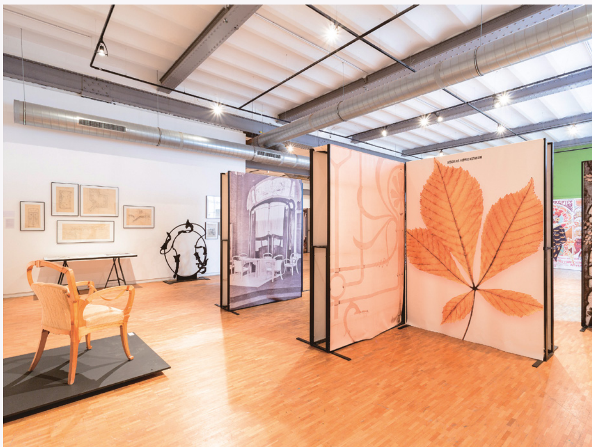
Exposition Flora's Feast, organisée au CIVA en 2016.