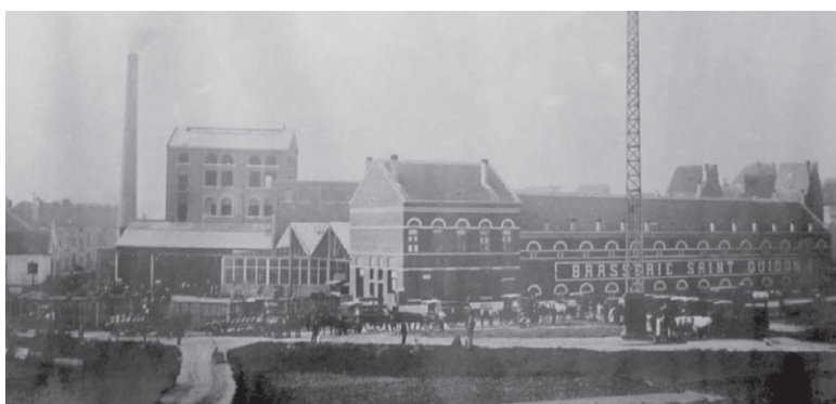
Fig. 1 Vue de la Brasserie Saint-Guidon avant sa reprise par S.A. Atlas.

La brasserie Atlas fut érigée dans la zone du canal à Anderlecht entre 1913 et 1924, dernière période faste de l'industrie brassicole à Bruxelles. Le complexe se compose de plusieurs bâtiments avec chacun une fonction spécifique. La brasserie illustre le développement de la production locale de bière et le passage d'une activité artisanale à une industrie à grande échelle, avec des sites complexes spécialement conçus à cet effet. De la brasserie d'origine, qui ne compte qu'un unique bâtiment, on passe ainsi à un complexe de bâtiments doté d'une tour de brassage, d'un atelier, d'un entrepôt, de bureaux, d'écuries et d'un hangar. La brasserie perdit sa fonction initiale en 1950 lors du rachat par la brasserie Haacht, mais les bâtiments restèrent intacts. Seules les installations de brassage furent démantelées lors de la reprise (fig. 1).