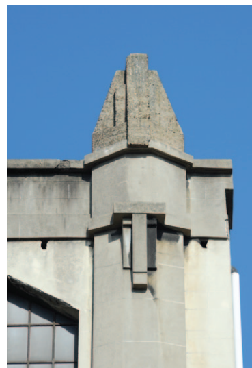
Fig. 6 Façade de la tour. Détail d'un pilastre de la tour en style Art Déco, parfait symbole de modernité.

En 1912, à la demande du brasseur François Schelfaut, l'architecte et entrepreneur Installé, relativement inconnu à ce jour, dessina les plans d'une brasserie de gueuze fonctionnant à la vapeur. Celle-ci fut construite un an plus tard et fut baptisée Brasserie Saint-Guidon , d'après le saint patron de la commune. Le complexe fut également doté d'un immeuble d'habitation avec bureaux et réfectoire, ainsi que d'écuries d'une capacité de cent chevaux. Le développement de cette parcelle en grande partie non bâtie s'inscrivait dans le plan de développement