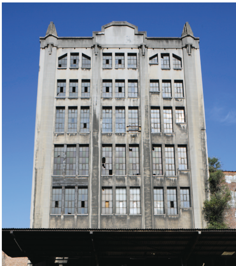
Fig. 5 La façade Art Déco de la tour de la brasserie lui a servi de vitrine publicitaire.

sion économique et culturelle au quartier. La grande reconversion la plus récente est celle de la brasserie Belle-Vue (1916, 1931-35) dans la zone du canal à Molenbeek-Saint-Jean. En 2013, elle fut transformée en hôtel destiné tant à des familles qu'à des voyageurs de passage. La commune de Molenbeek-Saint-Jean a également prévu de construire une haute école sur le site. Ces deux projets constituent une impulsion sociale et économique pour la commune.