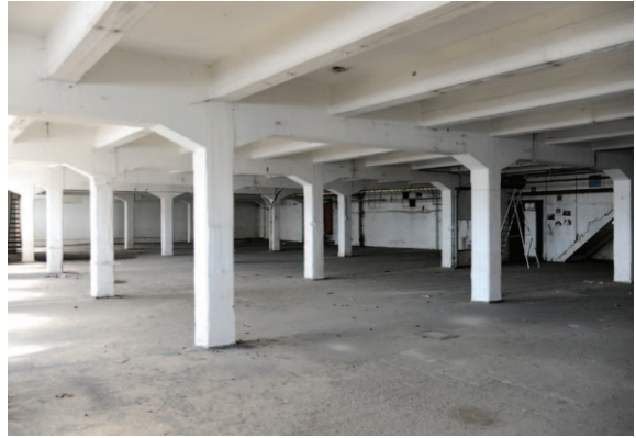
Fig. 13 Rangées de colonnes disposées à intervalles réguliers afin d'assurer des espaces ouverts.