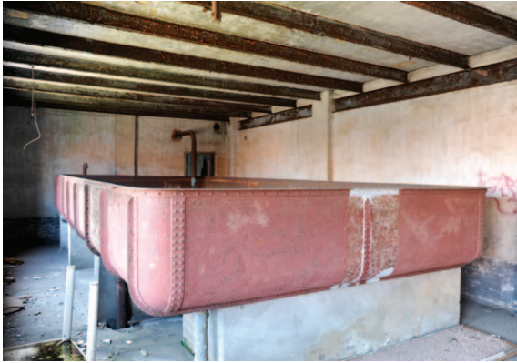
Fig. 12 Cuve de refroidissement métallique à l'étage supérieur de l'entrepôt.