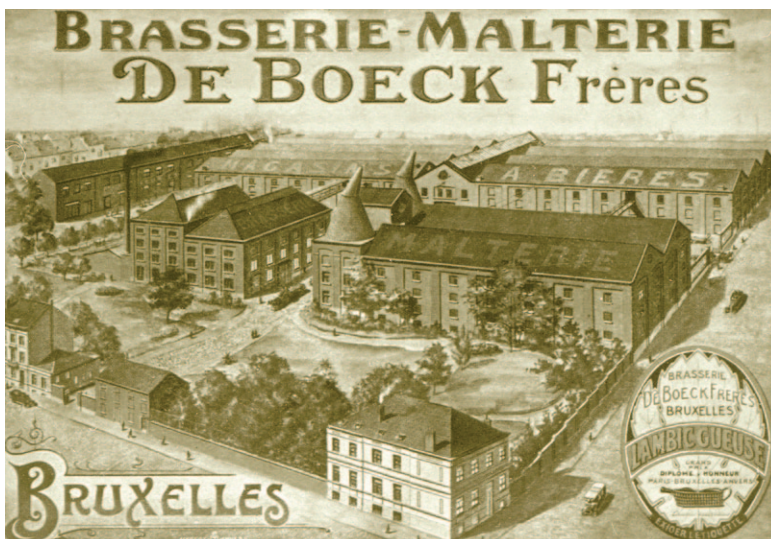
Fig. 3 La brasserie l'Étoile (1875) fut reprise en 1963 par Les Brasseries Unies De Boeck et Goossens.

Sur le plan géographique, les brasseries se concentrèrent autour de la Senne et de la Petite Senne, dont les eaux étaient utilisées pour nettoyer les installations brassicoles et les fûts ainsi que pour y déverser les eaux usées 2 . À partir de 1840, l'industrie se déplaça progressivement en dehors des murs de la ville, pour s'établir à proximité du canal Bruxelles-Charleroi, récemment aménagé, et des premières gares ferroviaires. Durant la seconde moitié du XIX e siècle, les brasseries qui étaient restées dans le centre de Bruxelles furent confrontées à de grands travaux d'infrastructure comme le voûtement de la Senne (1867-1871), l'aménagement des boulevards du centre et le comblement du dernier bassin du port en 1910. Cette année-là, il ne subsistait plus que 18 brasseries 3 dans le centre, contre 68 dans les autres communes de Bruxelles, dont la brasserie Atlas 4 (fig. 2).