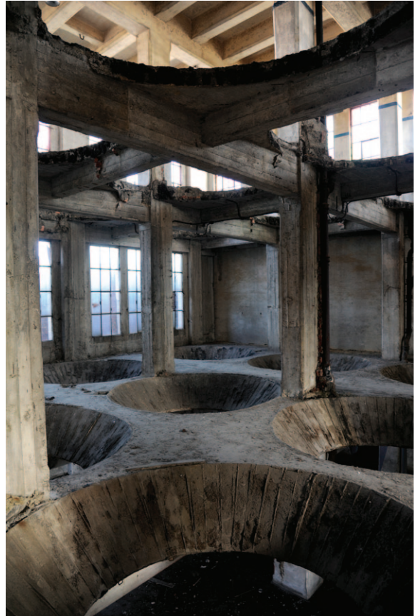
Fig. 8 Dans ces ouvertures rondes dans les plateaux intermédiaires se trouvaient jadis seize cuves aujourd'hui disparues.