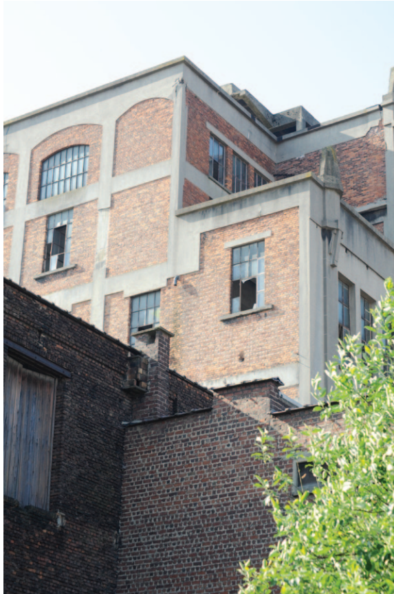
Fig. 7 Sur la façade latérale de la tour, l'ossature en béton avec maçonnerie de remplissage a été laissée visible.