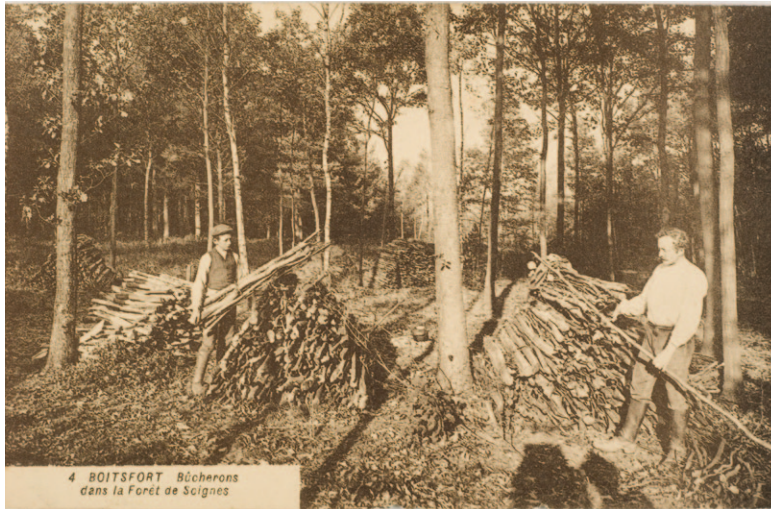
Fig. 1 Bûcherons dans la forêt au début du siècle passé. Carte postale ancienne.