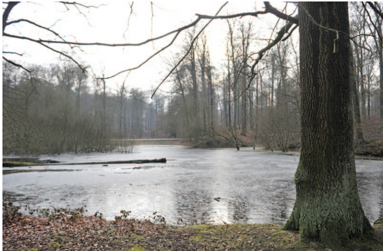
Fig. 4 Réserve naturelle de l'étang du Vuylbeek.

Les réserves forestières dirigées visent à la conservation et au maintien d'habitats et de paysages forestiers typiques et particuliers. Actuellement, il n'y en a qu'une en Région bruxelloise, la réserve forestière du Rouge-Cloître. Elle vise à assurer le maintien de la chênaie à jacinthe. Dans les réserves forestières intégrales, le milieu y évolue selon sa dynamique propre. Aucune intervention n'y est pratiquée, mise à part la sécurisation des chemins. En forêt de Soignes, il existe jusqu'à présent deux réserves forestières intégrales : une en région flamande (la réserve forestière Joseph Zwaenepoel) et une en Région bruxelloise (la réserve forestière du Gripensdelle).