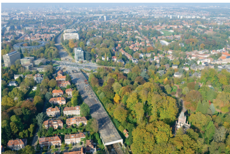
Fig. 7 Travaux du RER au niveau de la voie de chemin de fer Bruxelles-Luxembourg à Watermael-Boitsfort. Le parc Tournay-Solvay offre un espace de transition entre la ville et la forêt.

nouvelles initiatives, des plans de gestion et des projets de restauration grandioses (Groenendael, Rouge-Cloître, parcs de Tervueren et Solvay). En revanche, aucune structure qui favorise la coordination entre les régions en termes de gestion forestière n'a été prévue. Il existe pourtant des aspects qui requièrent une telle coordination: les cours d'eau et les sentiers de promenade dépassent les frontières régionales,