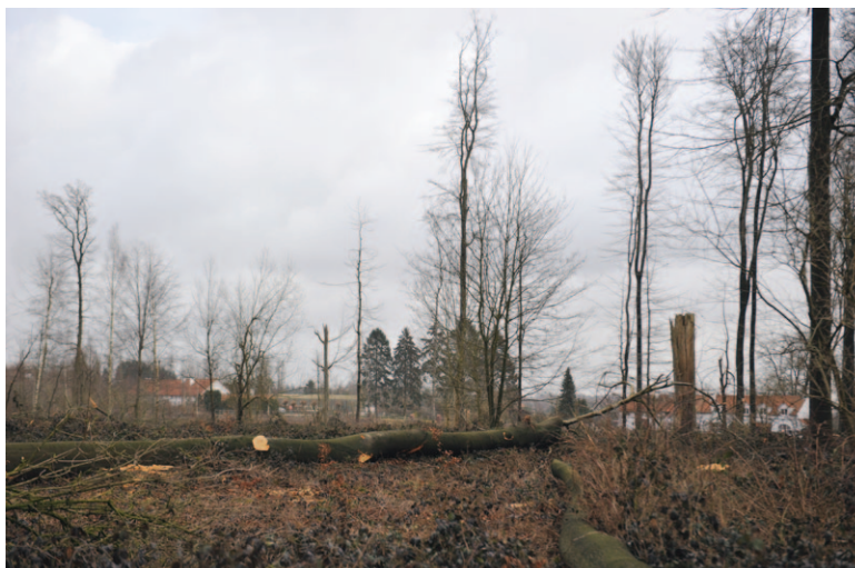
Fig. 5a Chantier d'exploitation de hêtres. Les arbres abattus ont 180 ans, lieu-dit Terrestre.

Étant donné l'âge d'exploitation très élevé des hêtres, les billes montrent une proportion importante de bois creux, pourris, de cœur rouge et de bois tarés. À ces âges, le bois est également rosé. Ce bois déprécié obtient des prix inférieurs à ceux qu'on obtiendrait si les arbres étaient exploités plus jeunes