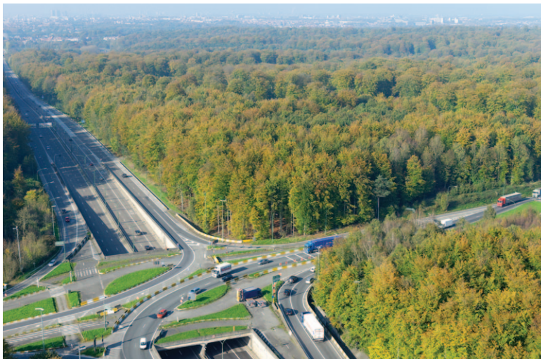
Fig. 6 L'aménagement des infrastructures de transport a entraîné un morcellement important de la forêt de Soignes.

La réforme de l'État de 1980, qui a transféré la compétence de la gestion de la forêt vers les Régions, a entraîné une certaine dynamique dans la gestion du massif, avec de