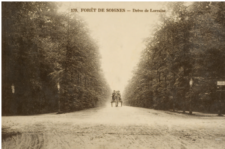
Fig. 2a La drève de Lorraine au début du siècle passé. Carte postale ancienne.