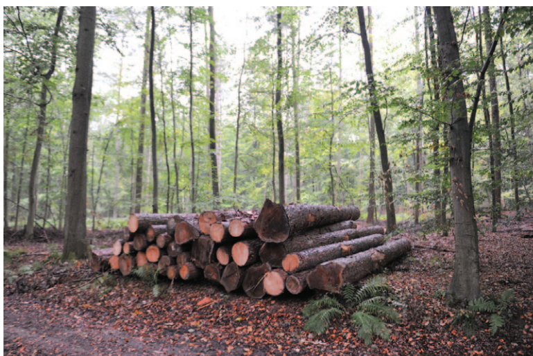
Fig. 5b Stockage en bordure du chemin, avant transport hors de la forêt (M. Blin © ONF).

–jusque 160 ans en théorie–, car ces défauts n'apparaissent alors pas et le bois est blanc et de première qualité. Malgré ces défauts, le hêtre de Soignes se traite, lors des ventes annuelles, à des prix parmi les plus élevés de Belgique (plus de 100 €/m 3 pour les gros bois).