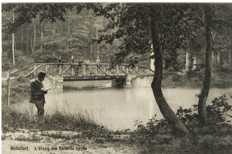
Fig. 2b Boitsfort. Étangs du Fer à Cheval. Carte postale ancienne.