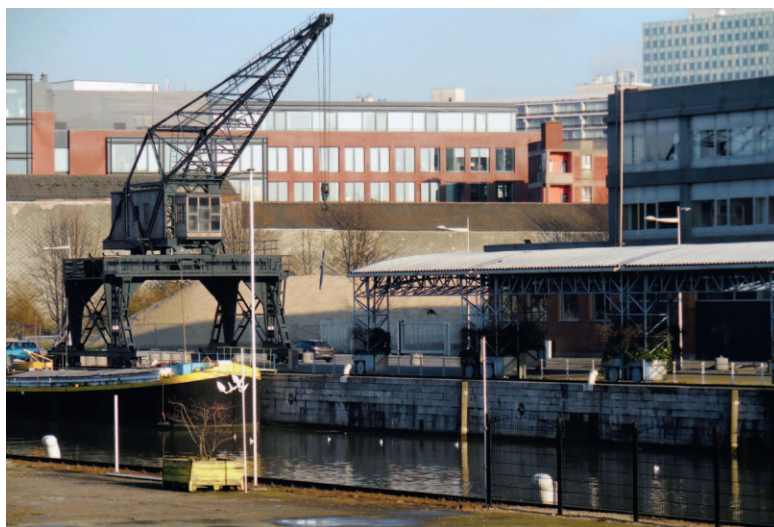
(2015 © Jeanne Baillon).