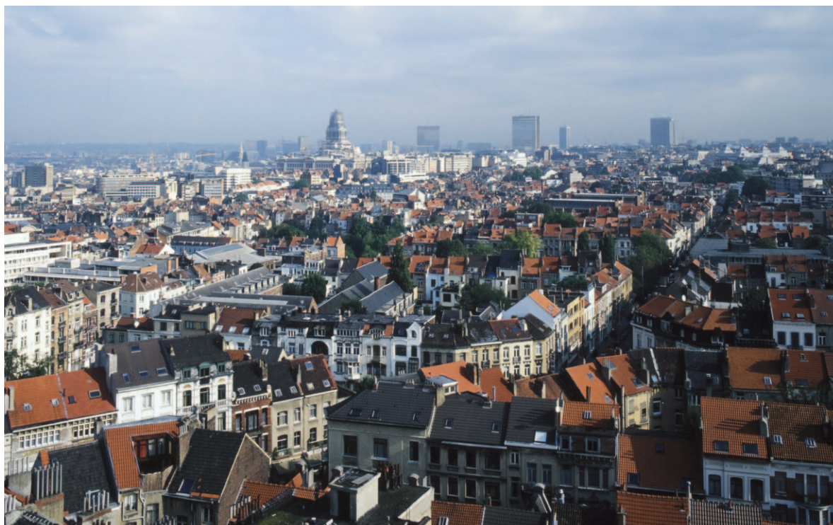
(2008, Ch. Bastin & J. Evrard © SPRB).